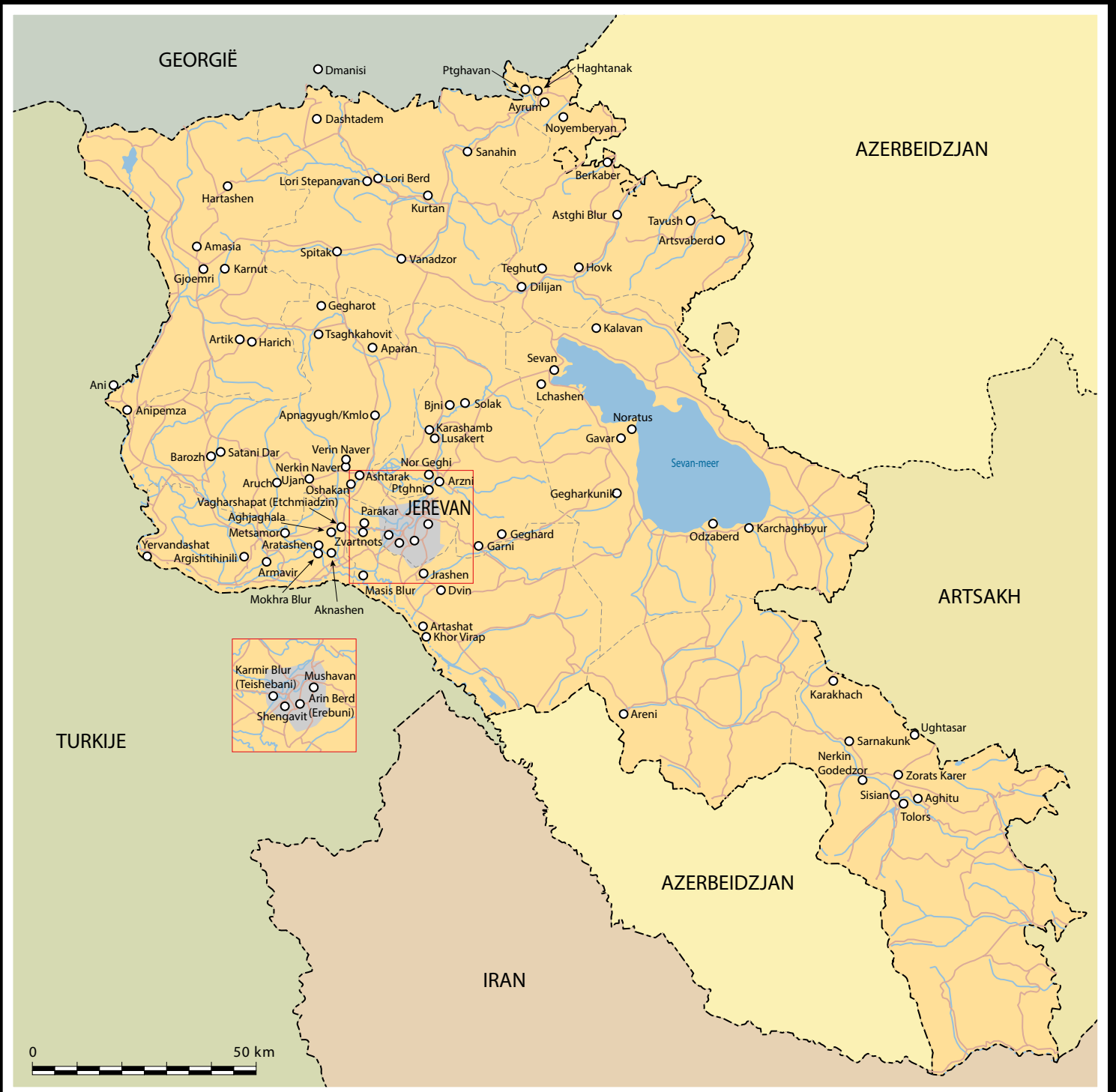
Kaart van Armenië met de belangrijkste plaatsen die in de tekst genoemd worden (situatie tot september 2020).