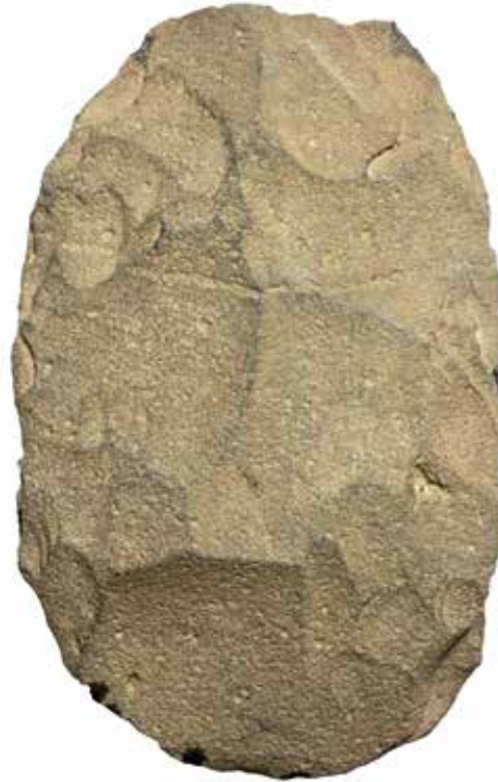
Een vuistbijl (l. 17 cm) uit het Acheulien, gevonden in Lori-Stepanavan. Ca. 500.000-400.000 jaar oud. [HMA-3036-108]

Vermoedelijk gaan de oudste sporen van menselijke aanwezigheid op Armeense bodem zo'n 1,8 miljoen jaar terug. Het gaat om eenvoudige stenen werktuigen die achtergelaten zijn door – vermoedelijk – Homo erectus . Echt hard zijn de dateringen overigens nog niet, het zijn meer verwachtingen op basis van vondsten in buurland Georgië. Na Homo erectus vonden andere menssoorten een bestaan in het Armeense Hoogland, waaronder Homo neanderthalensis . Karakteristieke werktuigen van de Neanderthaler zijn de spits en de vuistbijl. De moderne mens – Homo sapiens – verscheen rond 40.000 jaar geleden in de Zuidelijke Kaukasus. Een van de oudste vindplaatsen in Armenië is een grot bij Aghitu. In deze periode verdween de Nean-