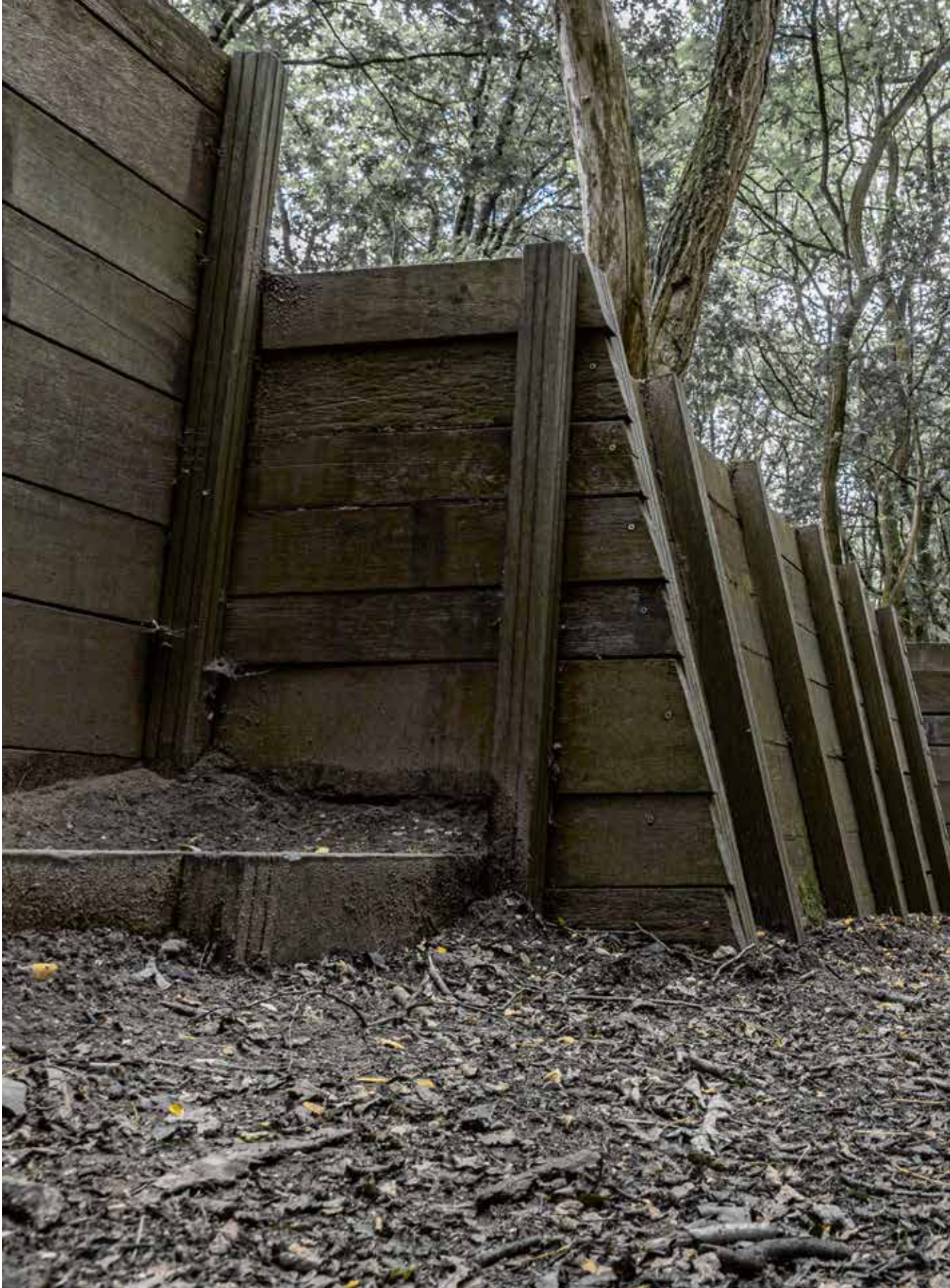
Rhenen, de Grebbeberg