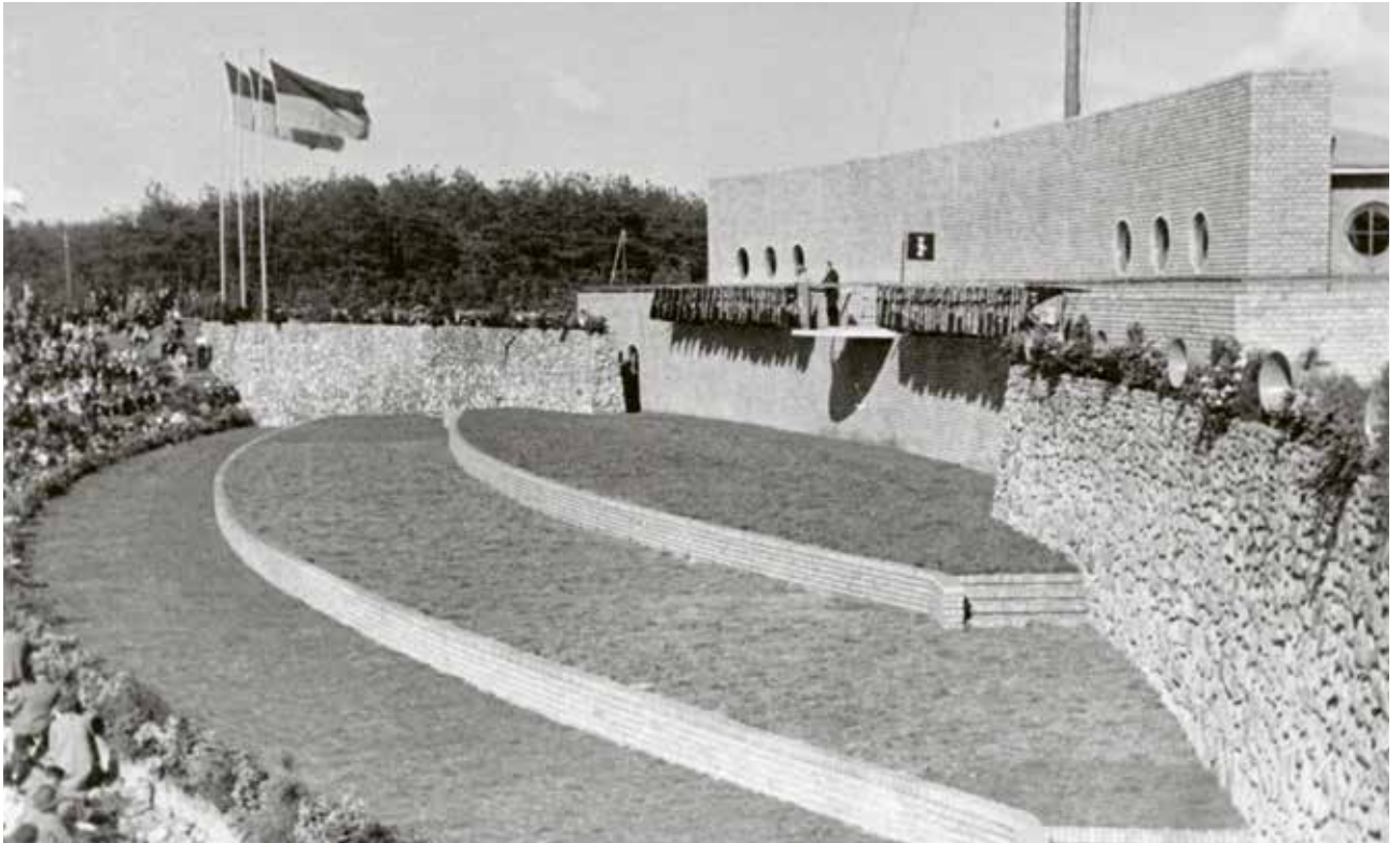
Zo zag de Muur van Mussert er op 22 juni 1940 uit, toen de NSB er haar laatste Hagespraak hield.