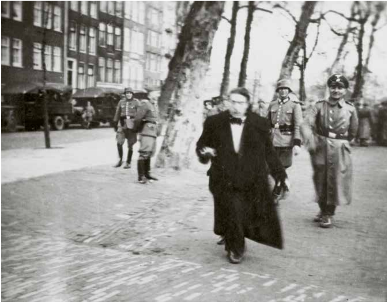
Een van de foto's die een Duitse militair maakte van de razzia op 22 februari 1941 op het Jonas Daniel Meijerplein. Een joodse Amsterdammer wordt opgejaagd door zijn belagers.