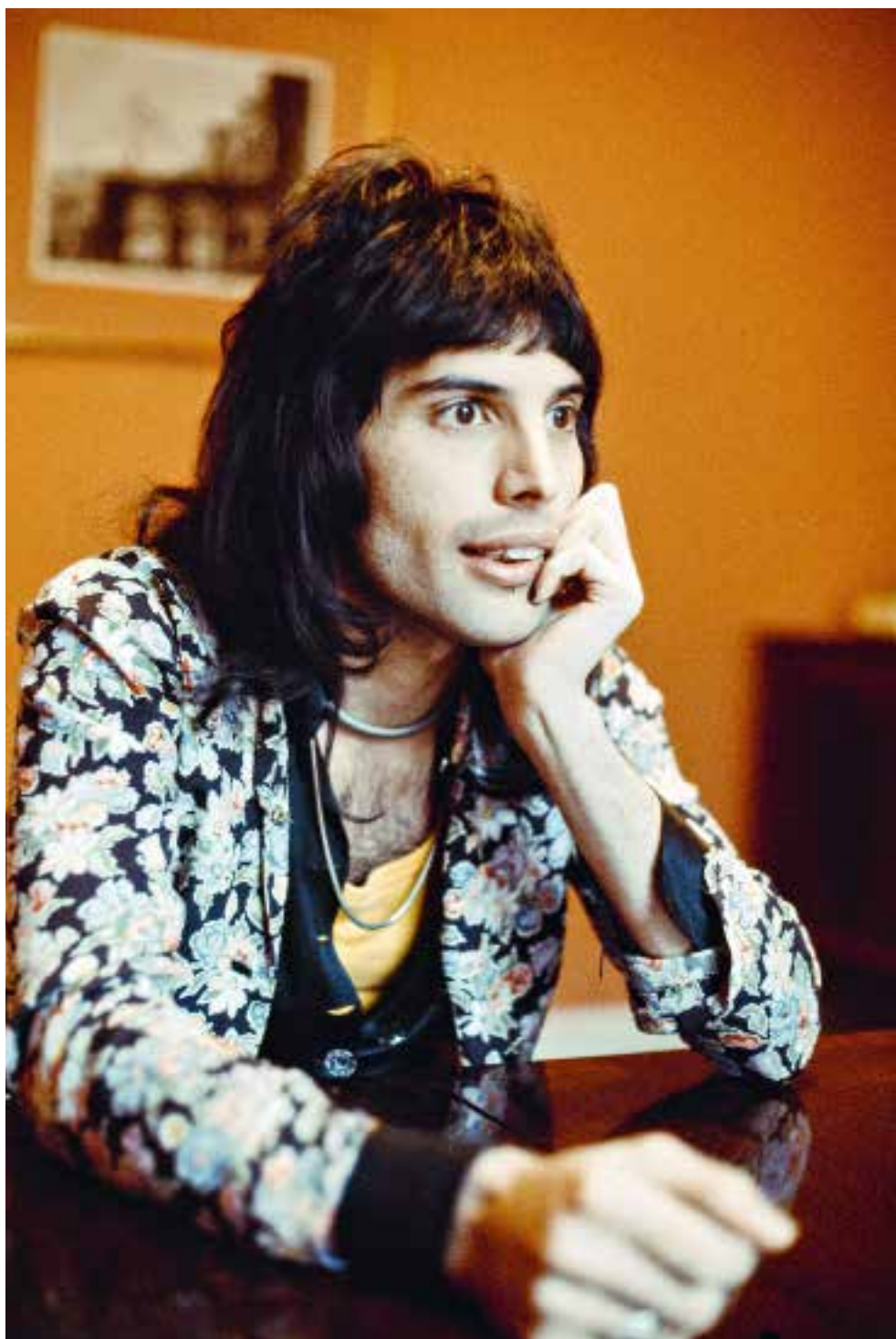
Freddie Mercury in Londen op 12 februari 1974.

onderdelen die een voor een werden samengevoegd, resulteerden inderdaad in een kleine rockopera.