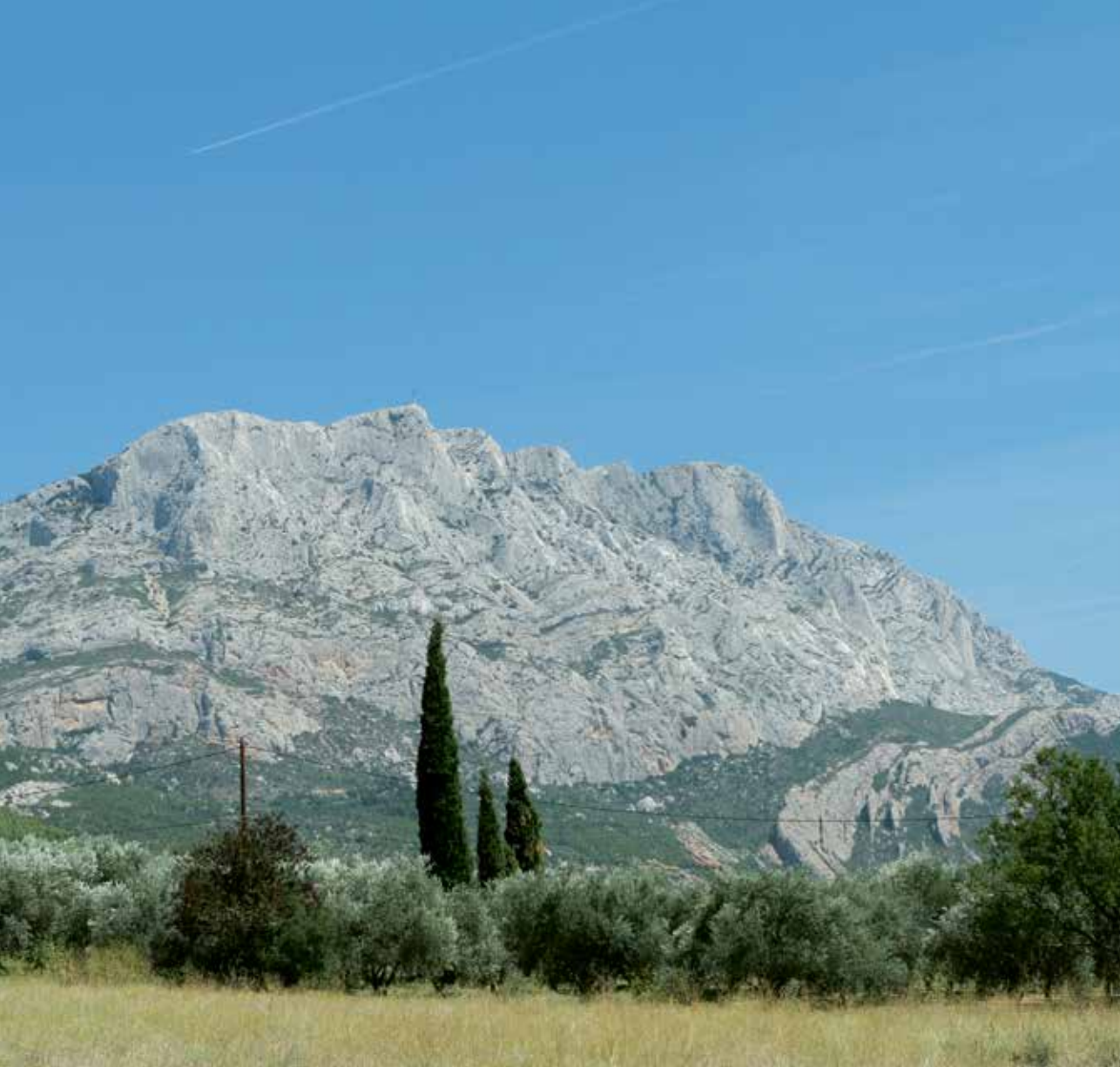
Mont Sainte-Victoire, Aix-en-Provence, Frankrijk

Bijna twintig jaar na die eerste blik op een Cézanne huurde ik met mijn geliefde een huis in de Provence, aan de voet van de Luberon. We bleven er zes weken. Dagenlang verkenden we het landschap van Cézanne rond Aix, steeds in het zicht van de Mont Ste. Victoire, de berg die hij zo vaak heeft geschilderd en getekend. In Aix bezochten we het atelier dat Cézanne – welgesteld dankzij de erfenis van zijn vader – aan de toenmalige rand van de stad liet bouwen. Het is een eenvoudig huis in Provençaalse stijl. De hele bovenverdieping is atelier, een hoge ruimte van zes bij acht meter met een glazen wand op het noorden