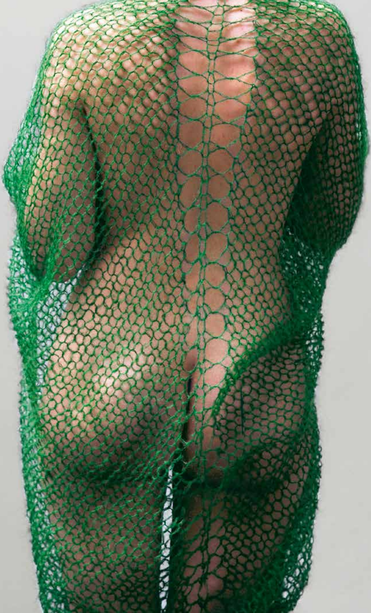
2001 Bloom Paris Knitting Nature by Kathryn Hearn