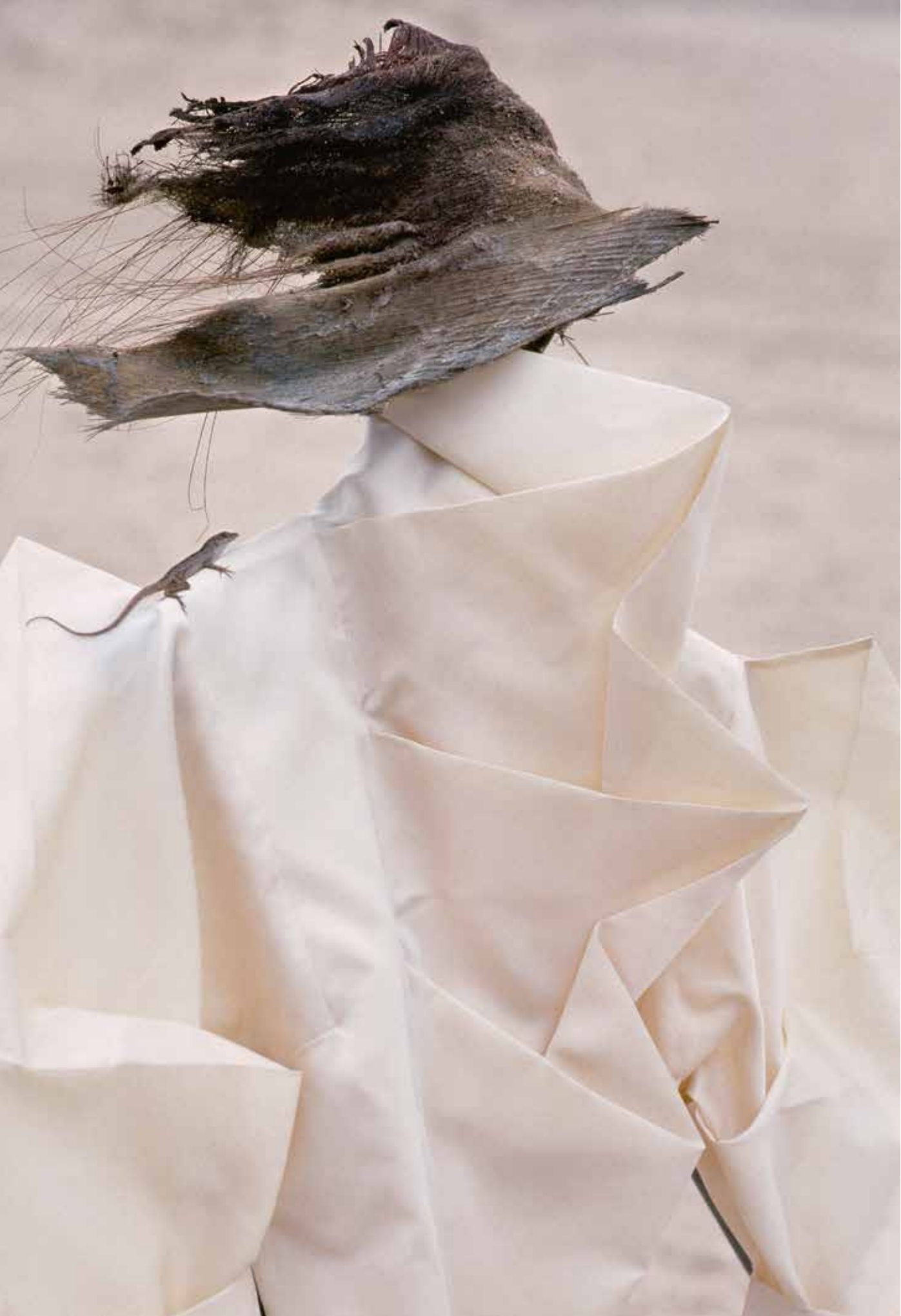
1991 Marie Claire Fort Lauderdale Kleding Issey Miyake