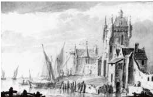
15. HENDRICK VAN ANTHONISSEN?, DE ZUIDHAVENPOORT, ZIERIKZEE.

eerder maakt en daarmee een opmaat naar schilderijen waarin hij wat afstand neemt van Porcellis. Zo'n werk is Schepen bij Zierikzee met de Zuidhavenpoort in de achtergrond (afb. 14). Hendrick van Anthonissen moet hiervoor wel in Zeeland zijn geweest en dus in Zierikzee. Het schilderij is tussen 1640 en 1650 te dateren en toont Van Anthonissen op zijn best. Niet alle details zijn correct weergegeven, maar hij komt een heel eind. Het is een bijzonder aantrekkelijk werk met een uitgeknipte verdeling in lichte en donkere partijen en een uitzonderlijk gevoel voor detail. Dat komen we bij Hendrick meestal alleen bij vlaggen tegen, maar dit schilderij is ervan doordeesemd. Vader Aert gebruikt lichte verf om te accentueren. Hendrick past het trucje wel toe langs de randen van de paaltjes en drijfhout waarop hij signeert. Bij Schepen bij Zierikzee [...] is deze werkwijze op veel meer plekken waar te nemen, zij het dat hij hier vooral dunne witte sliertjes verf gebruikt om details uit te lichten, zoals bij de