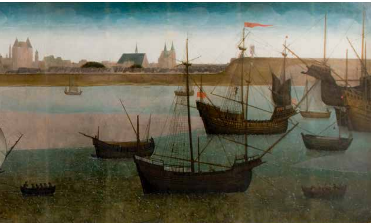
5. ANONIEM, REDE VAN ZIERIKZEE, 1500-1540. STADHUISMUSEUM ZIERIKZEE, INV. NR. 1363.