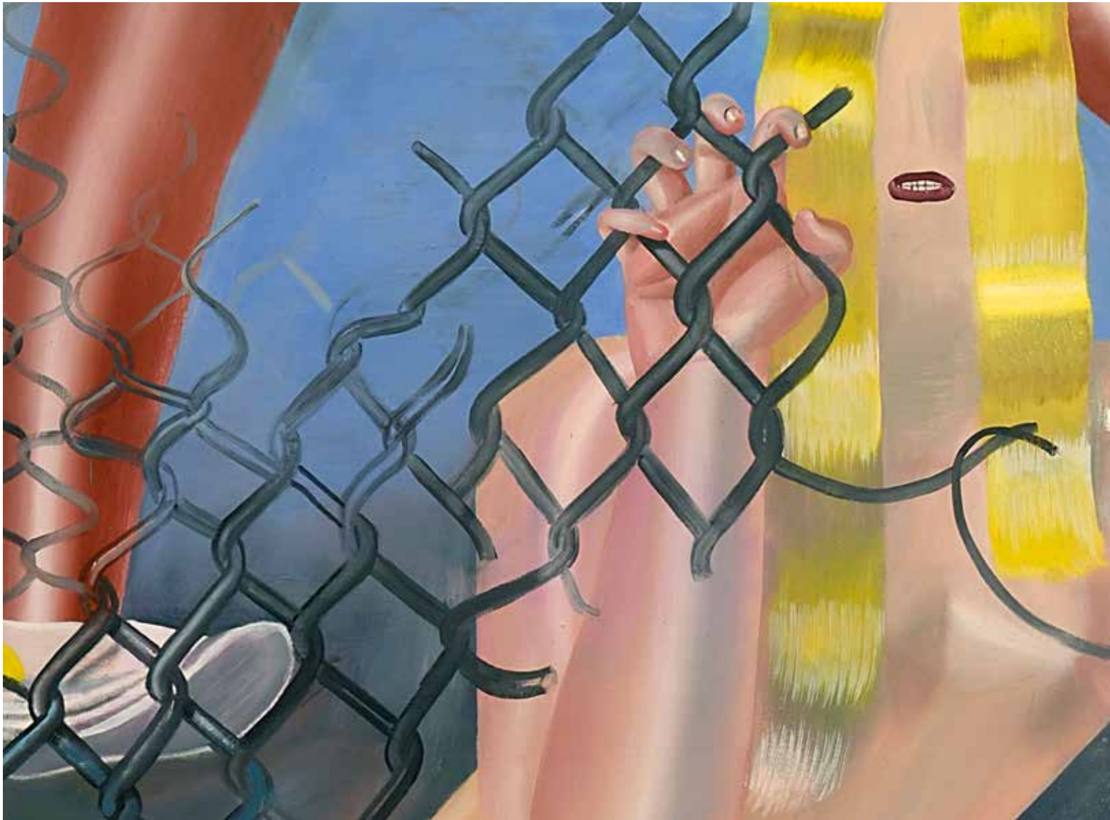
↑ Freistunde [detail]