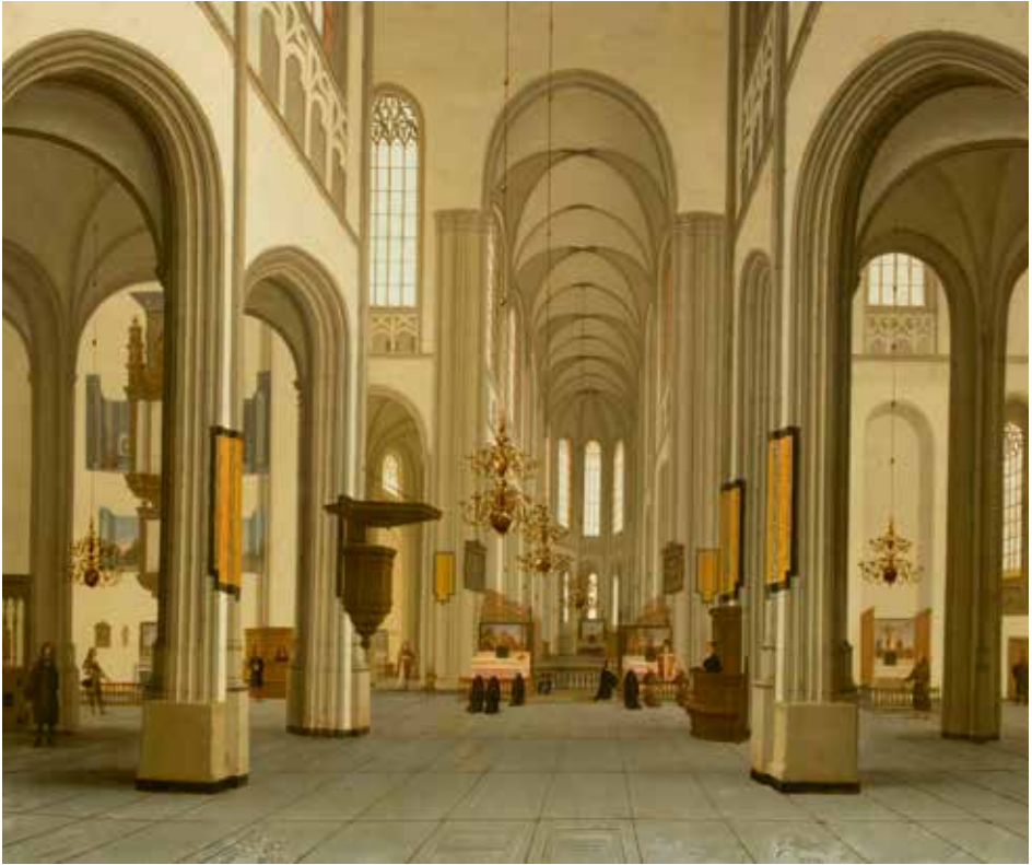
Hendrick van Vliet, Interieur van de Dom in 1672 , olieverf op doek, 1674, Centraal Museum, Utrecht