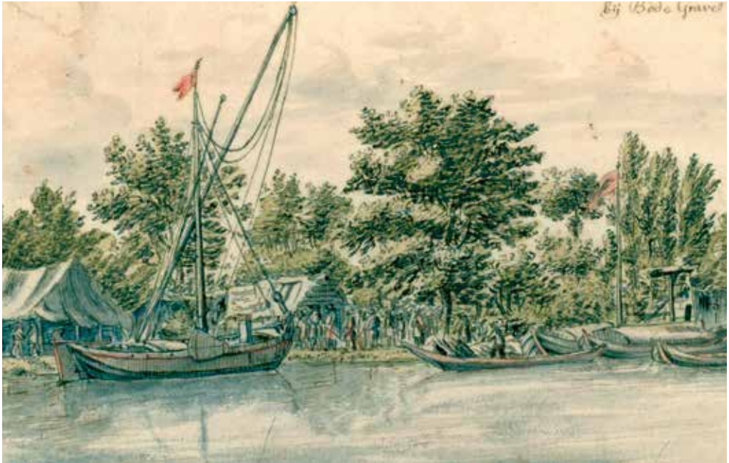
Toegeschreven aan Barend Klotz, mogelijk naar Valentijn Klotz, Gezicht op het hoofdkwartier van prins Willem III in Bodegraven , met waterverf ingekleurde tekening, 1672, Rijksmuseum, Amsterdam

Gevluchte edellieden werden geprest om te betalen onder dreiging hun kastelen in brand te steken, de beruchte brandschatting. Door de geldbuidel te trekken wist Hendrik Jacob van Tuyll van Serooskerken Slot Zuylen te redden, maar de eigendommen van andere kasteelbezitters, zoals Nijenrode, Gunterstein of Amerongen gingen in vlammen op. 6