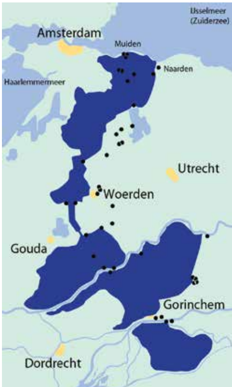
Kaart Oude Hollandse Waterlinie