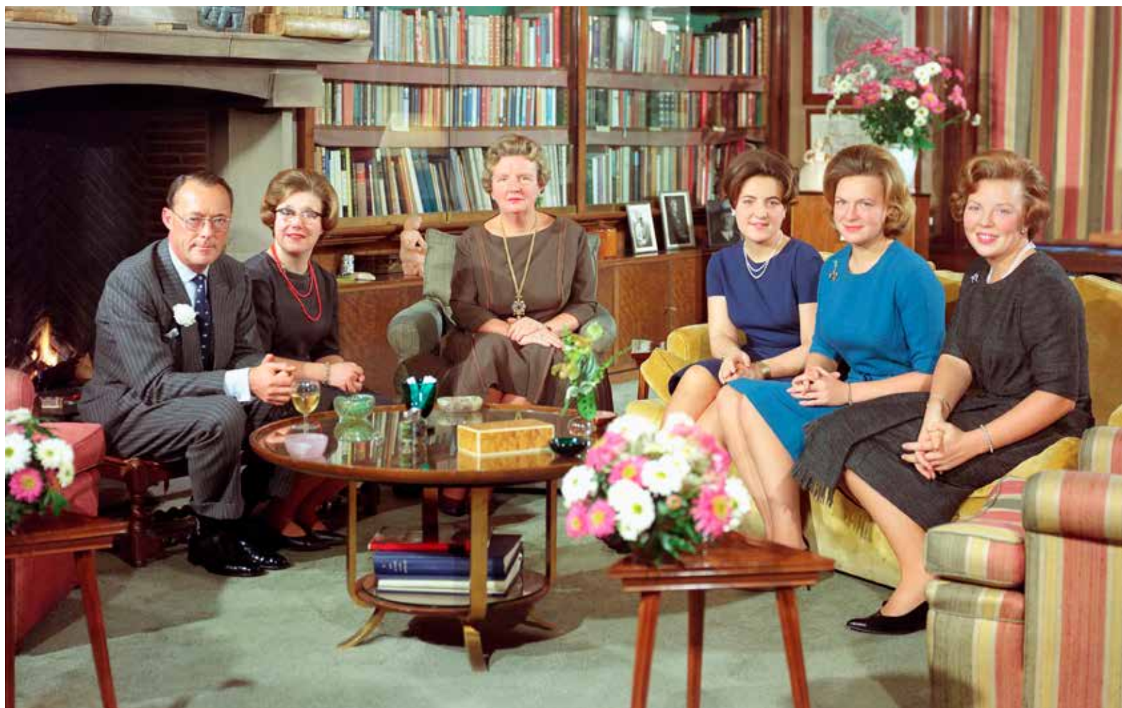
Het gezin in de bibliotheek van Paleis Soestdijk, 30 november 1963.