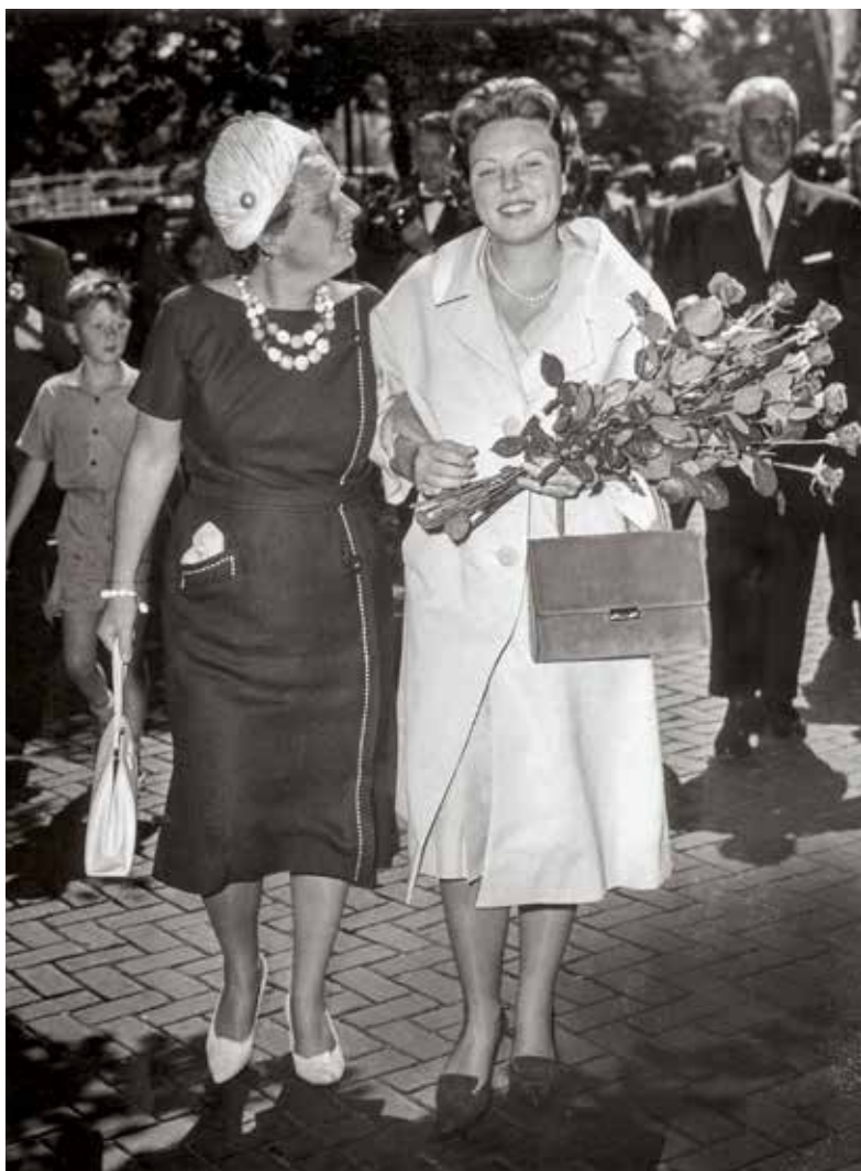
Net als haar moeder studeerde kroonprinses Beatrix in Leiden. Nadat Beatrix haar doctoraal examen in de vrije studie rechtsgeleerdheid heeft behaald gaan ze arm in arm, 7 juli 1961.