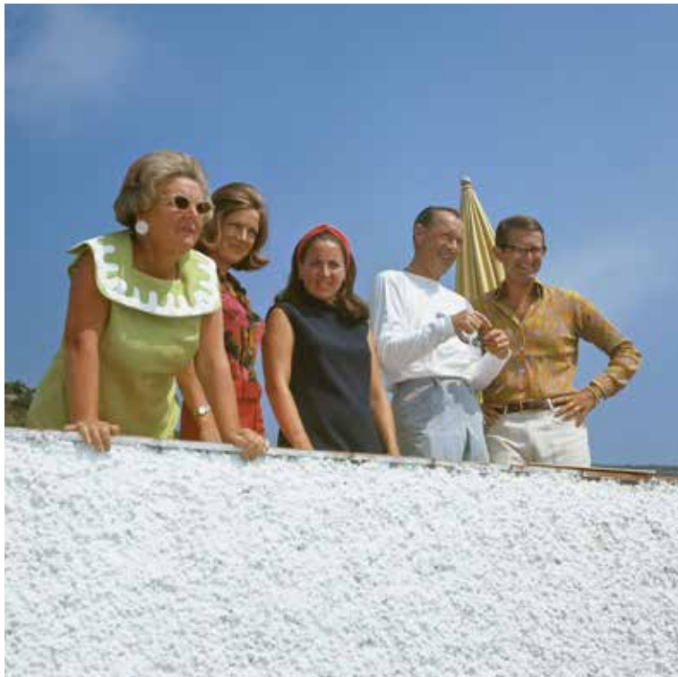
De koninklijke familie op vakantie in Porto Ercole, 25 juli 1969.