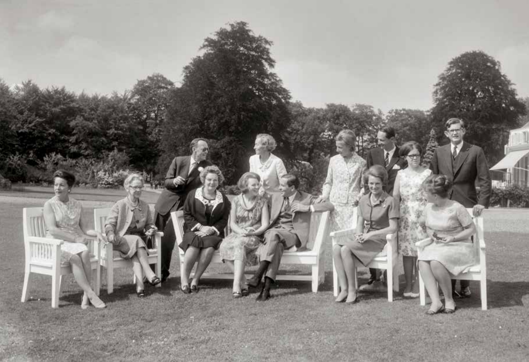
Vier dochters en drie schoonzonen. Juliana en Bernhard verwelkomen ze allemaal op Soestdijk, hier bij de verloving van Beatrix, paleistuin, juni 1965.