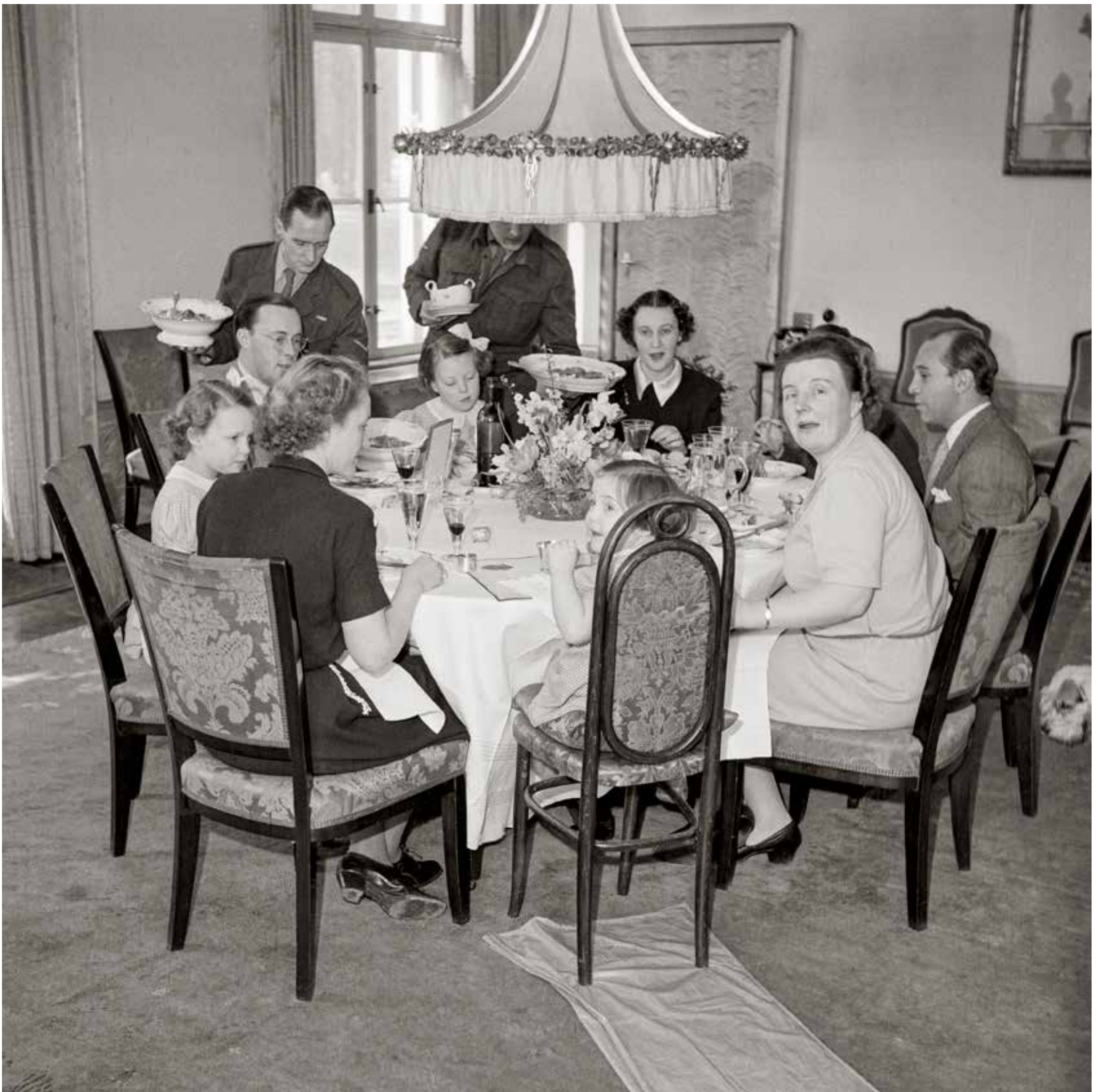
Het koninklijk gezin met naaste medewerkers aan tafel, Paleis Soestdijk, begin jaren vijftig.