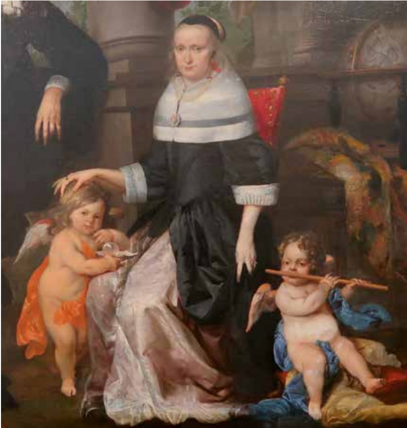
2.72 Onbekende Nederlandse schilder, omstreeks 1665, detail van 'Bildnis eines Amsterdamer Paars mit seinen verstorbenen Kindern' (Museum Schloss Gottorf, Schleswig)