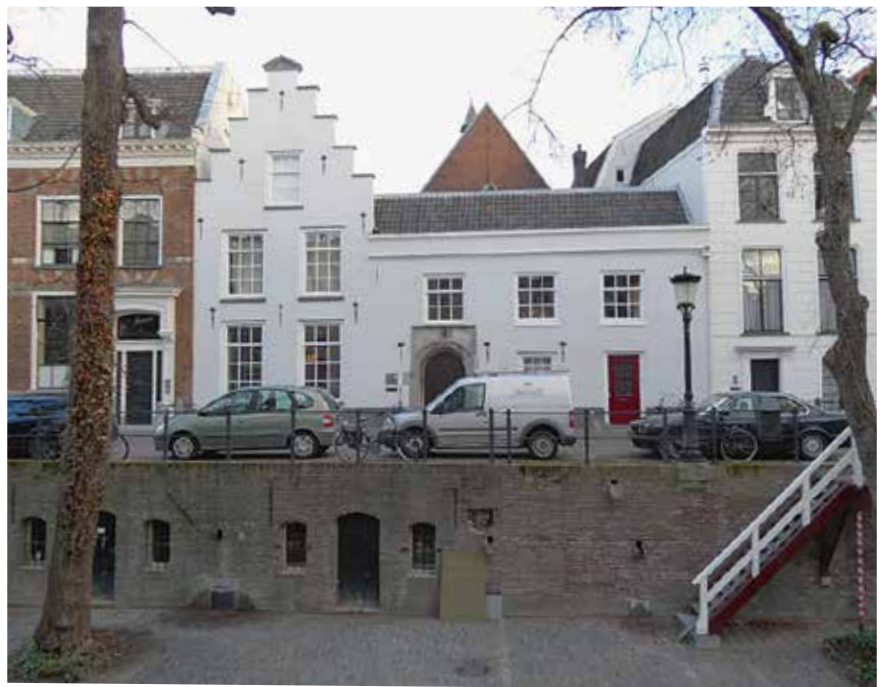
2.1 Utrecht, Nieuwegracht 20, ca. 1517-'20, thans wit geschilderde complex van Berend Uten Eng en Johanna Overdevecht. Diep huis met trapgevel en ondiepe vleugel met natuurstenen poort

Het complexe pand Nieuwegracht 20 staat op een groot perceel en bestaat uit een diep huis met trap-