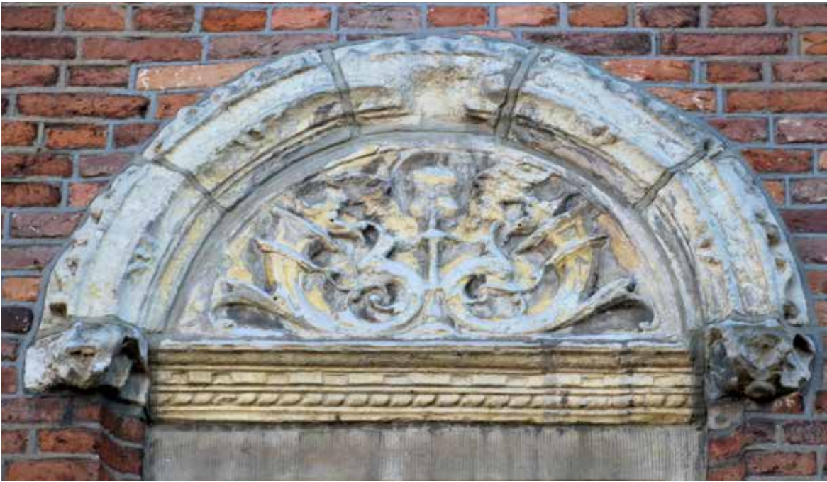
2.29 Zaltbommel, Maarten van Rossumhuis, voorgevel, boven linker kloostervenster 1ste verdieping, engel blaast op dubbele schalmei