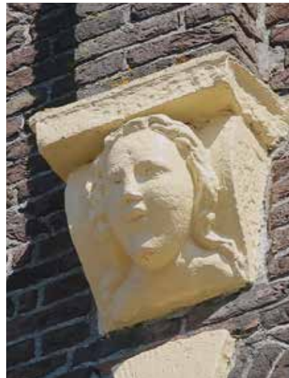
2.74 Hasselt, Heerengracht 1, vrouwenhoofd onder de bekronende pinakel van de voorgevel