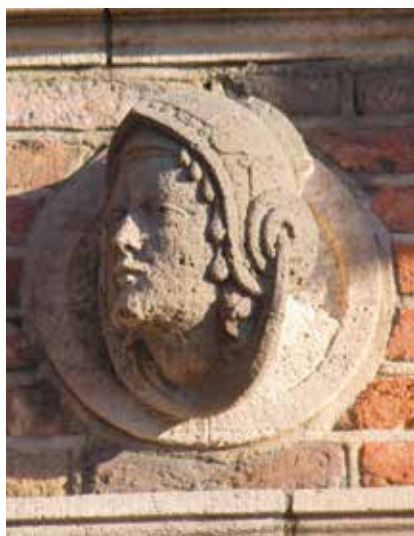
2.53 Arnhem, Duivelshuis, vrouwenhoofd (kopie), in fries boven venster uiterst rechts in de lange gevel boven de bel-etage