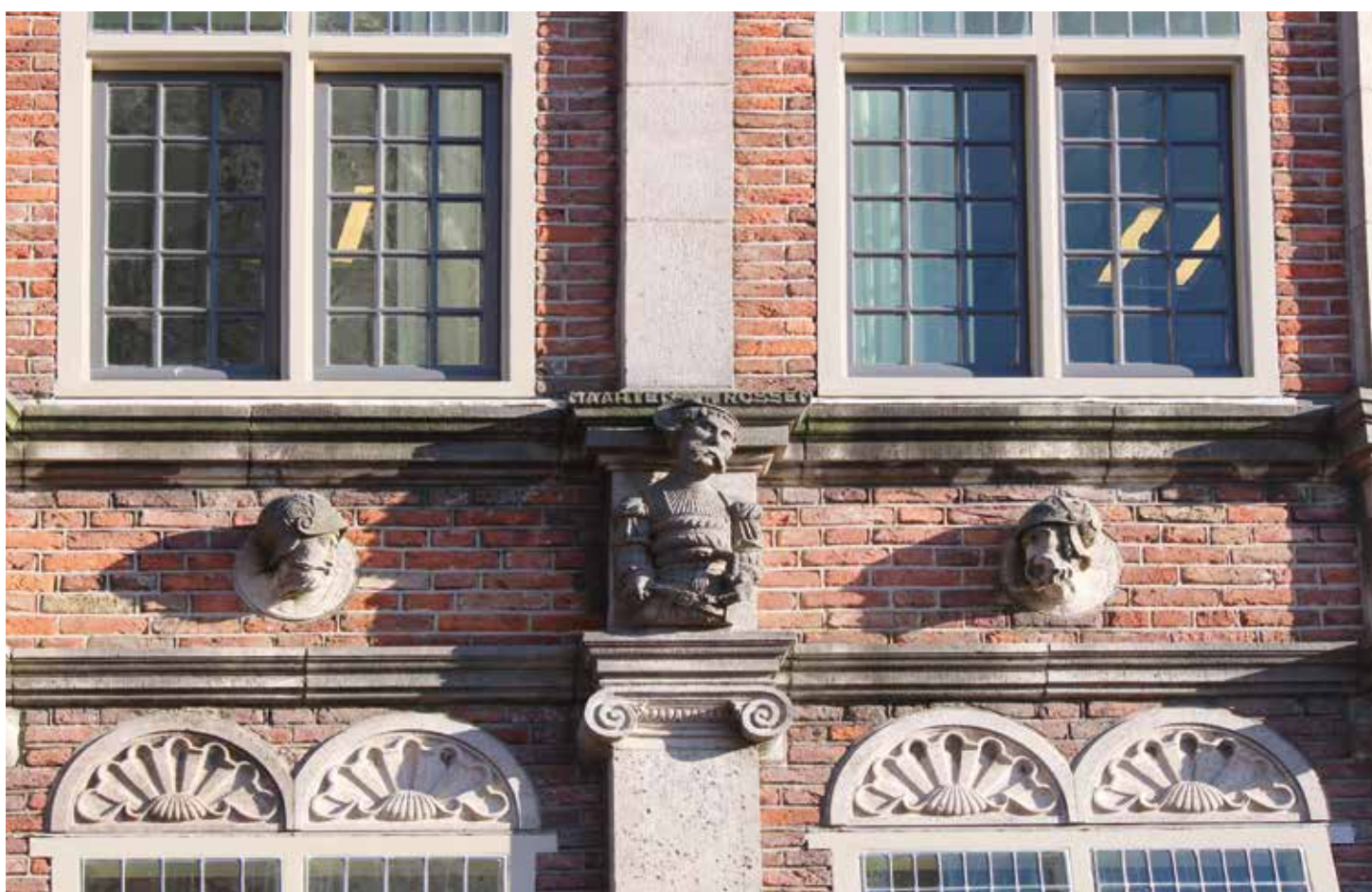
2.55 Arnhem, Duivelshuis, brede erker, fries boven bel-etage, in de twee traveeën brede middenzone bevindt zich centraal de voorstelling (kopie) van Maarten van Rossum vanaf zijn middel geflankeerd door twee gehelmde mannenhoofden die in Maartens richting blikken

zijn gericht. Sommige figuren dragen een klassieke helm, soms zijn ze blootshoofden en één draagt een koningskroon, geheel rechts op de vlakke gevel boven de bel-etage (afb. 2.52).