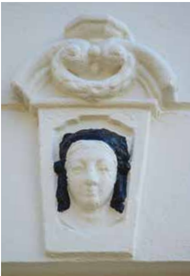
2.73 Amsterdam, Herenmarkt, hoek Brouwersgracht. Vrouwenhoofd boven de zijingang

Solitaire vrouwenhoofden op gevels komen niet veel voor. Zeker als ze zich direct boven een deur op de begane grond bevinden, zou men ze – analoog aan de situatie in Leiden – kunnen interpreteren als portretten van opdrachtgevers, mogelijk alleenstaande vrouwen of weduwen. Aan een dergelijke verklaring kan gedacht worden bij het vrouwenhoofd boven de zij-ingang aan de Herenmarkt, hoek Brouwersgracht 62 te Amsterdam (afb. 2.73). 84 Zonder een bekende context, zijn er solitaire hooggeplaatste vrouwenhoofden onder bekronende pinakels op de voorgevels: Donkere Spaarne 56 Haarlem, Verdrongen oord 65 Alkmaar en Heerengracht 1 Hasselt (afb. 2.74). 85 In tegenstelling tot de vrouwenhoofden boven de ingangen, kunnen deze hooggeplaatste exemplaren ook portretten van overleden personen voorstellen.