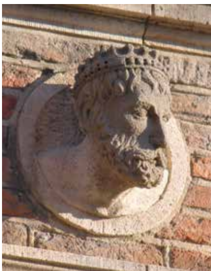
2.52 Arnhem, Duivelshuis, gekroond mannenhoofd (kopie), in fries boven venster rechts in de lange gevel boven de bel-etage

Pilasters verdelen de gevels aan de Koningstraat in een raster van traveeën en bouwlagen waarbij midden op de velden van de friezen boven de vensters steeds een medaillon met hoofd is aangebracht, thans alle kopieën. 63 Op de lange, vlakke gevel staan er twaalf, op de vier traveeën van de uitgeklapte erker eveneens twaalf omdat de gevel daar hoger doorloopt met een dakopbouw. Er is een onregelmatige afwisseling van mannen- en vrouwenhoofden aanwezig. Anders dan in Zaltbommel, zijn het niet altijd consequent paren die op elkaar