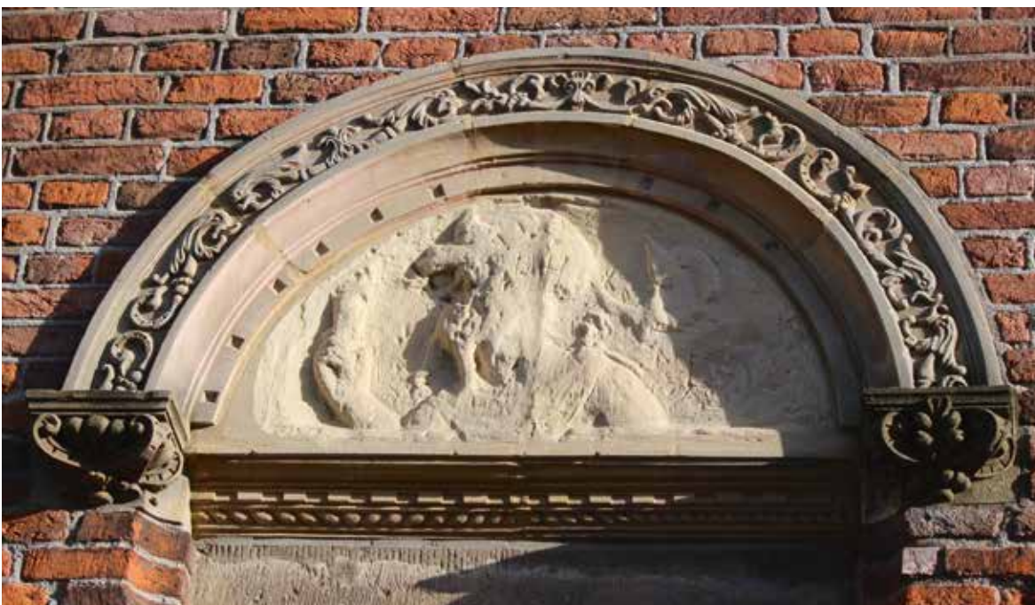
2.30 Zaltbommel, Maarten van Rossumhuis, mergelstenen bekroning van het kloostervenster in de westgevel op de begane grond

van de ouders van Maarten kunnen gaan, dan wel om het hertogelijk echtpaar Karel en Elisabeth. Ze zullen ongetwijfeld een representatieve plaats toebedeeld hebben gekregen op één van de gevels. Dit reliëf zou een optie kunnen zijn, ware het niet dat Karel doorgaans baardloos op schilderijen, munten en ook op zijn grafombe in de Arnhemse Eusebiuskerk afgebeeld wordt.