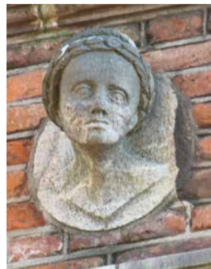
2.54 Arnhem, Duivelshuis, vrouwenhoofd (kopie), in het fries boven de linker flankerende zijde van de brede erker boven de bel-etage