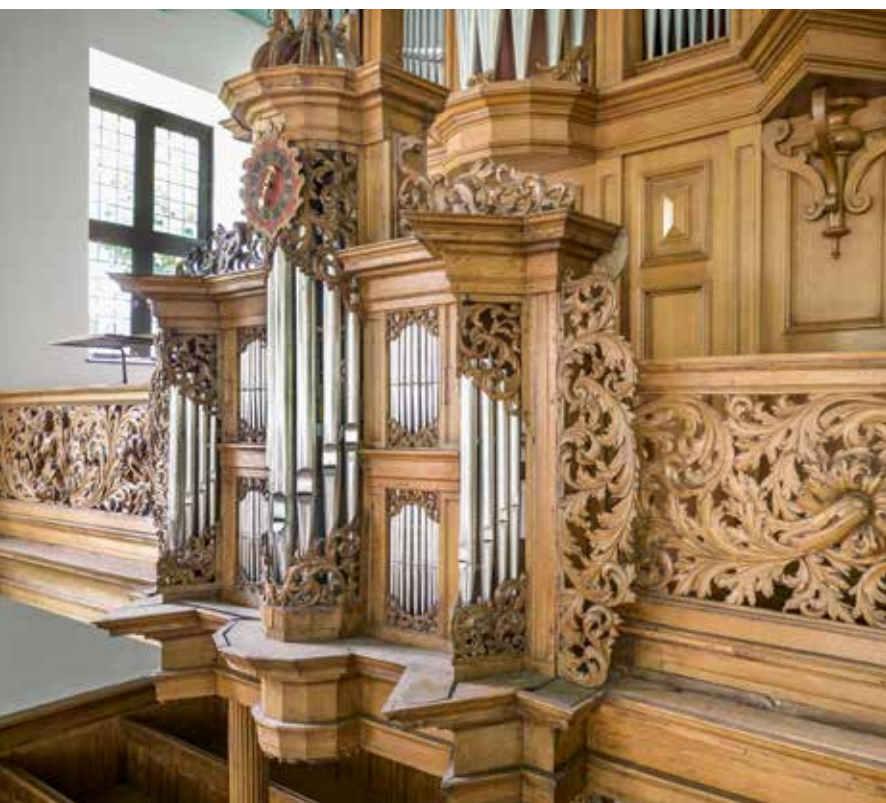
AM afb. 17

De borstwering van de orgelgalerij zou volgens bestek en tekening bestaan uit panelen en stijlen, maar op 9 september 1703 werden geplaatst an 2 zijden ijder een stuck lofwerck en ijder in een raam . Meijer vervaardigde het raam en zette daarin de door de beeldsnijder Jan de Rijk gesneden panelen met acanthusblad en figuren. Het orgel is in 1901 verhuisd naar de kerk van Mensingeweer. De orgelgalerij en het loze rugpositief zijn in Pieterburen gebleven. Bij de restauratie van 2009-2010 van de kas is deze van oude verflagen ontdaan en weer in de was gezet.