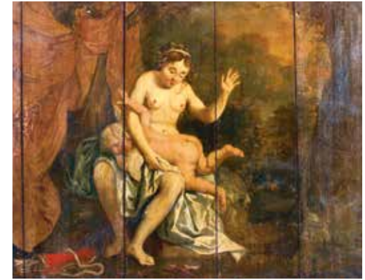
▲ Diana door Actaeon overrompeld (HC 1), uit de danszaal van Nienoord ◀ Plafondschildering (HC 201-211) van Hermannus Collenius afkomstig van Keizersgracht 412 te Amsterdam