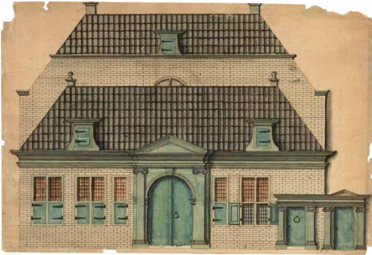
▲ Tekening van de Lutherse kerk te Groningen, vermoedelijk naar ontwerp van Allert Meijer

Inwendig rustte het dak aanvankelijk op vier zware houten kolommen, die later vervangen zijn door stenen zuilen. Tussen de muren en de kolommen bevindt zich aan drie zijden een gaanderij, waarop aan één zijde het nieuwe orgel een plaats vond. De drie gaanderijen worden aan de voorzijde afgesloten door een balustrade met balusters. Op de stijlen tussen de balusters zijn gesneden festoenen aangebracht. Aan de vierde zijde van de kerk is aan de wand de preekstoel gesitueerd, binnen een nu verdwenen dooptuin, de door een balustrade afgesloten ruimte waarbinnen zich preekstoel, lezenaar,