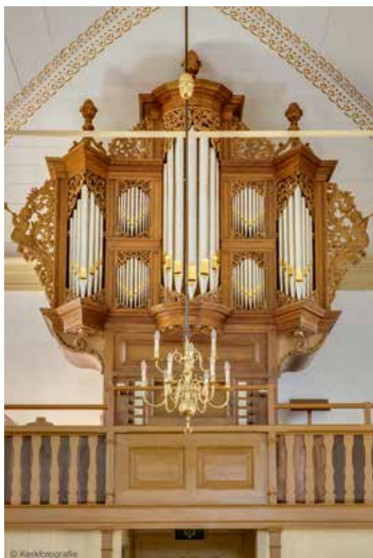
AM afb. 15