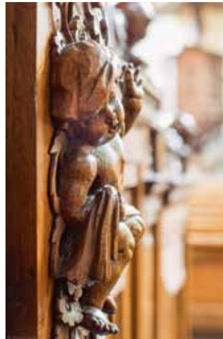
JdR 10 Details uit het timpaan