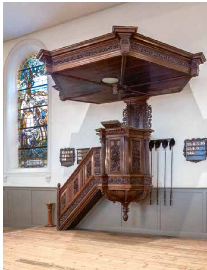
▲ Preekstoel in de Lutherse kerk te Groningen