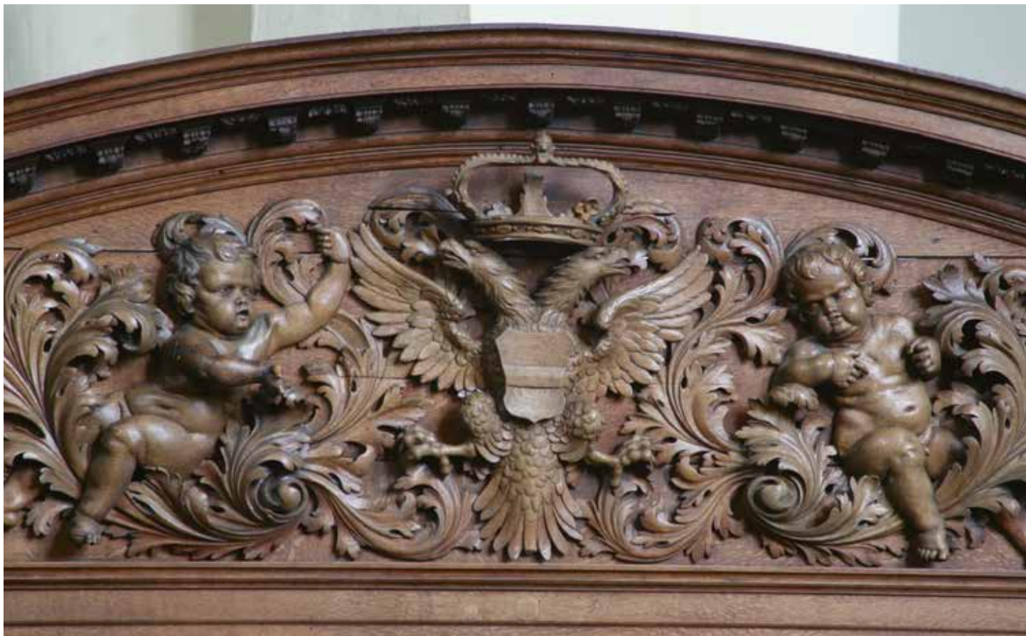
JdR 10 Timpaan met stadswapen