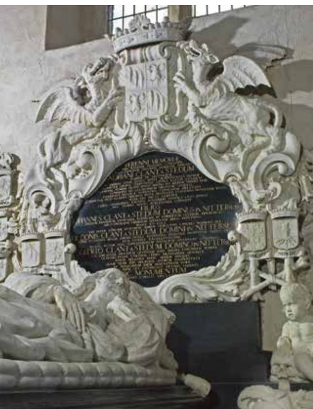
▲ De achterwand van het grafmonument