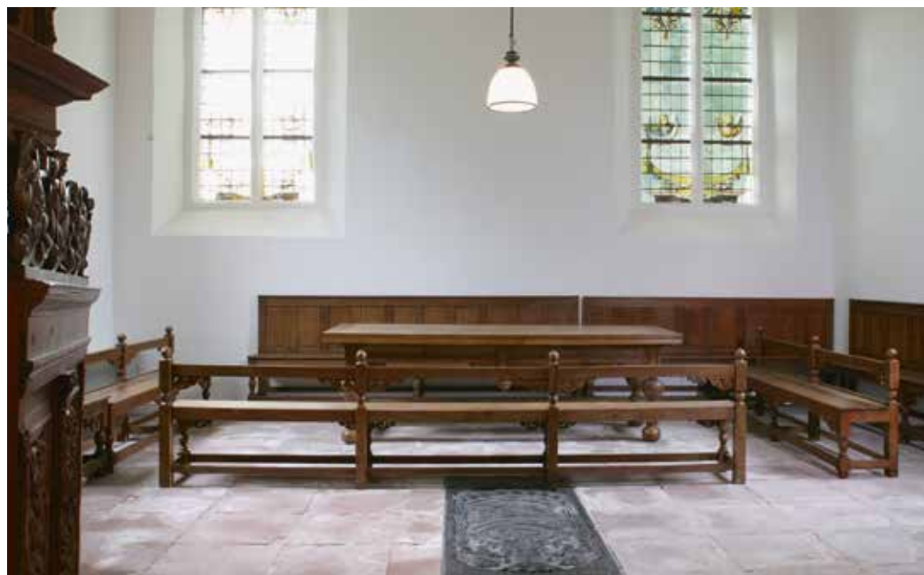
▲ Avondmaalsopstelling in het koor van de kerk van Noordwolde

Niet alleen de opdrachtgevers, maar ook de kunstenaars zelf waren breed georiënteerd. Ze kwamen soms van elders of hadden elders hun opleiding genoten, en ook zij maakten bij gelegenheid verre reizen. Tot hun culturele bagage behoorde kennis van de klassieke verhalen en om van de laatste mode op de hoogte te zijn bestudeerden ze