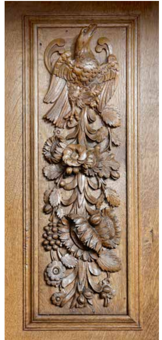
JdR 10 Detail van het rugschot