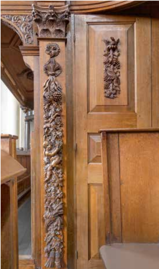
JdR 10 Zijkant raadsgestoelte