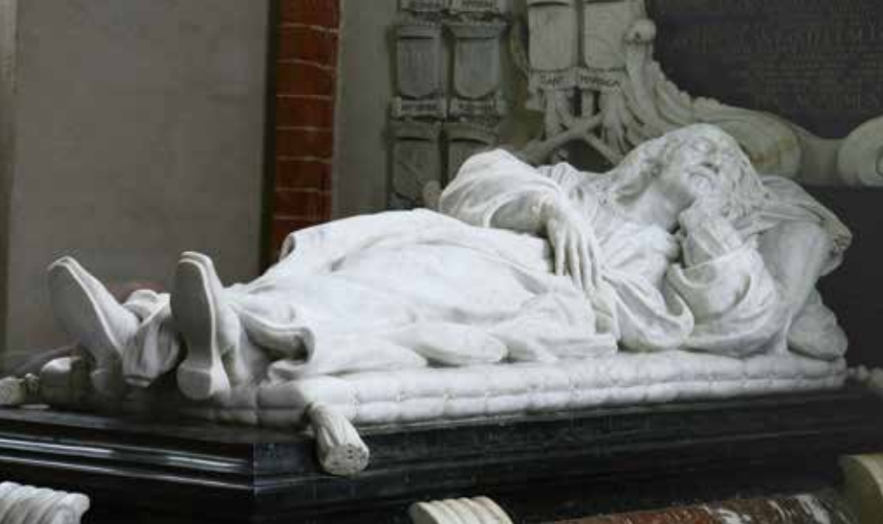
▲ Adriaan Clant in slapende houding, liggend op een gecapitonneerde matras