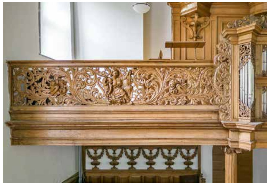
AM afb. 19

De borstwering van de orgelgalerij zou volgens bestek en tekening bestaan uit panelen en stijlen, maar op 9 september 1703 werden geplaatst an 2 zijden ijder een stuck lofwerck en ijder in een raam . Meijer vervaardigde het raam en zette daarin de door de beeldsnijder Jan de Rijk gesneden panelen met acanthusblad en figuren. Het orgel is in 1901 verhuisd naar de kerk van Mensingeweer. De orgelgalerij en het loze rugpositief zijn in Pieterburen gebleven. Bij de restauratie van 2009-2010 van de kas is deze van oude verflagen ontdaan en weer in de was gezet.