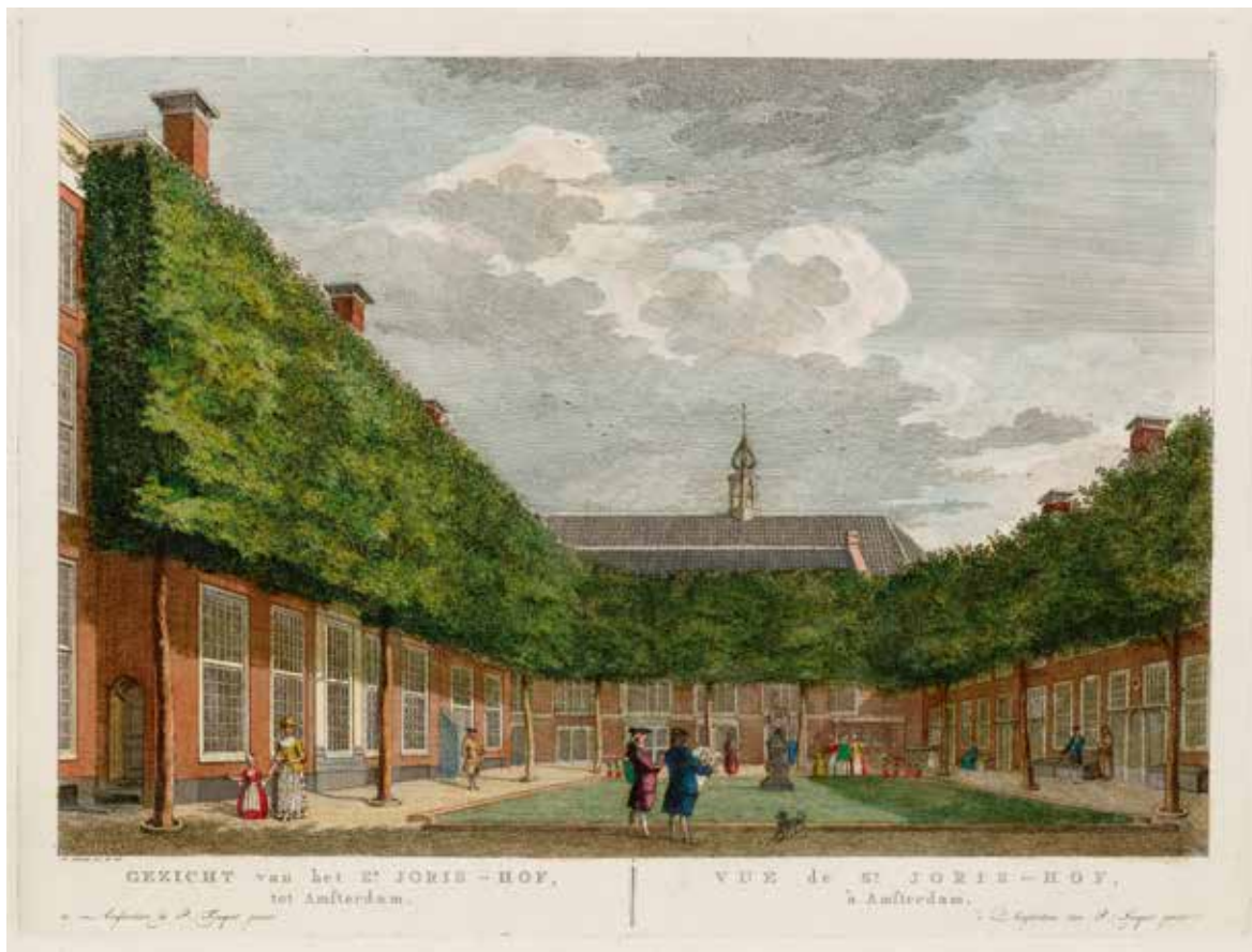
< Reinier Vinkeles , Gevelaanzicht van het Trippenhuys , 1803, Stadsarchief Amsterdam: collectie Atlas Splitgerber