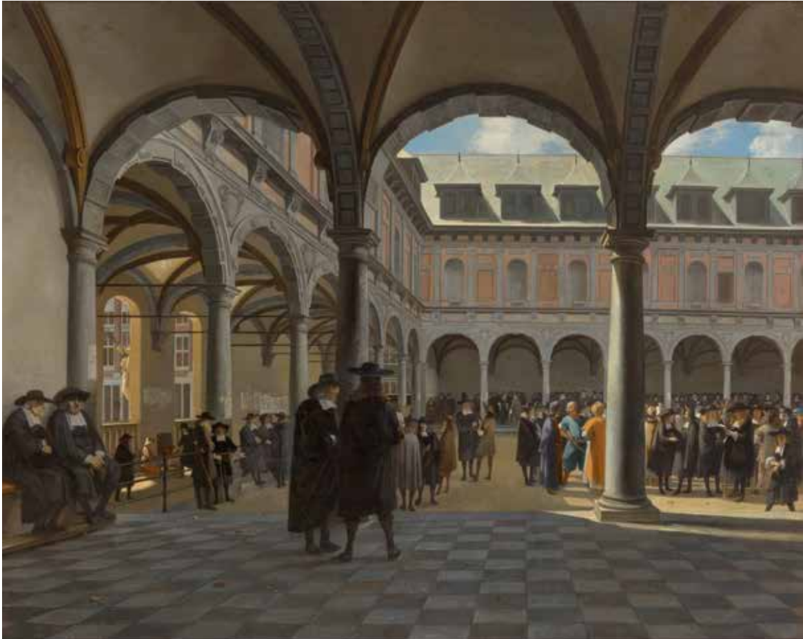
Job Berckheyde , De Oude Beurs te Amsterdam , ca. 1670, olieverf op doek, 85 x 105,5 cm, Museum Boijmans van Beuningen Rotterdam

Job en Gerrit Berckheyde waren broers. Vanaf 1660 schilderden ze vooral stadsgezichten, met een voorkeur voor Amsterdam en Haarlem. Job was lid van het Sint-Lucasgilde in Amsterdam, Gerrit van het gilde in Haarlem. Van Gerrit Berckheyde is bekend dat hij Johannes Lingelbach inhuurde om de figuren te schilderen.