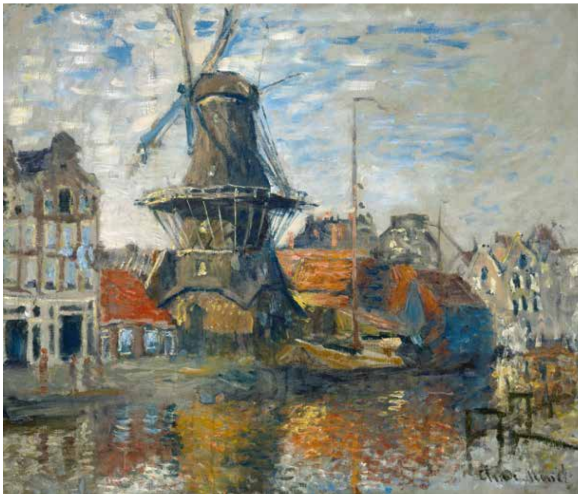
Claude Monet , Windmolen aan de Onbekende Gracht , 1874, olieverf op doek, 54 x 64,1 cm, Museum of Fine Arts, Houston. Geschenk van Audrey Jones Beck