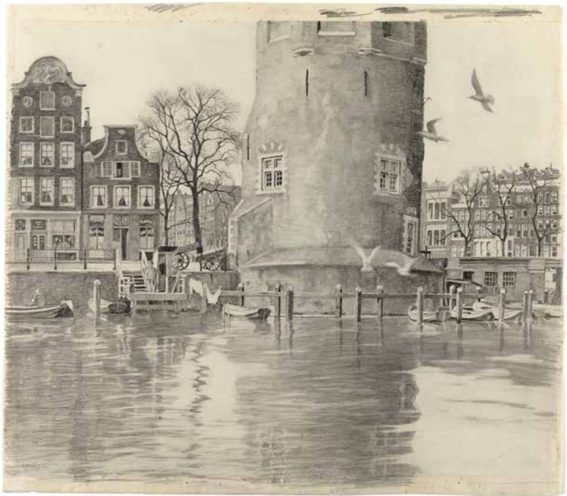
Willem Witsen , De voet van de Montelbaanstoren , 1870-1923, potlood op papier, 510 x 58, mm, Rijksprentenkabinet Amsterdam, bruikleen van het Willem Witsenhuis