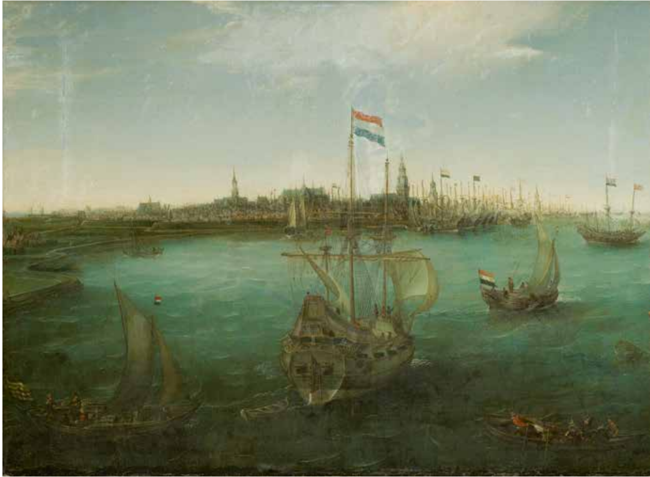
Hendrik Cornelisz. Vroom , Het IJ vanuit het oosten – zicht op de Tweede Stadsuitleg , 1591-1612, olieverf op doek, 81 x 218 cm, Amsterdam Museum