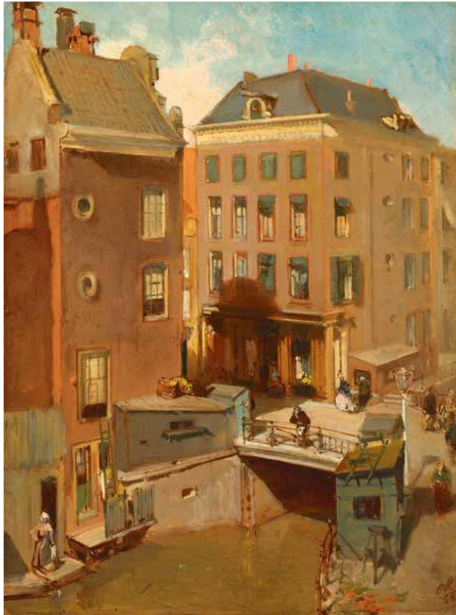
Charles Rochussen, De Osjessluis bij de Kalverstraat te Amsterdam, 1855, olieverf op paneel, 32 x 23,5 cm, Rijksmuseum Amsterdam