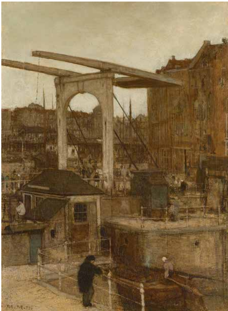
< Matthijs Maris, De Nieuwe Haarlemse Sluis bij het Singel, bekend als 'Souvenir d'Amsterdam', 1871, olieverf op doek, 46,5 x 35 cm, Rijksmuseum Amsterdam