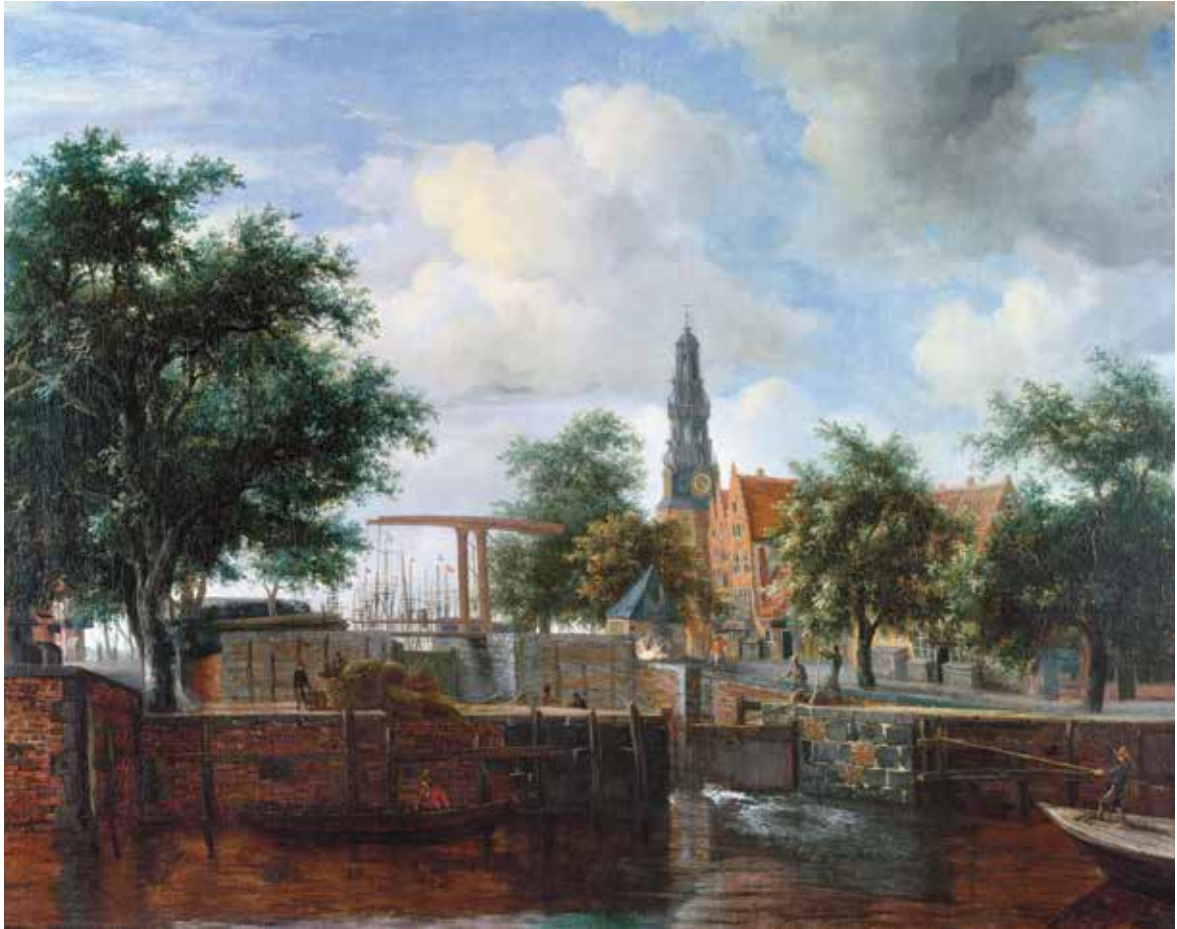
Meindert Hobbema (met Johannes Lingelbach?), Haarlemmersluis in Amsterdam , 1663-1665, olieverf op doek, 78,3 x 100,8 cm, National Gallery Londen