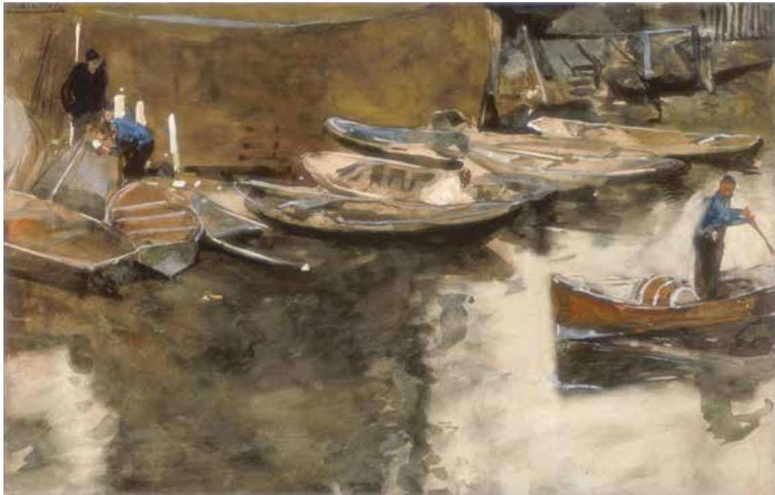
George Hendrik Breitner , Schuitjes bij de Montelbaanstoren , 1887, aquarel op papier, Stedelijk Museum Amsterdam

Breitner ontkende zijn gebruik van fotografie voor zijn schilderkunst desgevraagd niet: 'ik gebruik wel degelijk photos. Het is niet mogelijk dergelijke dingen te maken zonder hulp van photos. Hoe wil je dat ik een Amsterdamsche straat maak. Ik maak krabbeltjes in mijn schetsboek. Als het kan een studie uit een raam en een schets voor de details maar de keus voor de compositie is toch van mij.' *