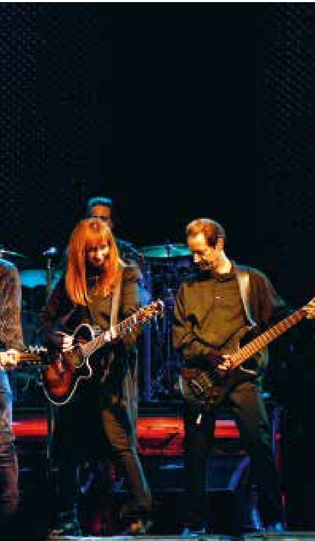
Nils Lofgren, Clarence Clemons, Bruce Springsteen, Steve Van Zandt, Max Weinberg, Patti Scialfa en Garry Tallent in het Shea Stadium op 4 oktober 2003, het laatste concert van The Rising Tour.