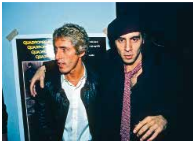
Steve Van Zandt (rechts) was samen met Springsteen en Landau coproducer van The River . Hier met Roger Daltrey, leadzanger van The Who.

Springsteen wilde dat de hoes van zijn vijfde album sober en serieus was. Je ziet hem in close-up, terwijl hij in de camera kijkt, ongeschoren en met een houthakkersoverhemd aan. Dit is ongetwijfeld om aan te geven, nog voordat je de eerste plaat op de draaitafel legt, dat dit een dubbelalbum is uit Amerikaans plattelandsgebied met kleine plaatsjes, een album dat is opgenomen door blauweboordenmuzikanten. De naam van de artiest en de albumtitel staan in blauw op een zwarte achtergrond.