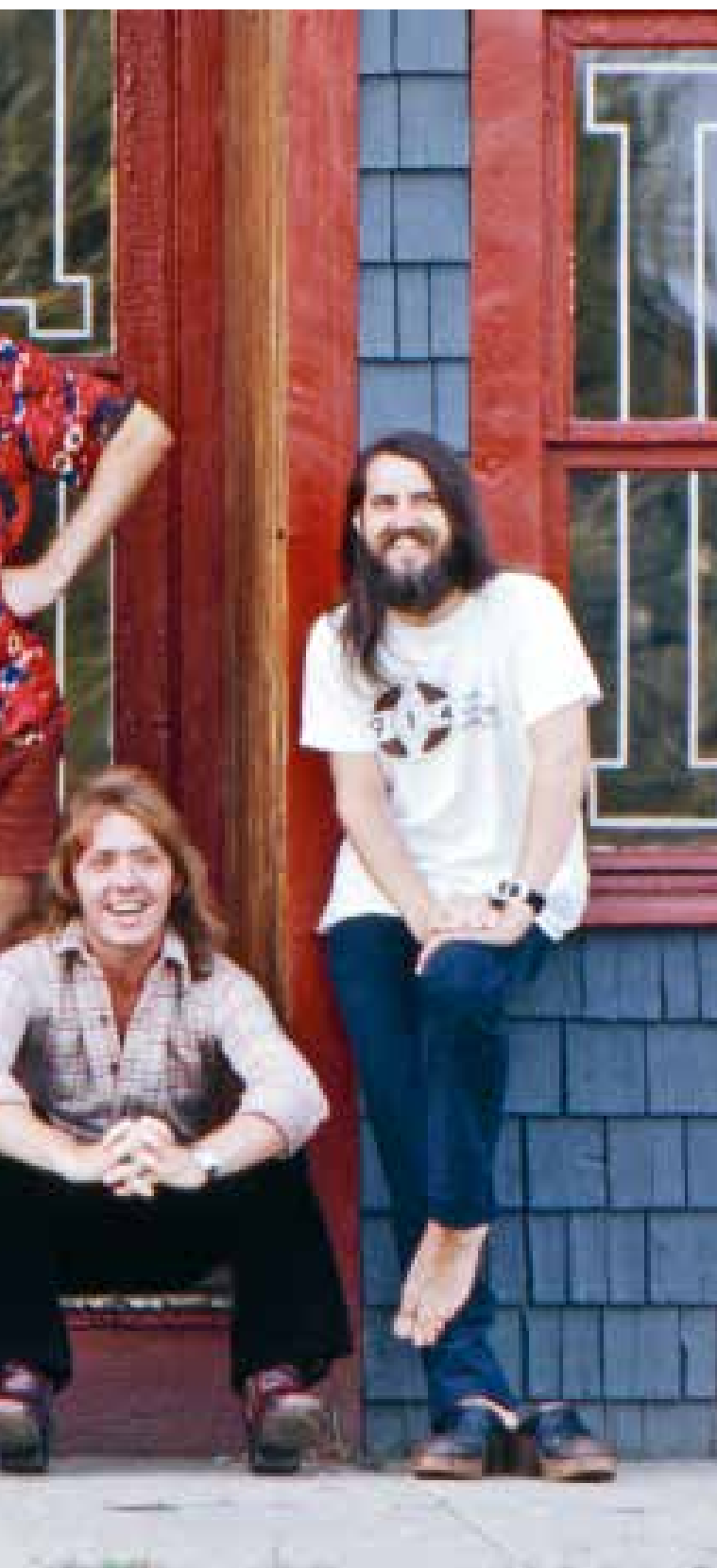
Van links naar rechts: Clarence Clemons, Bruce Springsteen, Danny Sancious, Vini Lopez, Danny Federici en Garry Tallent.