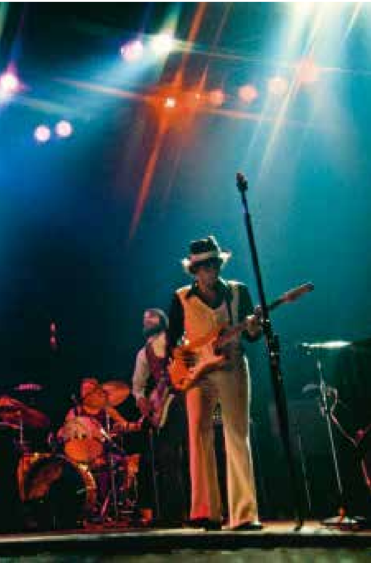
Clarence Clemons, Danny Federici, Bruce Springsteen, Max Weinberg, Garry Tallent en Steve Van Zandt bij de Born to Run Tour, die in november 1975 Londen aanded.