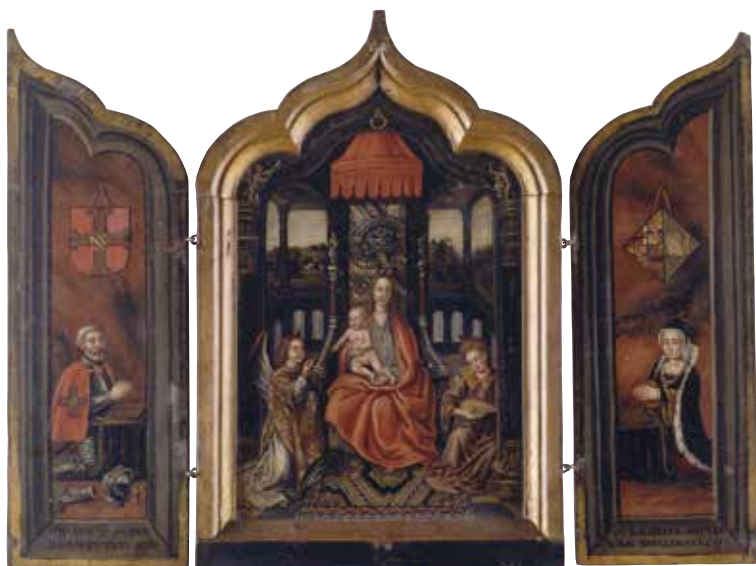
Huisaltaartje met voorouders van Johan van Oldenbarnevelt, dat volgens een tekst op de achterzijde zou dateren van vóór 1443. Het is echter in de vroege zeventiende eeuw gemaakt om een illustre voorgeslacht te bewijzen.