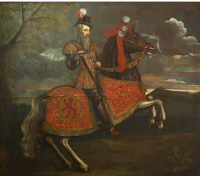
Ruiterportret van Reinoud III van Brederode (1492-1556), met om zijn hals de keten van het Gulden Vlies. Olieverf op doek door Cornelis Antonisz, ca. 1550.

teken van erkenning. Het bracht hen aan één tafel met regerende vorsten en grensde hen af van de riddermatige geslachten die in de gewesten het Tweede Lid van de Statenvergaderingen bemanden. Reeds in de Bourgondische periode was de scheiding tussen hoge en lage adel duidelijk geworden, maar naar beneden toe was de afgrenzing toen nog niet zo scherp. Er was geen helder criterium voor het lidmaatschap van de Ridderschap, zeker niet in het Nedersticht. Onder Karel V veranderde dat.