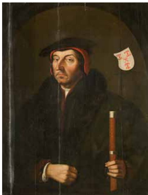
Willem van Zuylen van Nijevelt (?-1543), burgemeester van Utrecht en psalmberijmer. Olieverf op paneel, anoniem, zeventiende eeuw.

Hervormingsgezinden als Van Zuylen van Nijevelt, Brederode en de Egmonds bleven binnen de katholieke kerk, de wederdopers stonden buiten alle kaders en het lutheranisme kreeg in de Nederlanden betrekkelijk weinig aanhang. Uiteindelijk was het calvinisme de meest succesvolle variant. De volgelingen van Calvijn noemden zich gereformeerden. Zij waren door hun theologische inzichten en hun organisatiestructuur goed toegerust. Calvijn