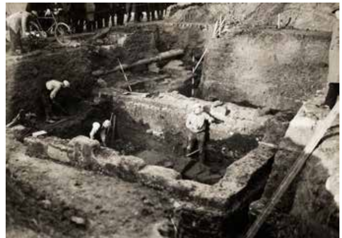
De opgravingen op het Domplein te Utrecht met de resten van de Heilige Kruiskapel, 1929.

Voor Willibrord/Clemens was Utrecht geen permanente zetel, maar een missiepost. Hij stichtte daar twee kerkjes, een aan de Verlosser gewijd, de St. Salvator, en een aan St. Maarten, de patroonheilige van de Franken, waarmee hij zijn loyaliteit aan zijn beschermheer demonstreerde. Bij