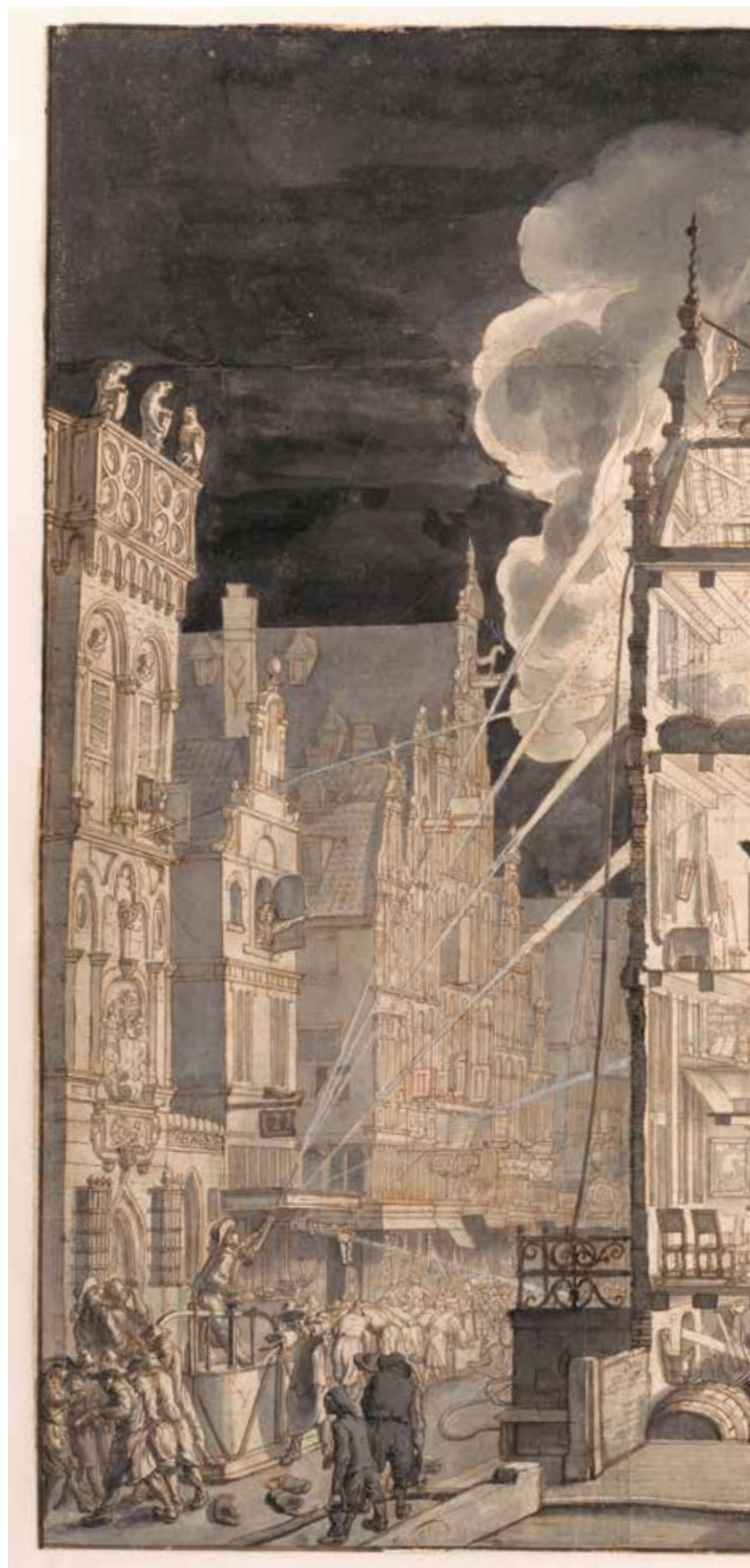
12 Jan van der Heyden, Dwarsdoorsnede van een brandend huis met de oude brandspuiten en nieuwe slangbrandspuiten in de praktijk , ca. 1690 Zwart krijt, pen in bruin, penseel in grijs, doorgegriffeld, 340 x 461 mm, Stadsarchief Amsterdam, afb.nr. JVDH00007000001