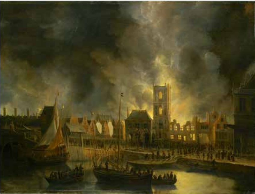
5 Jan Abrahamsz. Beerstraten, Brand in het Oude Stadhuis op de Dam op 7 juli 1652 Olieverf op paneel, 89 x 121,8 cm, Amsterdam Museum, inv.nr. SA 40246

verschenen de geelgieter (kopergieter) Gillis Wijbrants en de smid Claas Starck voor de notaris. Hierin beloofde Gillis Wijbrants te ‘maecken ende leveren van alle het ijserwerck noodich weesende tot een brandtspuijt’. In de akte werd verder bepaald aan welke kwaliteitseisen het werk moest voldoen: namelijk ‘soo swaer en soodanich’ zijn als het ijserwerck aende brandtspuijt vande Luijtersche kerck alhier is gemaect’, een verwijzing naar de brandspuit van 1654. 17