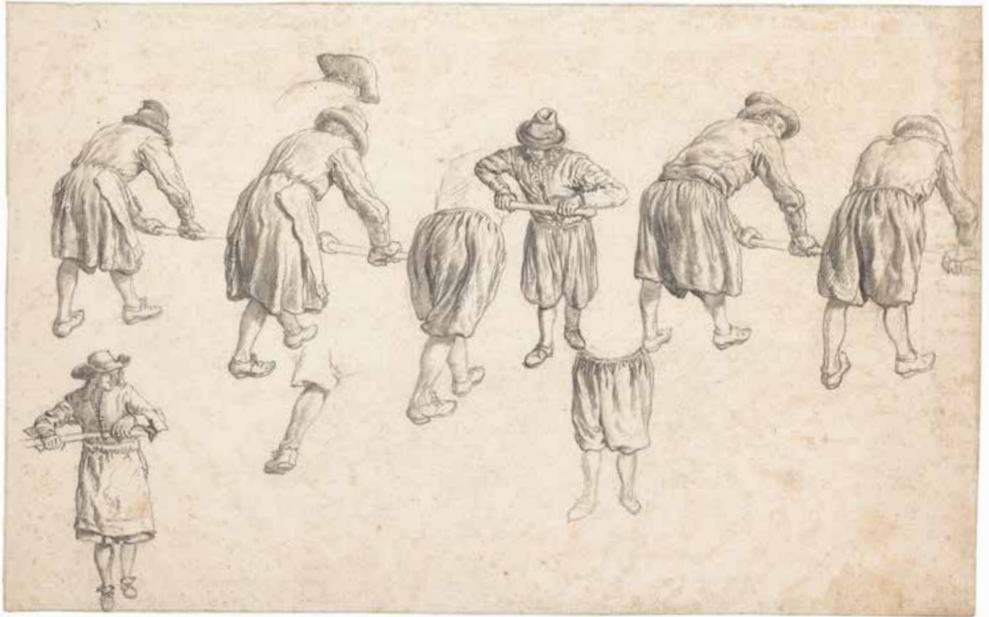
Jan van der Heyden, Studies van brandweermannen werkend aan de slangbrandspuit , ca. 1680-1699 Potlood, 191 × 305 mm, Rijksmuseum Amsterdam, inv.nr. RP-T-00-157