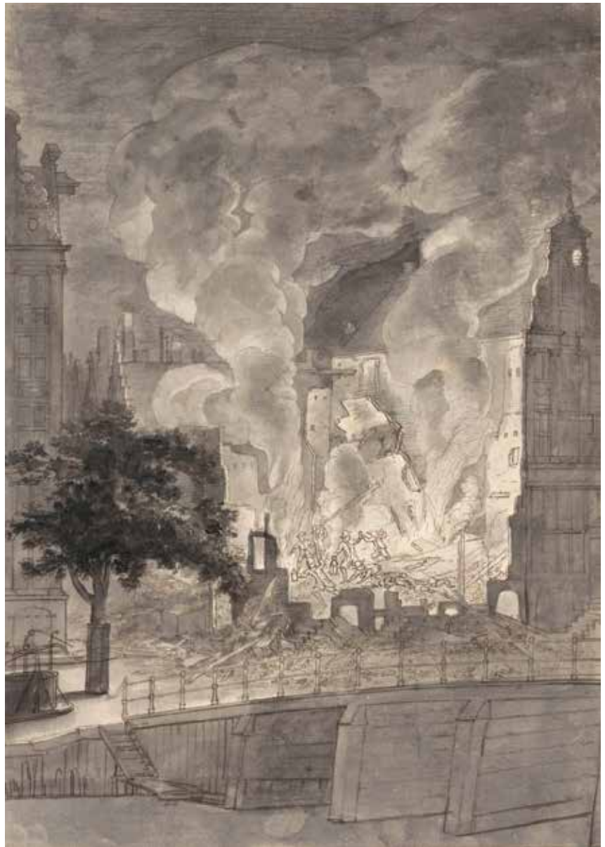
4.4 Buren inspecteren de smeulende resten van zes verbrande huizen op het Waalseiland enkele dagen na de brand van 25 oktober 1670 Potlood, zwart krijt, pen in bruin, penseel in grijs, doorgegriffeld, 321 x 230 mm, Stadsarchief Amsterdam, afb.nr. JVDH00014000001