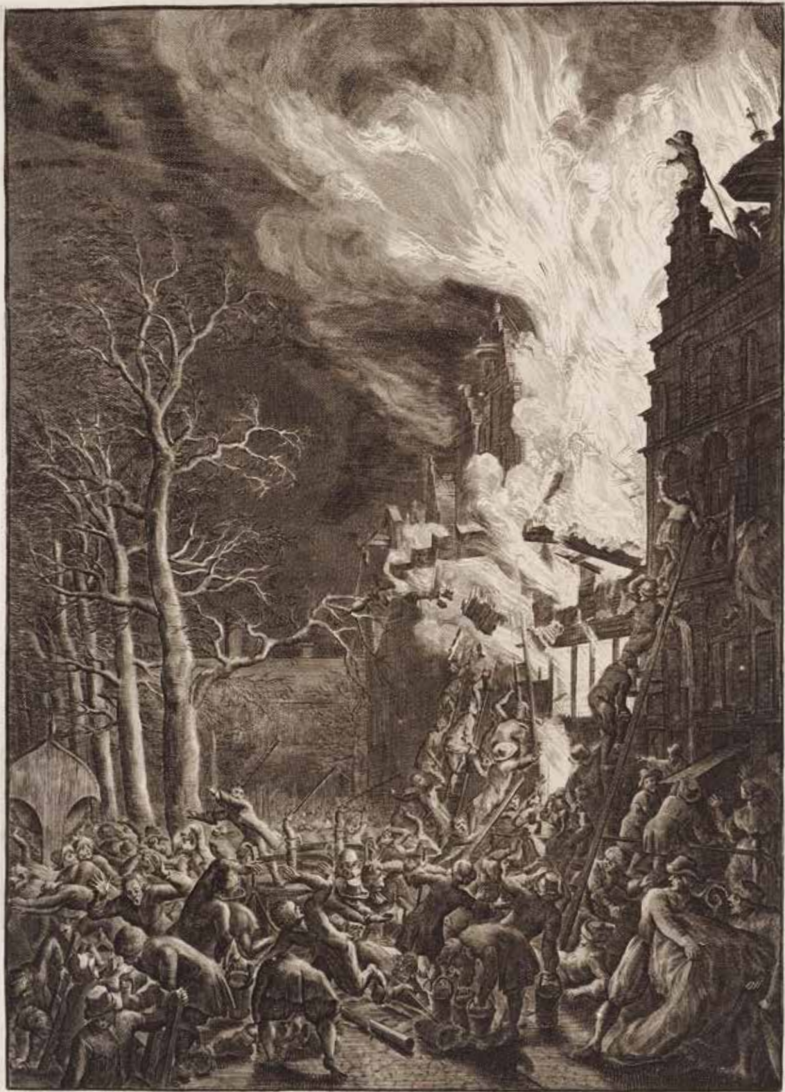
Abbildung van Brande ontstaan den 5 December 1658. op d'Onse Sobans; verheccende het noordsteden ronde Gevel. op de Oude Sinten en. Menzen die daar aan arbejden, waer van ve verschey de swaar oignest, en vier of vyf geheel verpletterde werden.