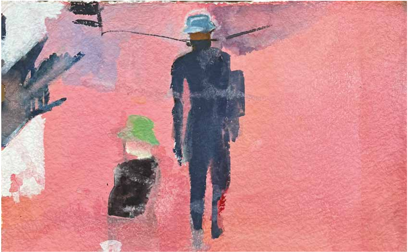
The Pink Hour 2021 Watercolor on handmade paper / Aquarel op handgeschept papier 13.1 x 20.2 in. (33.5 x 51.5 cm)