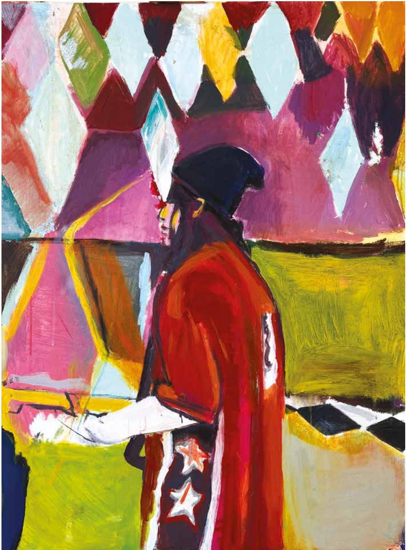
The Guitar Player 2021 Acrylic on canvas / Acryl op doek 51 x 35.4 in. (130 x 90 cm)