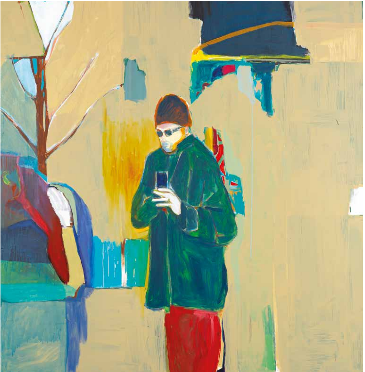
Five Leafs 2021 Acrylic on canvas / Acryl op doek 94.4 x 84.2 in. (240 x 214 cm)

Previous page / vorige pagina: Leaving Greenpoint 2022 Acrylic on canvas / Acryl op doek 98.4 x 118.11 in. (250 x 300 cm)