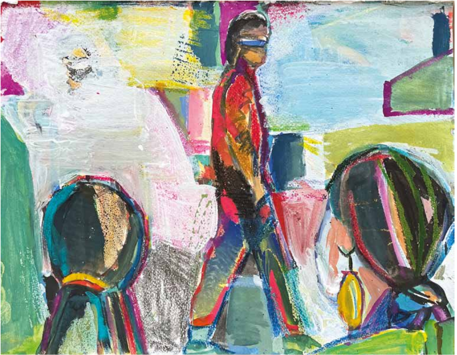
Rick at Palais de Tokyo 2021 Watercolor and crayon on paper / Aquarel en krijt op papier 10.8 x 13.9 in. (27.5 x 35.5 cm)