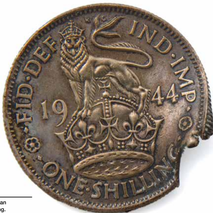
Shillingmunt van Harold Schilling.

Daarnaast wil ik de medewerkers van de Association of Jewish Ex-Servicemen (AJEX), de British National Archives, de Wiener Holocaust Library, het Archiv der Israelitischen Kultusgemeinde Wien, het Österreichisches Staatsarchiv, Yad Vashem, Ghetto Fighter House Archives, het Jewish Museum London, en het United States Holocaust Memorial Museum bedanken.