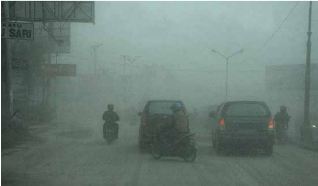
◀ Asregen in Yogyakarta na de laatste grote uitbarsting van de Merapi in 2010.