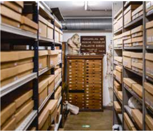
▲ Fossielen uit Indonesië, onderdeel van de collectie Eugène Dubois.

gevonden fossielen die later Javamens zouden gaan heten. Ook had Dubois nooit zonder de aanwezige lokale kennis de vondst kunnen doen. De aanwezigheid van fossielen in het stroomgebied van de rivier de Solo, in de regio rondom Trinil, was al sinds mensenheugenis bekend, omdat inwoners beenderen in de grond vonden die zij beschouwden als botten van reuzen: ‘Balung buto’ of ‘Tulang raksasa’.