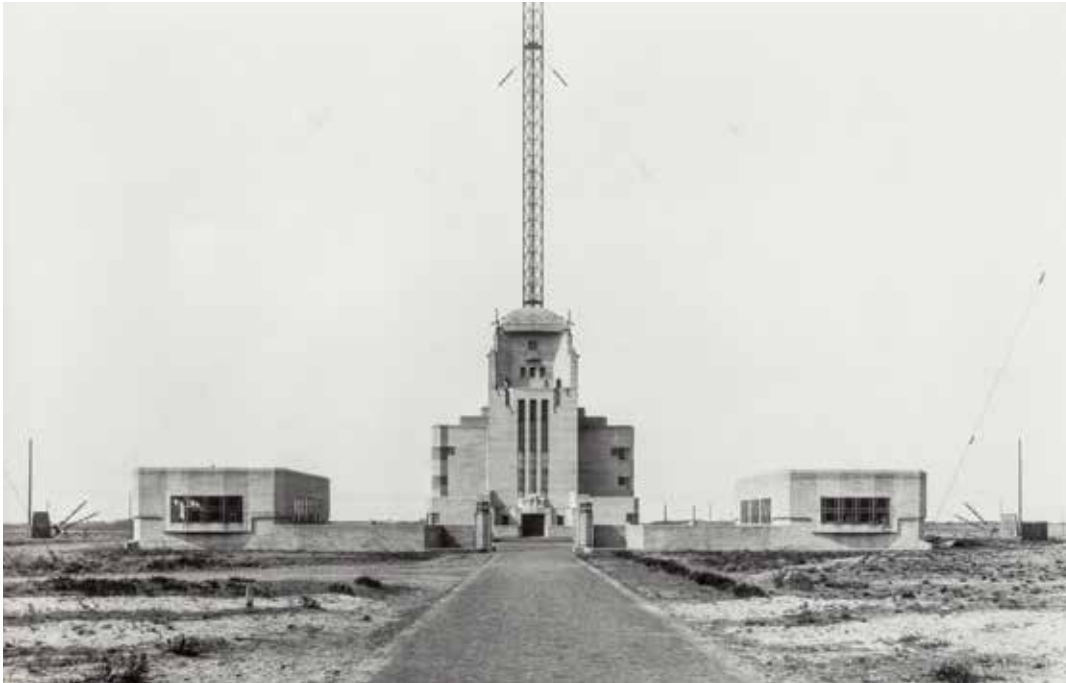
◀ Radio Kootwijk, gefotografeerd in de jaren twintig.