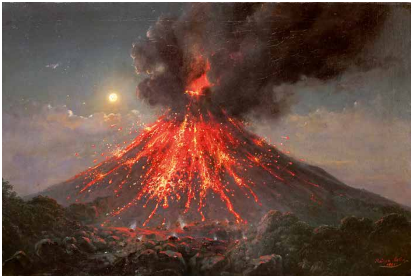
► Raden Saleh, Uitbarsting van de Merapi, 1865. Olieverf op doek, 60x73 cm. Collectie Naturalis Biodiversity Center

Drie enorme vulkaanuitbarstingen in Indonesië hebben wereldgeschiedenis geschreven. Naar schatting 74.000 jaar geleden heeft een enorme uitbarsting plaatsgevonden in Noord-Sumatra met als gevolg de vorming van het Tobameer, het grootste kratermeer ter wereld. De eruptie zou zulke grote klimaatveranderingen teweeg hebben gebracht dat de mens op het randje van uitsterven kwam.