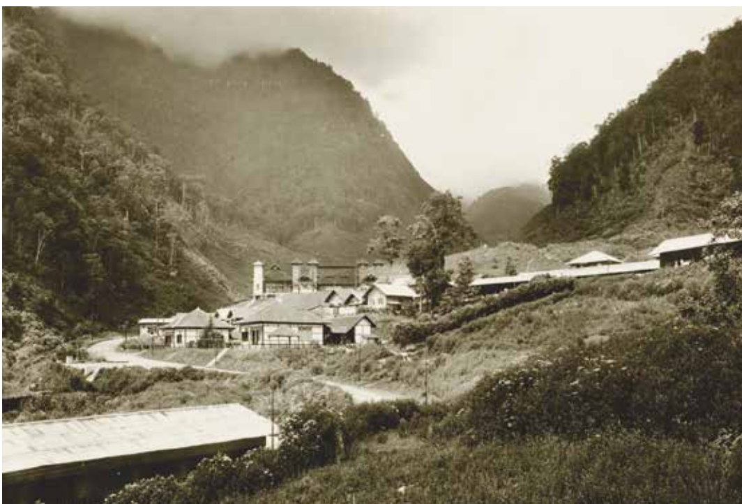
◀ Het radiostation te Malabar, 1924. Collectie KITLV

Als marketingstunt gaf de PTT een boekje uit met reportages over deze experimenten onder de titel: Hallo Bandoeng! Hier Den Haag! Uit een van de reportages blijkt dat