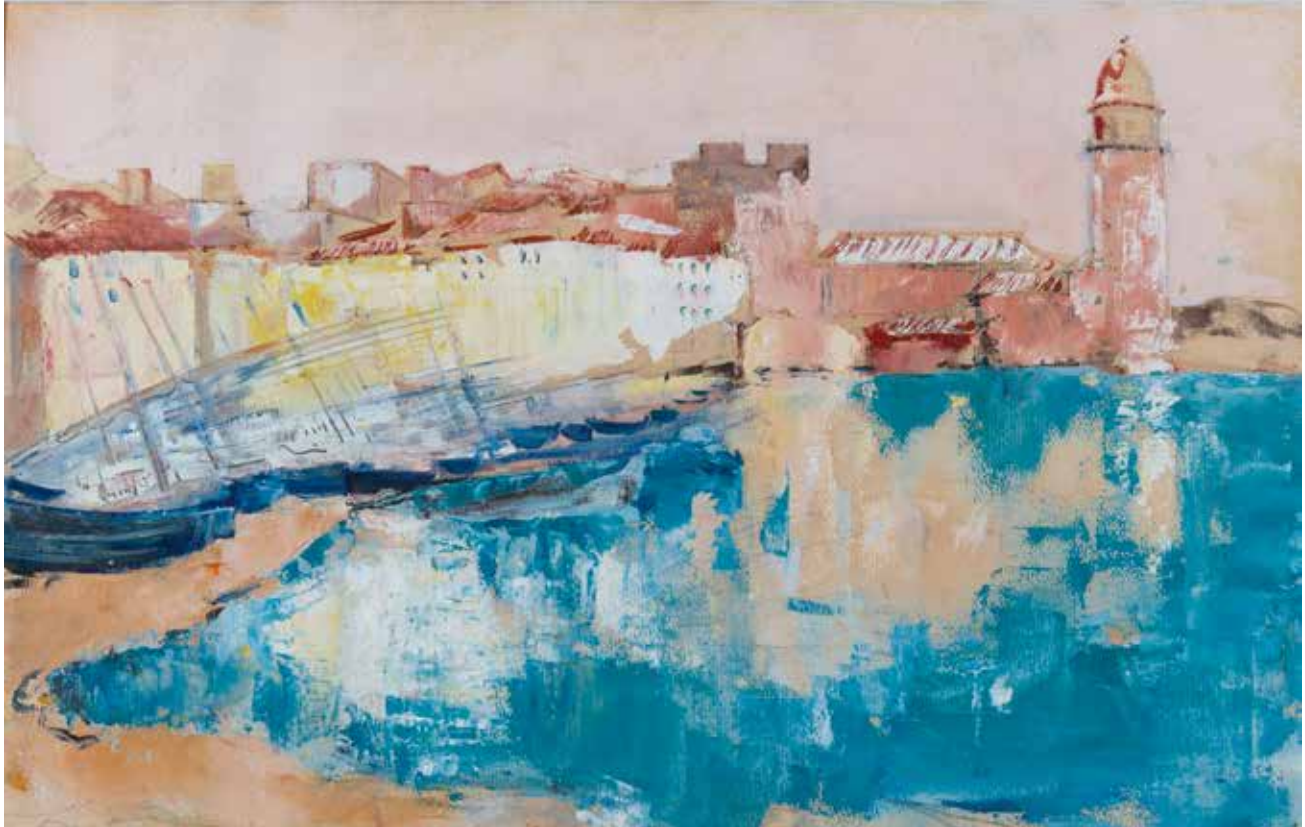
Gezicht op Collioure, 1937