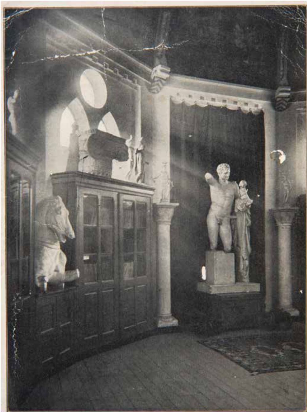
RIJKS-INSTITUUT TOT OPLEIDING VAN TEEKENLEERAREN

Vorzijde prentbriefkaart met het interieur van het Rijksinstituut tot opleiding van teekenleeraren Vereniging Het Museum, Winterswijk