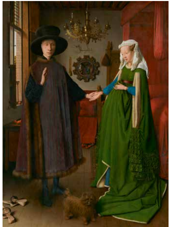
Jan van Eyck, Portret van Giovanni Arnolfini en zijn vrouw, 1434, 82,2 x 60 cm, olieverf op paneel, The National Gallery / Bridgeman Images

Studies in de kunst sinds het einde van de negentiende eeuw analyseren de wil tot het produceren van die kunst, aansluitend met het doel en de functie, in het kader van het uitdrukken van emoties, het zij persoonlijk als expressie van levensgebeurtenissen of gedachten van de kunstenaar zelf, het zij in de context van externe gebeurtenissen of brede tendensen. In de hedendaagse kunstgeschiedenis is de associatie tussen kunst en emotie een vanzelfsprekendheid. De kunstenaar is een gevoelige, geïnspireerde persoonlijkheid die de eigen tijdsgeest beeldend vertaalt. Dit gegeven is echter een relatief nieuw concept. De eerste kunsthistorische beschouwingen, daterend van de eerste helft van de zestiende eeuw, waren niet gebaseerd op het idee van de kunstenaar als visionair of van kunst als een spiegel van de tijdsgeest maar wel op de functie van het werk en de kwaliteit waarmee deze functie vervuld werd. Een portret van een vorst, bijvoorbeeld, was bedoeld om het gezag van de persoon in kwestie te legitimeren. Een religieus altaar had daarbij de functie om de liturgie beeldend te maken en de gelovigen te overtuigen. De functie tot overtuigen, die de overhand had bij kunst gemaakt tijdens het Ancien Régime, een benaming voor de maatschappelijke structuur zoals die bestond voor de Franse Revolutie, werd aanzienlijk verbonden aan