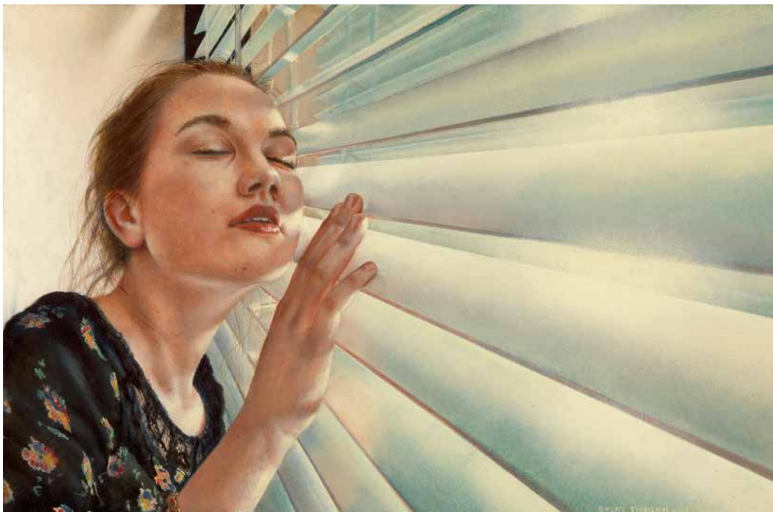
Groot Verlangen, 2014, 29,5 x 44 cm, tempera op paneel