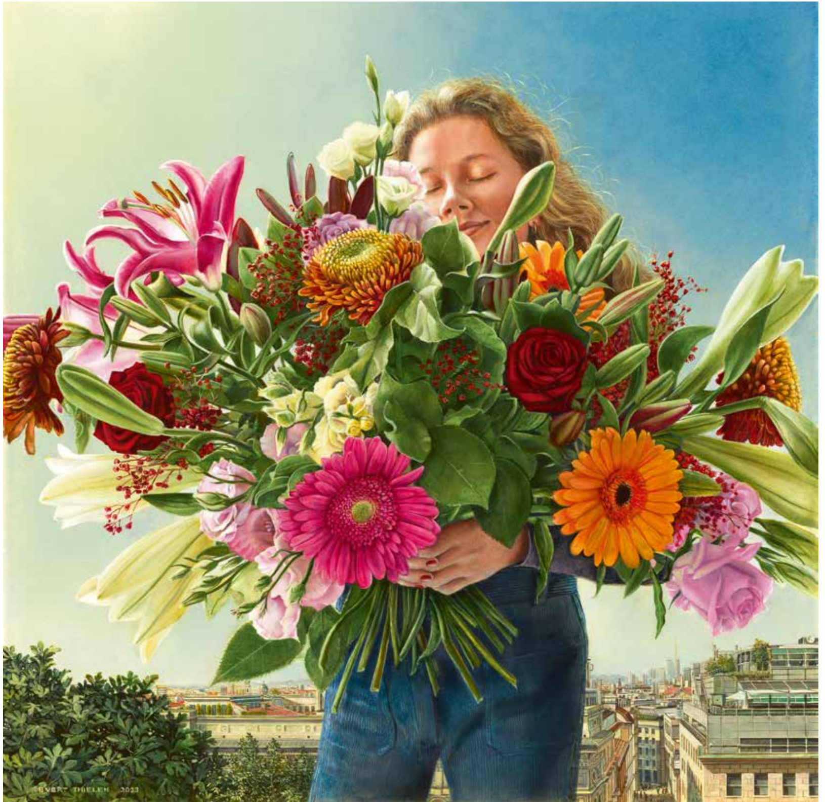
Flora, 2023, 67 x 67 cm, tempera op paneel