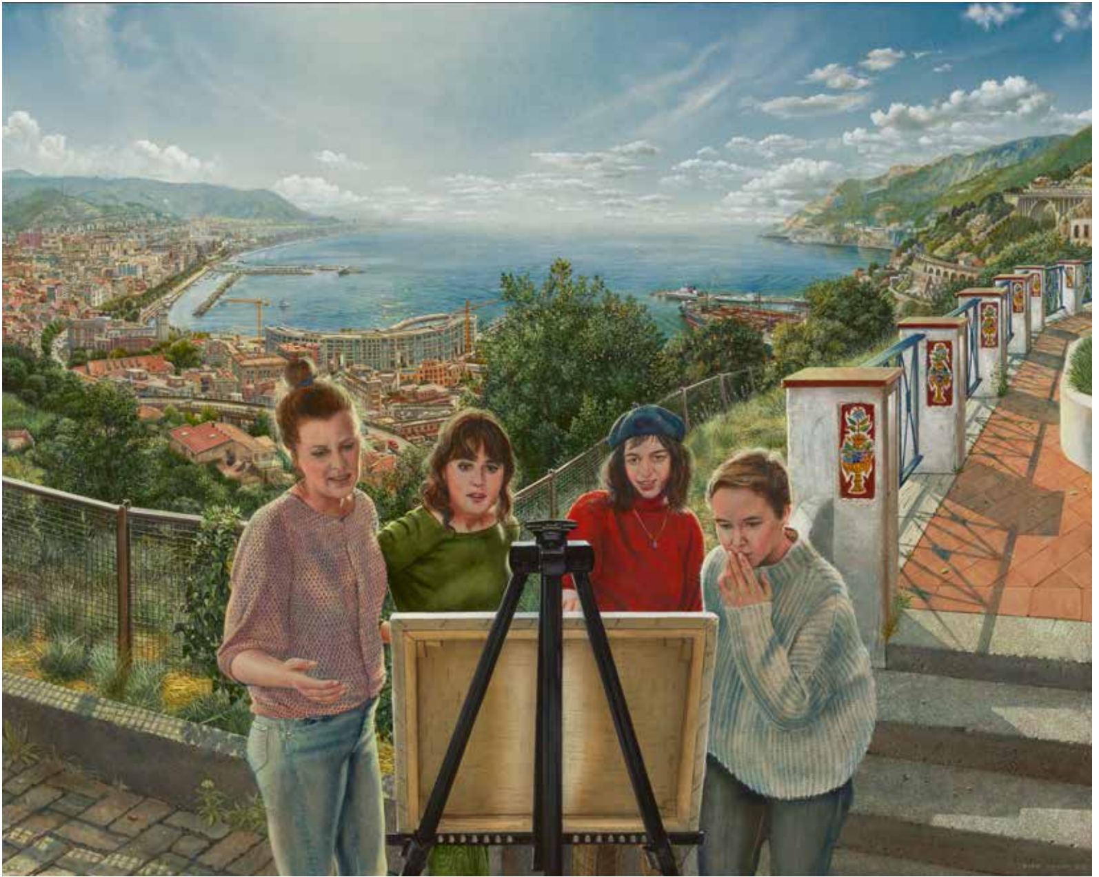
Samenspel, 2022, 100 x 120 cm, tempera op paneel