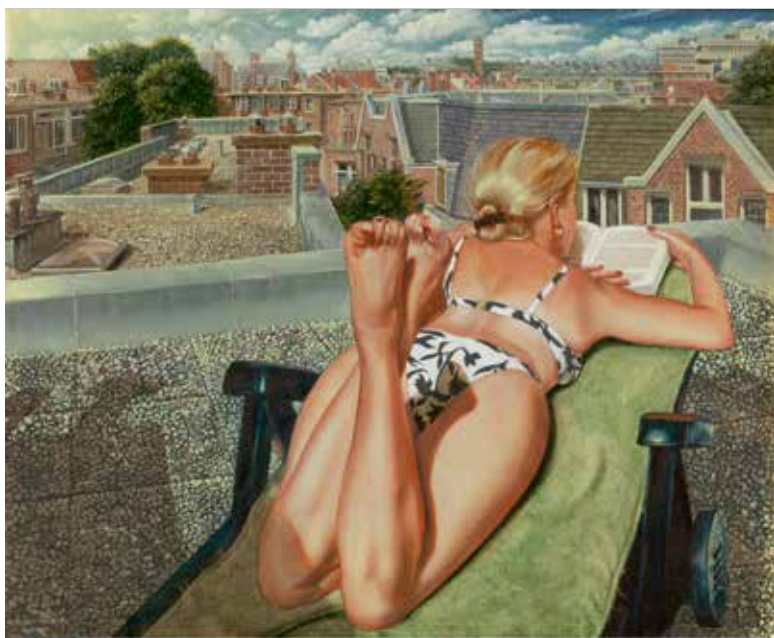
Dakterras, 2007, 40 x 50 cm, tempera op paneel

daarbij op te merken dat deze genderspecifieke tegenstelling niet alleen geïnterpreteerd moet worden als een relationeel gegeven, maar vooral als een uitdrukking van de verlanger en het verlangde. Dit gegeven is daarbij niet gender gerelateerd, maar vooral gebaseerd op contrast waardoor voor het uitdrukken van een persoonlijk verlangen voor een tegenovergestelde pendant van het vrouwelijke model, zijnde het mannelijke model, gekozen werd.