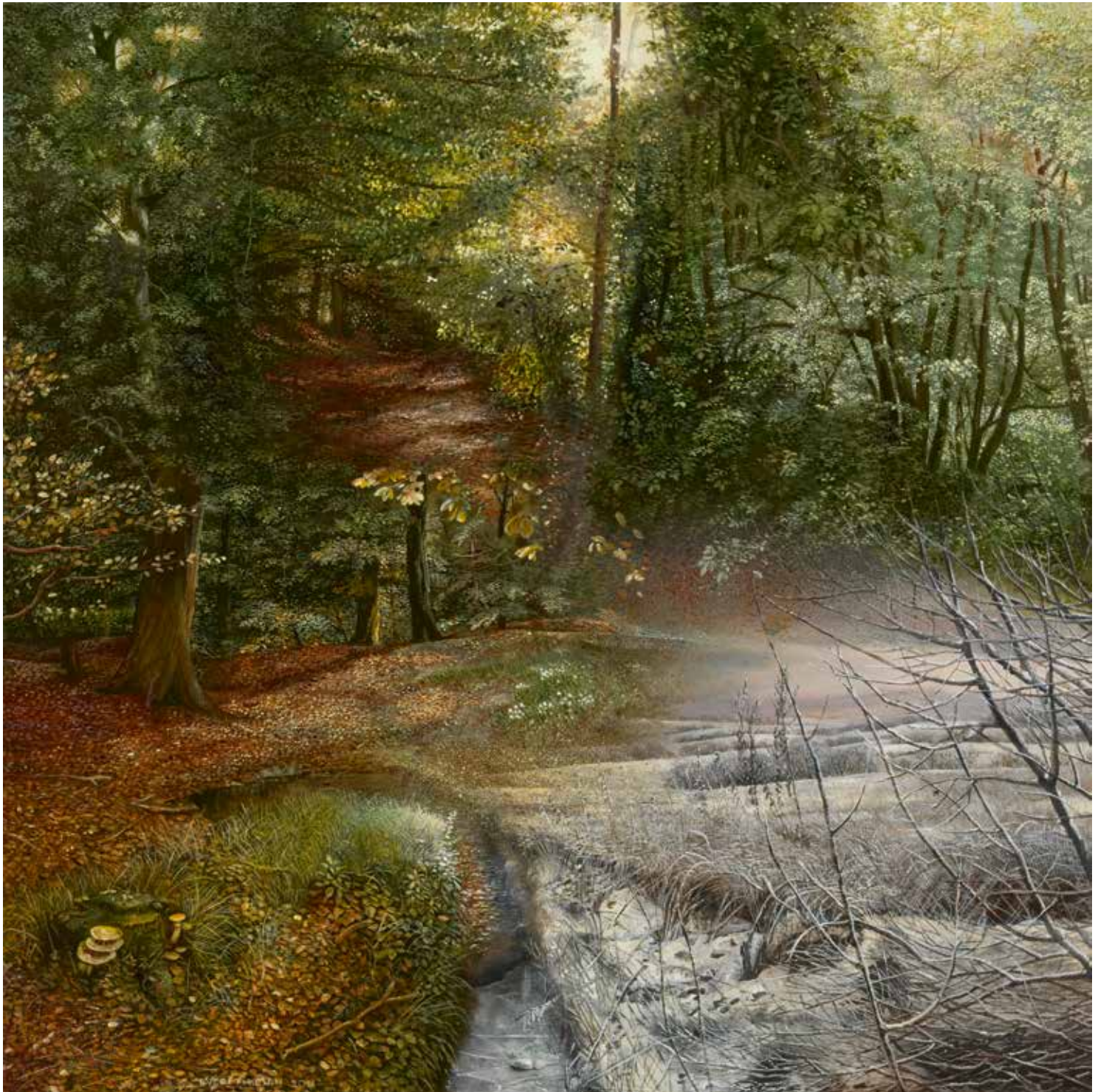
Vier seizoenen, 2014, 57 x 57 cm, tempera op paneel