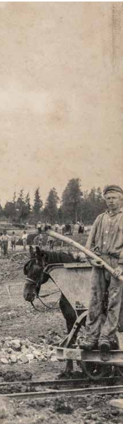
Arbeiders poseren tijdens de werkzaamheden voor de aanleg van de vijverpartij en het beoogde grondreliëf voor het park van Kasteel de Haar, circa 1896