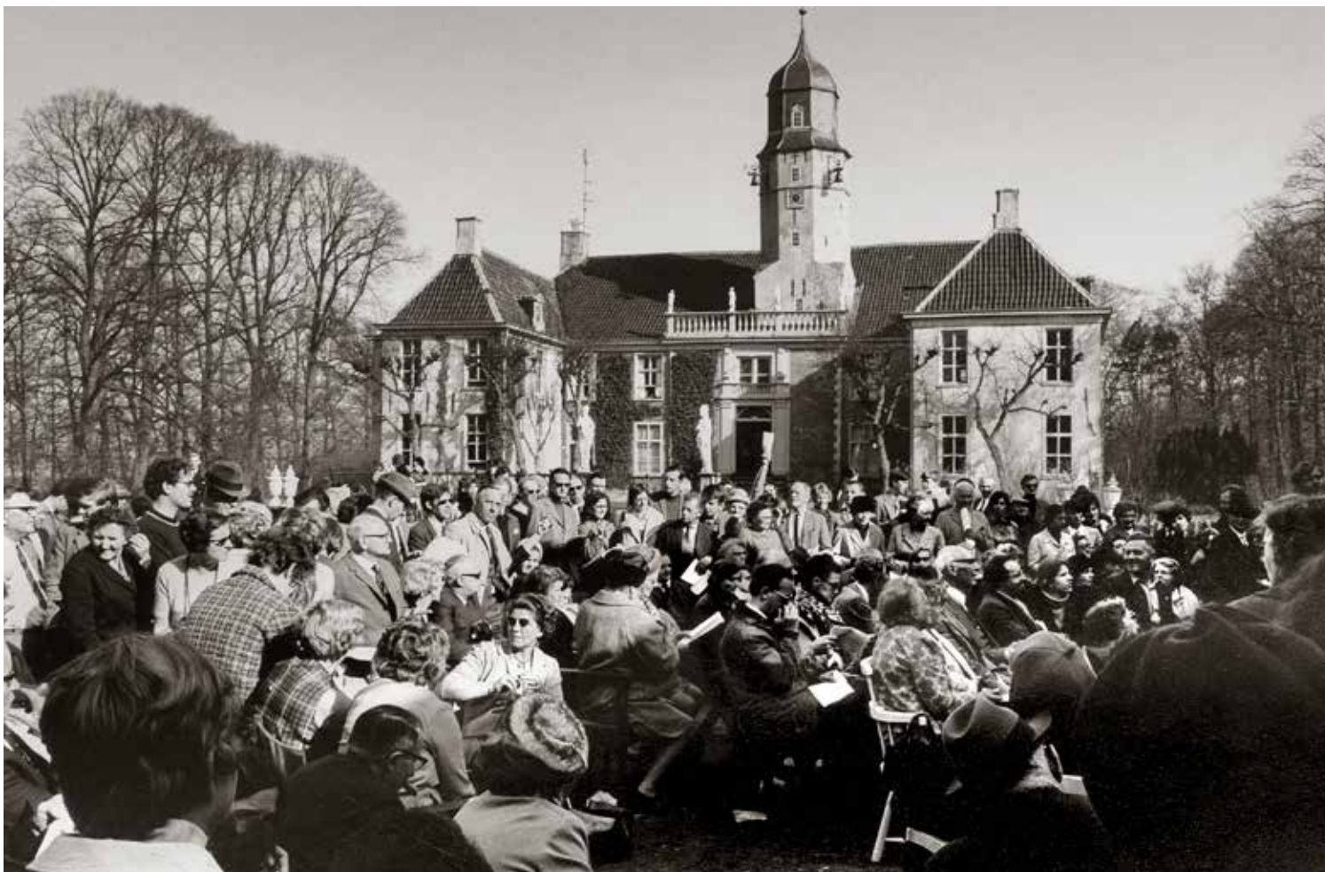
Op de boeldag bij de Fraeylemaborg in april 1971 werden goederen uit de borg te koop aangeboden