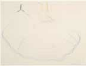
Arno Kramer Zonder titel, 1994

pastelkrijt, houtskool en potlood op papier 31,5 x 24 cm NOG-0247 – aankoop 1994