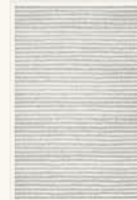
Greet Schutte Zonder titel, 1995

olieverf op doek 53 x 150 cm NOG-0386 – aankoop 1994