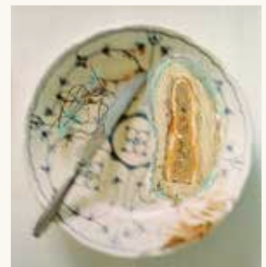
Benoît Hermans Zonder titel , 1993

olieverf en fotopapier op triplex met tak en houtschool 122 x 215 x 2 cm NOG-00251.1-3 – aankoop 1994