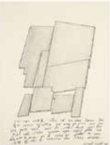
Joseph Sassoon Semah Driedimensionale Typografie II , 1993

brons en cortenstaal 300 x 400 x 40 cm NOG-0395.1-16 – aankoop 1994