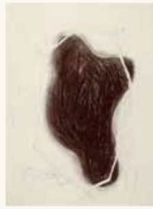
Arno Kramer Zonder titel, 1991

verf, lijm, glas, metaal, stof, fotopapier, kunststof op papier op multiplex 100 x 70 x 3,5 cm NOG-0181 – aankoop 1994