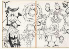
David Bade Zonder titel (Barbecue) , 1994

houtschool op papier 209 x 303 cm NOG-00431.1-2 – aankoop 1994