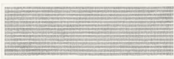
Greet Schutte Zonder titel, 1994

pastelkrijt, houtskool en potlood op papier 23,5 x 32 cm NOG-0249 – aankoop 1994