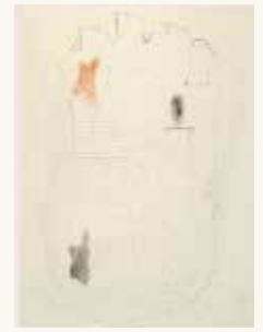
Arno Kramer Zonder titel, 1992

pastelkrijt, houtskool en potlood op papier 31,5 x 24 cm NOG-0246 – aankoop 1994