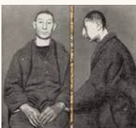
Ossip Portret (Variant B) , 1992

vernis, grafiet en viltstift op papier 138 x 121 cm NOG-0336 – aankoop 1994