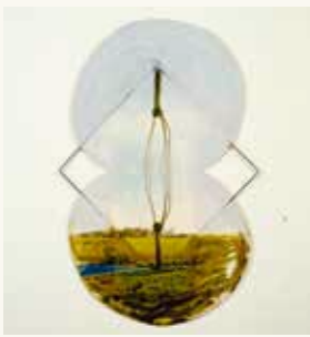
Dick van Arkel Zonder titel , 1994

olieverf, foto, metaal op MDF 111 x 73 cm NOG-0017 – aankoop 1994