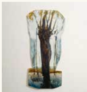
Dick van Arkel Zonder titel , 1991

kleurpotlood op papier 30 x 30 cm NOG-0015 – aankoop 1994