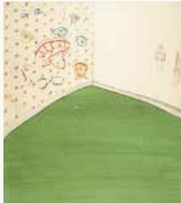
Helen Frik Go on, do it , 1993

aquarelverf op papier 49,5 x 34,5 cm NOG-0128 – aankoop 1994 c/o Pictoright Amsterdam 2024