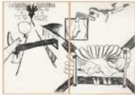
David Bade Zonder titel (Inbreker) , 1994

olieverf, foto, metaal op MDF 111 x 73 cm NOG-0017 – aankoop 1994