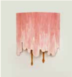
Helen Frik Help , 1998

kleurpotlood op papier 20 x 45 cm NOG-0126 – aankoop 1994 c/o Pictoright Amsterdam 2024