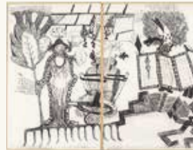
David Bade Zonder titel (Tuinman) , 1994

houtschool op papier 208 x 301 NOG-00441.1-2 – aankoop 1994