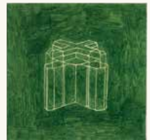
Marlies Appel Zonder titel , 1994

kleurpotlood op papier 30 x 30 cm NOG-0012 – aankoop 1994