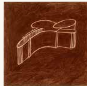
Marlies Appel Zonder titel , 1994

fotopapier, lakverf en zand op multiplex 116 x 189 cm NOG-0338 – aankoop 1994