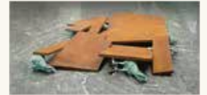
Joseph Sassoon Semah Driedimensionale Typografie II , 1994

olieverf op doek 150 x 100 cm NOG-0387 – aankoop 1995