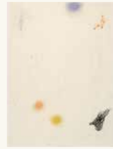
Arno Kramer Zonder titel, 1992

pastelkrijt, houtskool en potlood op papier 31,5 x 24 cm NOG-0244 – aankoop 1994