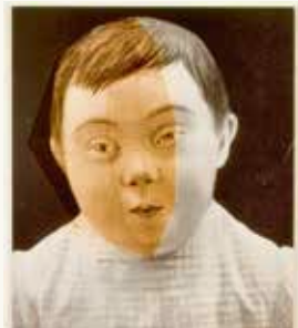
Ossip Robijn (variant C) , 1992

fotopapier, lakverf, acrylverf, vernis, lijm op multiplex 170,5 x 118 cm NOG-0335 – aankoop 1994