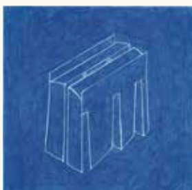
Marlies Appel Zonder titel , 1994

kleurpotlood op papier 30 x 30 cm NOG-0014 – aankoop 1994