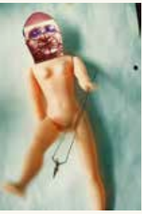
Benoît Hermans Zonder titel, 1993

fotopapier, gouacheverf, perspex, lak, messing, lijm en papier op kunststof 97 x 66 cm NOG-0180 – aankoop 1994