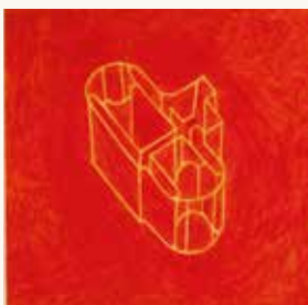
Marlies Appel Zonder titel , 1994

kleurpotlood op papier 30 x 30 cm NOG-0013 – aankoop 1994