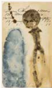
Virgil Grotfeldt Leger , 1994

potlood op papier 47,5 x 36 cm NOG-0396 – aankoop 1994