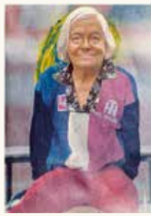
Benoît Hermans Zonder titel, 1993

fotopapier, gouacheverf, perspex, lak, messing, lijm en papier op kunststof 97 x 66 cm NOG-0180 – aankoop 1994