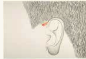
Helen Frik Oor , 1994

aquarelverf, potlood en pigment op papier 76 x 69 cm NOG-0129 – aankoop 1994 c/o Pictoright Amsterdam 2024