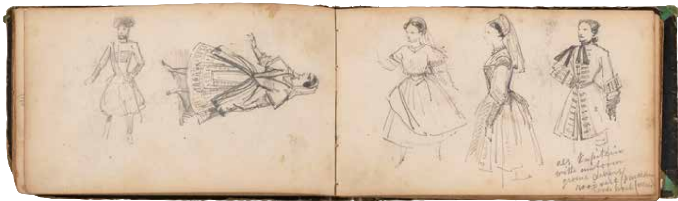
Charles Rochussen , Schetsboekje , 1852-1853, potlood op papier, 10,5 x 17,0 cm.