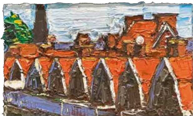
Carlos Blaaker , Achterkant huizen Lange Hilleweg , 2001, olieverf op doek, 10 x 20 cm.