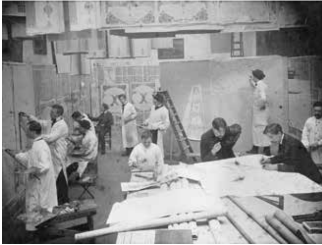
1905-1930, fotografie.