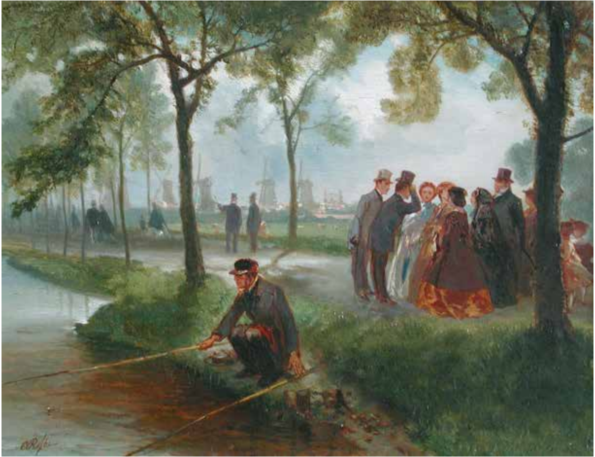
Charles Rochussen, De zondagmiddagwandeling , 1861, olieverf op paneel, 20 x 26 cm. Museum Rotterdam

Een keurig gekleed gezelschap van enkele dames en heren ontmoet elkaar op deze laan met bomen. Op de achtergrond zijn de molens aan de Oostzeedijk te zien en in het midden steekt de gashouder van de Nieuwe Rotterdamsche Gasfabriek aan de Oostzeedijk af tegen de horizon.