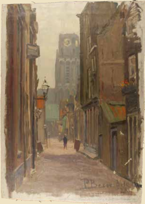
Pieter Been , Lange Torenstraat met Sint Laurenstoren , 1920, 50,5 x 36,0 cm. Museum Rotterdam