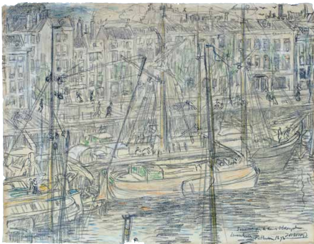
Jan Toorop, Gezicht op de Leuvehaven, 1898, tekening, 48 x 61 cm.