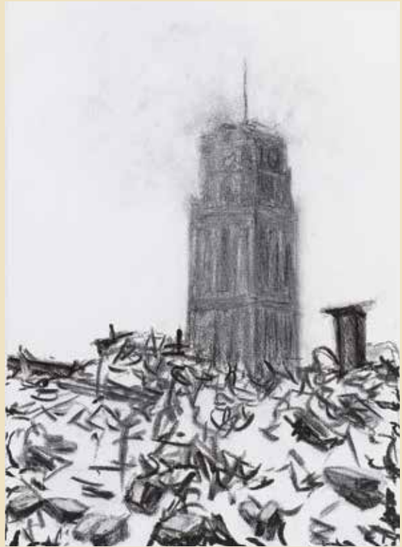
Raquel Maulwurf , Rotterdam - II Laurenskerk 14 V '40 , 2005, 70 x 50 cm, houtskool, oilstick op doek.