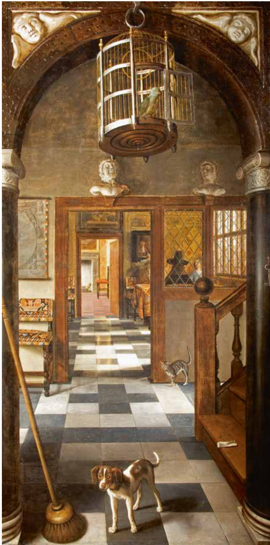
10 Samuel van Hoogstraten Gezicht in een woonhuis , 1662 Olieverf op doek, 264 x 136,5 cm National Trust, Dyrham Park, Gloucestershire