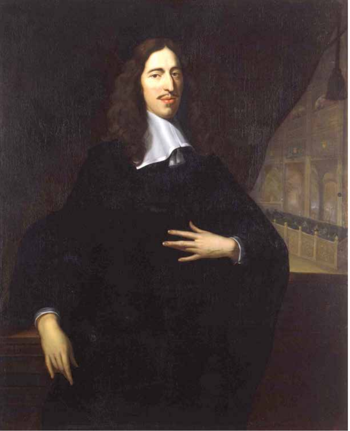
Jan de Baen, Portret van Johan de Witt , ca. 1669, olieverf op doek, Dordrechts Museum