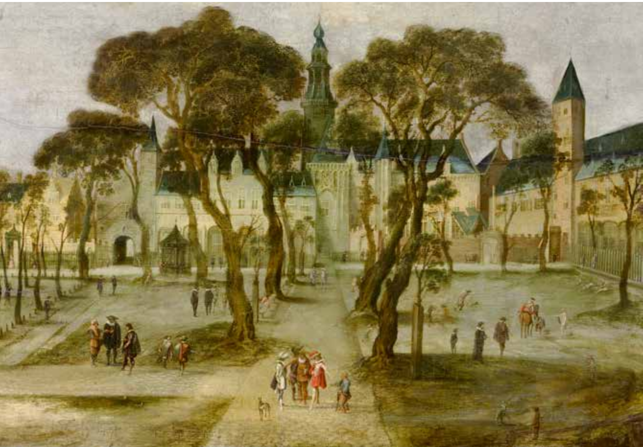
Anoniem, Abdijplein in Middelburg, ca. 1620–1650, olieverf op paneel, Zeeuws Museum

J ohan de Witt hield zijn hoofd koel. Hij was nog geen 28 jaar oud, werd achterna gezeten door een bloedbeluste menigte en hij bleef rustig. Zelfs naar zeventiende-eeuwse maatstaven was dat opmerkelijk.