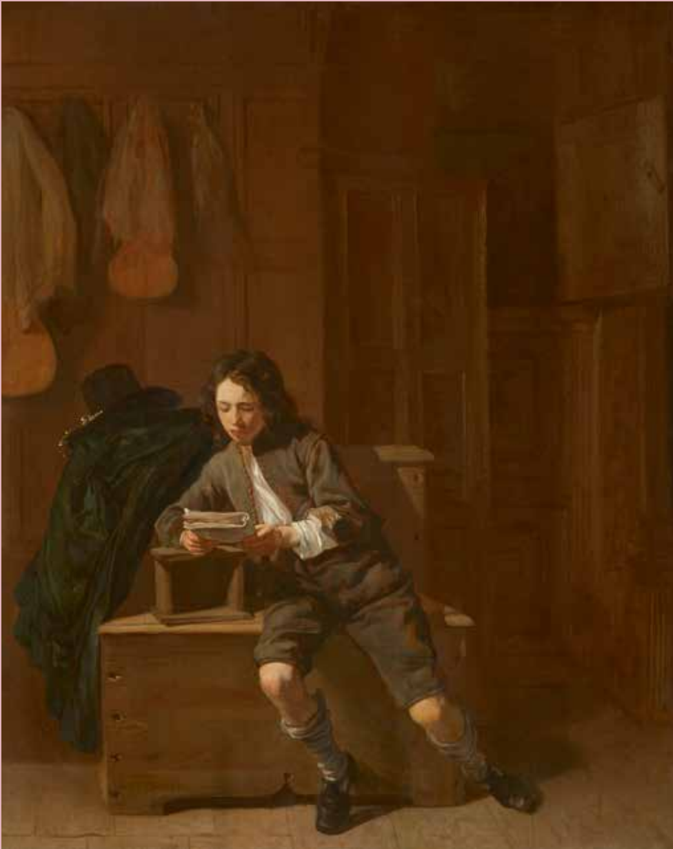
1. Jacob van Loo, Lezende jongeman , ca. 1650.

Amsterdam, culturele vrijhaven van de zeventiende eeuw en boekhandel van de wereld