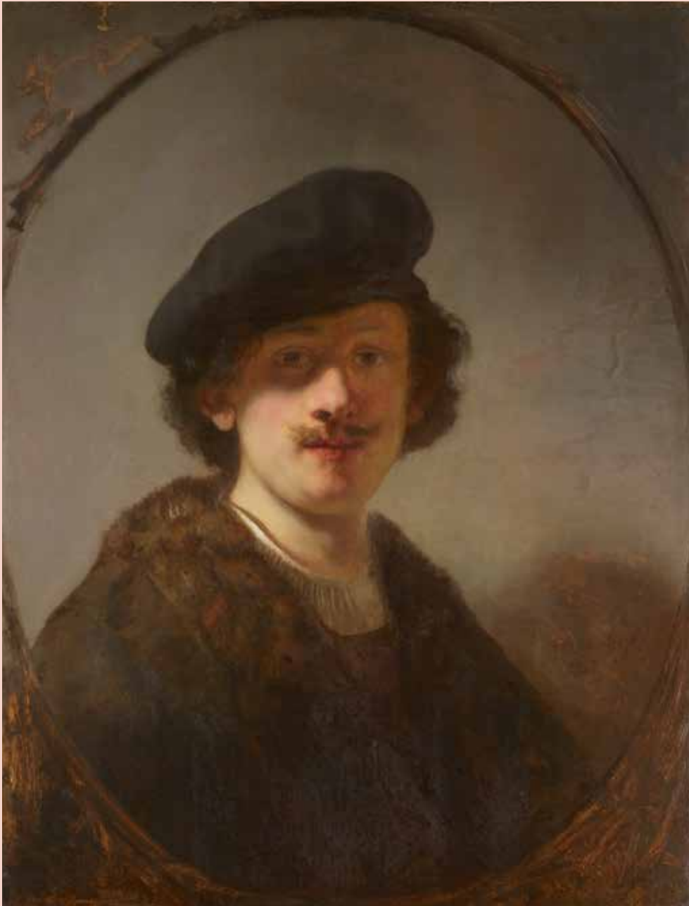
1. Rembrandt van Rijn, Zelfportret met ogen in de schaduw , 1634.