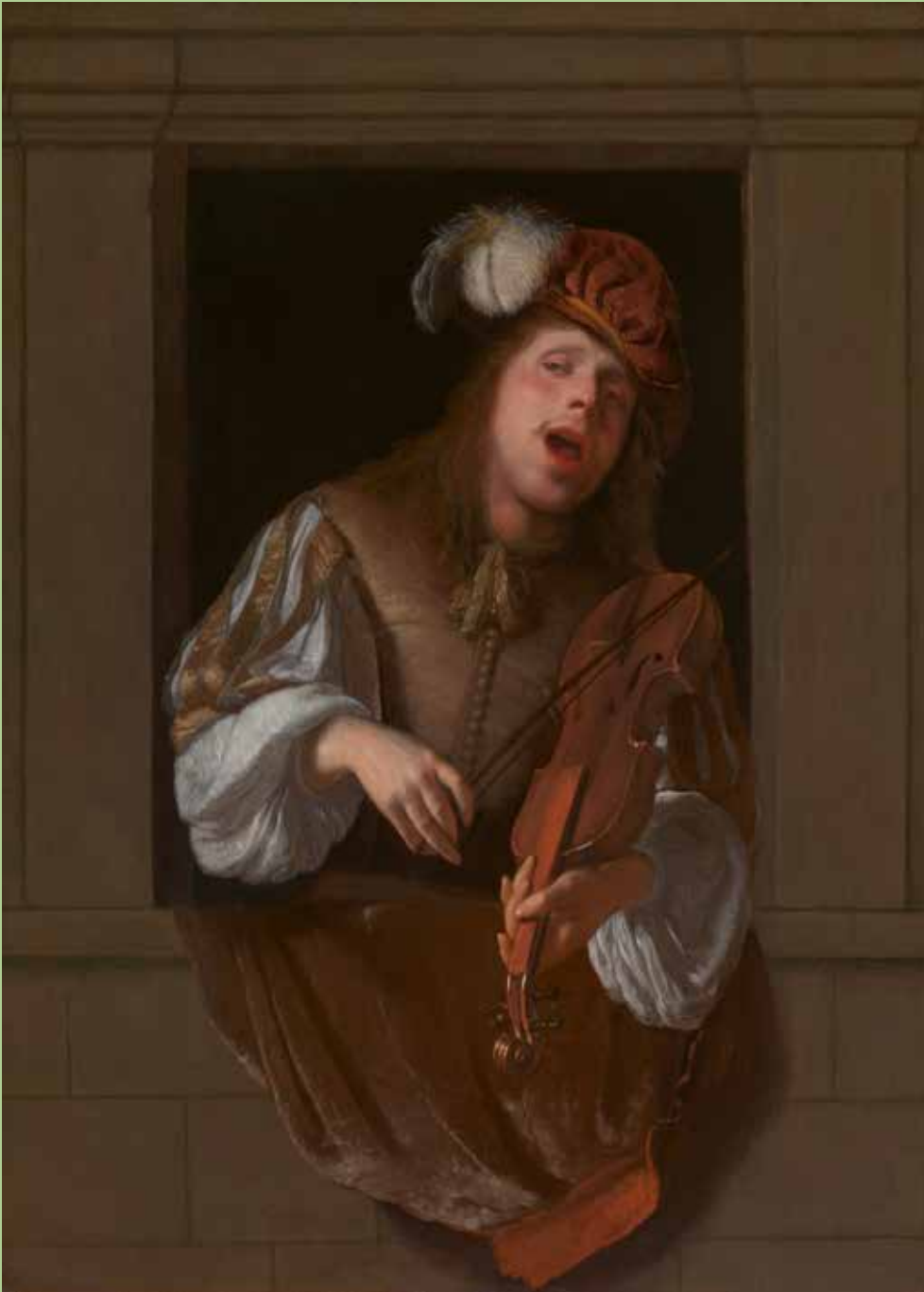
1. Jacob Ochtervelt, Zingende violist , ca. 1666–1670.