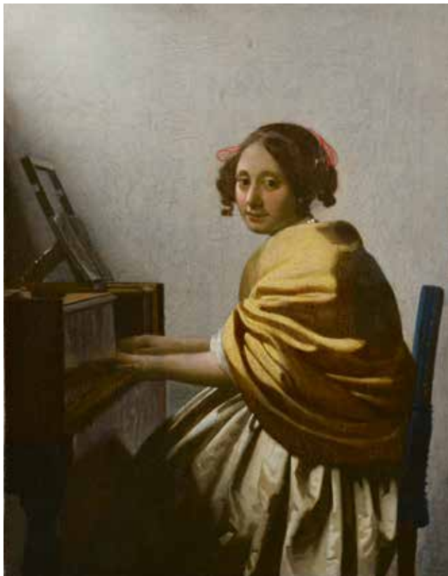
2. Johannes Vermeer, Jonge vrouw aan het virginaal , ca. 1670–1675.

Deze tentoonstelling put uit de grote kracht van The Leiden Collection, namelijk de weergave van de mensheid in al zijn facetten, van portretten en genrestukken tot bijbelse en mythologische onderwerpen. De ontembare geest van het Nederlandse volk is constant voelbaar wanneer je door de tentoonstelling loopt, niet alleen als je je verwondert over Rembrandts formele portretten van rijke burgers, maar ook als je zijn expressieve 'tronies' (karakterstudies) van mannen en vrouwen uit verschillende sociale klassen bekijkt. Andere schilderijen van kunstenaars als Gerard Dou, Gabriel Metsu en Frans van Mieris uit Leiden en Gerard ter Borch uit Deventer, tonen activiteiten die de Nederlanders bezighielden