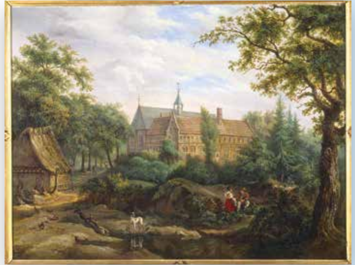
Het klooster Ter Apel gezien uit het noordoosten, omstreeks 1804 geschilderd door notaris A.H. Koning. Van de noord- en oostvleugel werden in 1834 de bovenverdiepingen, met daarin de monnikencellen, afgebroken. De westvleugel ging midden achttiende eeuw al verloren door een brand.

Dat laatste gold niet alleen voor de natuur. Op het platteland en onder ‘het volk’ zou nog een oervorm van de eigen cultuur voortleven, terwijl stadsbewoners zich van hun eigen wortels hadden vervreemd. Zij waren immers internationaal georiënteerd en hun leefomgeving was bepaald door technische ontwikkelingen en de laatste modes. Evenals het ongerepte landschap, kwamen zaken als regionale klederdracht, gebruiken en de bouw van huizen en boerderijen in de belangstelling te staan. Maar waar waren die eigenlijk in hun meest