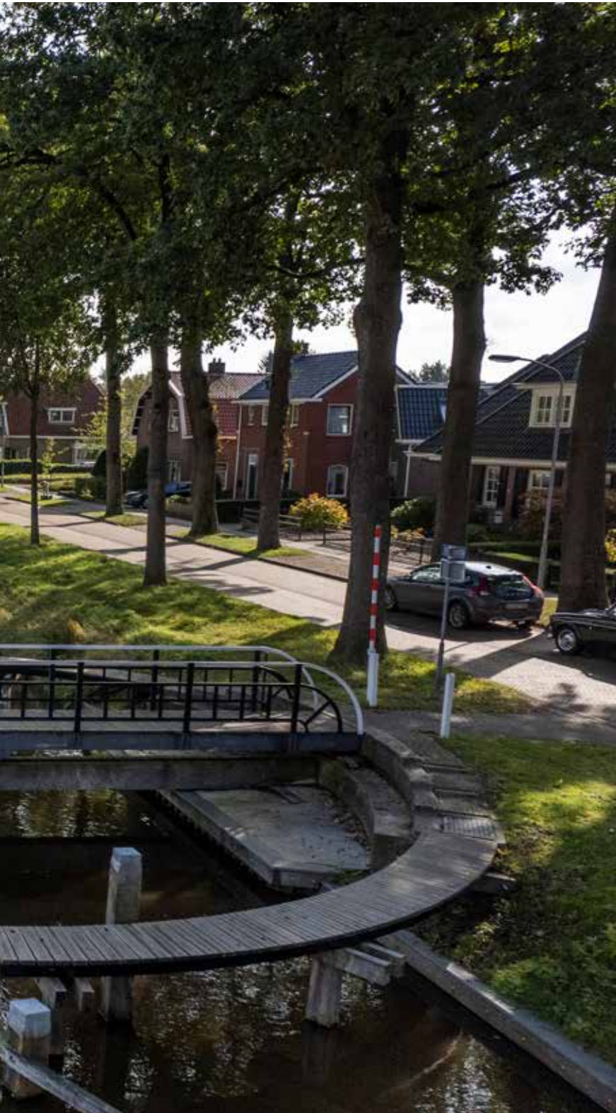
De Hoofdstraat en het kanaal in Ter Apel