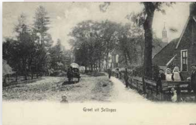
Dorpsgezicht van Selligen, omstreeks 1900-1905. Rechts staat de omstreeks 1300 gebouwde kerk.