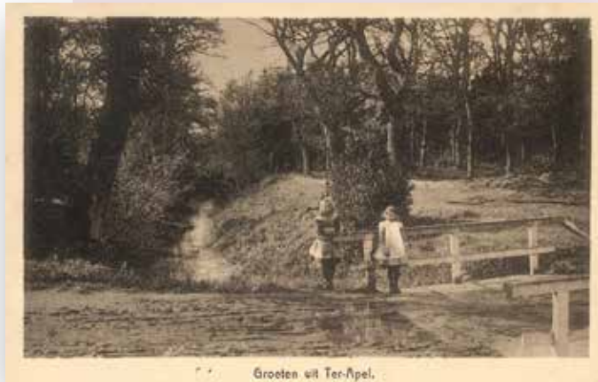
De Esschenbrug achter het Boschhuis richting Laudermarke zou volgens overlevering al aangelegd zijn in de kloostertijd. Ansichtkaart uit ca. 1920.