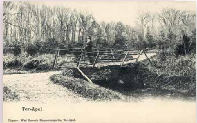
Bruggetje op een onbekende locatie, mogelijk in het wandelbos rondom het klooster. Ansichtkaart uit ca. 1900-1905.