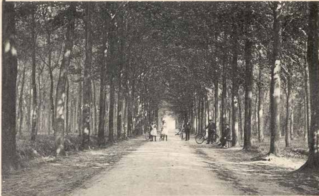
Lindelaan nabij het klooster Ter Apel en het Boschhuis, ca. 1910-1920.