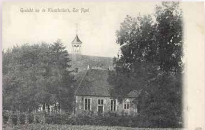
De kloosterkerk van Ter Apel, ca. 1900-1905.