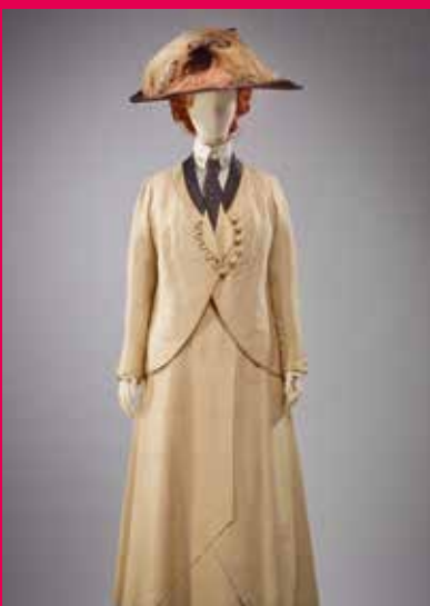
Seider Grieder Mantelpak met hoed, ca. 1910-1912 Kunstmuseum Den Haag, p. 68