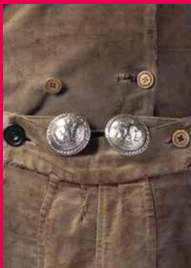
Werkpak of pilopak Urker visser, ca. 1930-1950 Zuiderzeemuseum Enkhuizen, p. 92-93