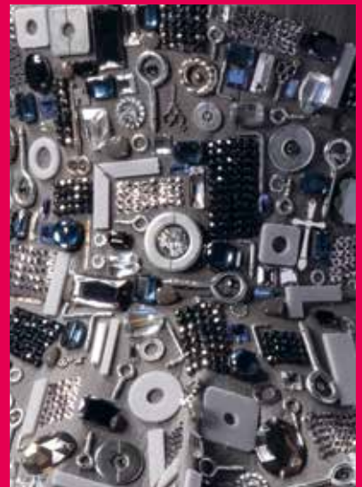
Claes Iversen Jurk uit de collectie 8-pieces , 2014 Fries Museum Leeuwarden, p. 21