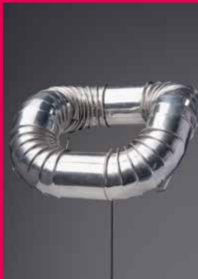
Gijs Bakker Kachelpijp collier , 1967 Design Museum Den Bosch, p. 44