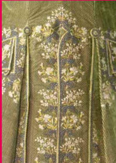
Galajas of -rok, ca. 1775-1785 Rijksmuseum Amsterdam, p. 22