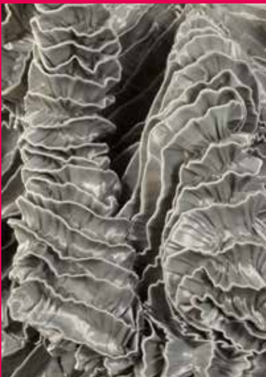
Iris van Herpen Jurk uit de collectie Escapism , 2011 Centraal Museum Utrecht, p. 108