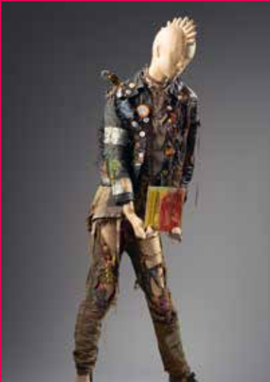
Outfit punker uit Rotterdam, 1981-1983 Museum Rotterdam, p. 41