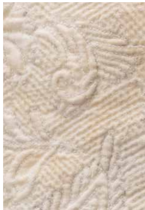
Detail van Zaanse stikwerk, 1700-1799 Collectie Zaanse Museum Zaandam Inv.nr. ZO-V-04611