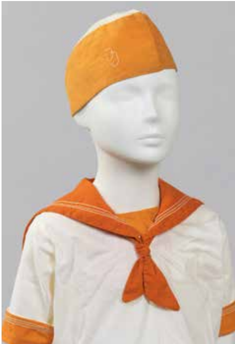
Roos Jenniskens-Engels Matrozenpak, gemaakt voor de bevrijding van Meterik (Limburg) met geborduurd initialen van de drager, 1944 Collectie Nederlands Openluchtmuseum Arnhem, inv.nr. N.45036

werkelijkheid of draagbaarheid, het gaat om de vrijheid van denken.' De op het eerste gezicht klassieke cocktailjurk wordt in een handomdraai getransformeerd in een jurk met stola. De ontwerper besloot de stof te laten tuften; een onverwachte keuze, want deze techniek wordt overwegend voor zware tapijten gebruikt. Hij wist haar te laten werken door niet met het gebruikelijke materiaal wol, maar met onder andere repen chiffon-zijde te tuften, met een soepel vallende stof als resultaat.