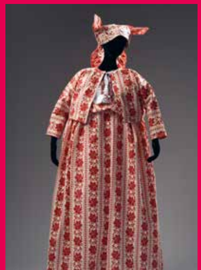
Kotomisi-ensemble uit Paramaribo, 1900-1950 Wereldmuseum, p. 111