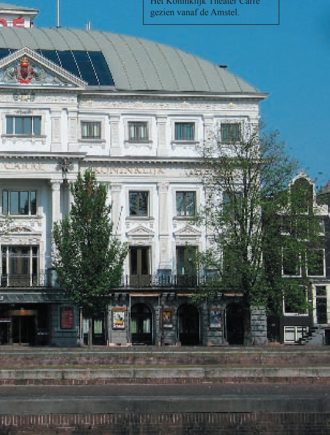
Afbeelding 3 Het Koninklijk Theater Carré gezien vanaf de Amstel.