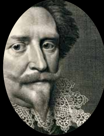
Detail van afb. 7