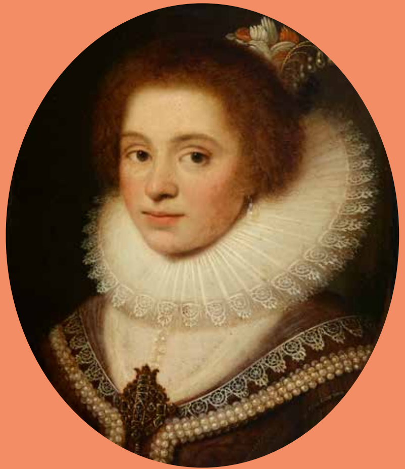
5 Huwelijksportret van Frederik Hendrik | 1610-1620 Michiel van Mierevelt | Olieverf op koper | Museum Prinsenhof Delft