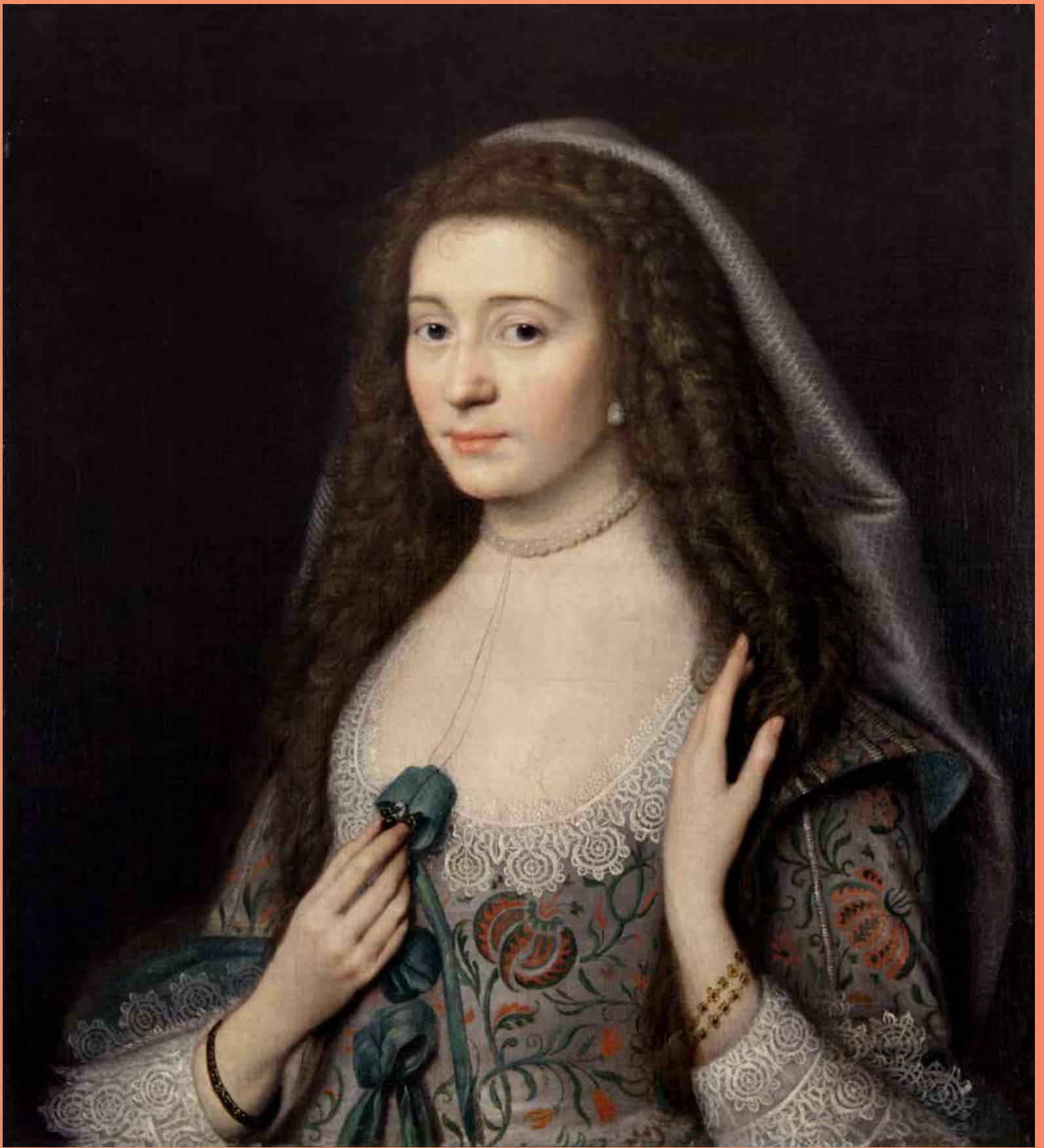
1 Amalia, ongehuwd met hangend haar | 1620-1625 Anoniem | Olieverf op paneel | Muzeum Warmii i Mazur w Olsztynie, Polen (niet in tentoonstelling)