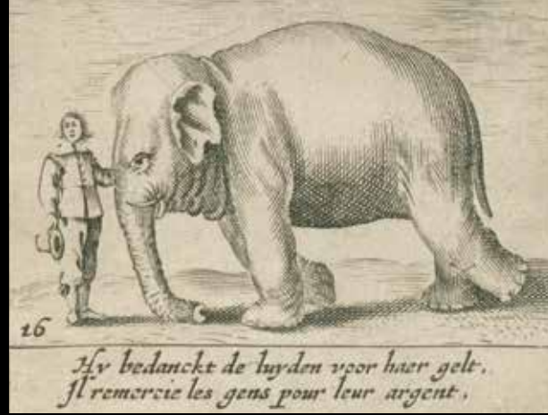
Detail van afb. 43

Dit draagt in hoge mate bij aan het aanzien van haar hof en daarmee aan haar politieke en dynastieke mogelijkheden.