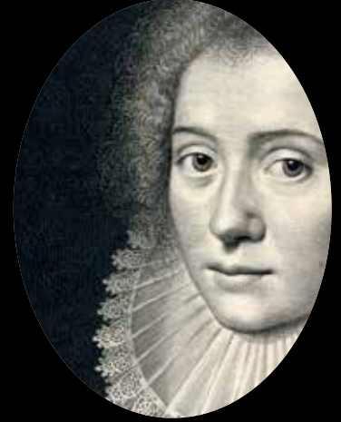
Detail van afb. 8

vrijgezel. Voor Frederik Hendrik is het van essentieel belang om te trouwen. De ongehuwde Maurits, zelf inmiddels op leeftijd en ernstig ziek, stelt zijn halfbroer Frederik Hendrik namelijk deze eis: in het huwelijk treden, zodat het voortbestaan van de Oranjedynastie gewaarborgd is. Hofschilder Michiel van Mierevelt portretteert Frederik Hendrik afb. 2 in de periode dat Amalia hem leert kennen.