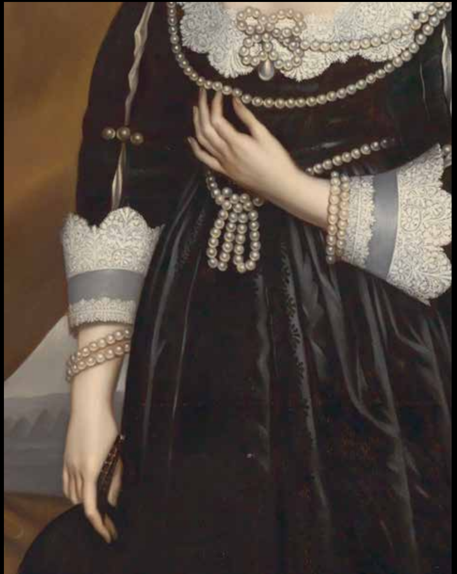
Detail van afb. 32