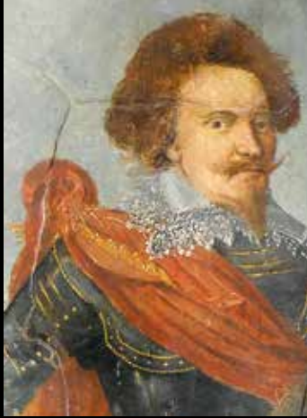
Detail van afb. 35