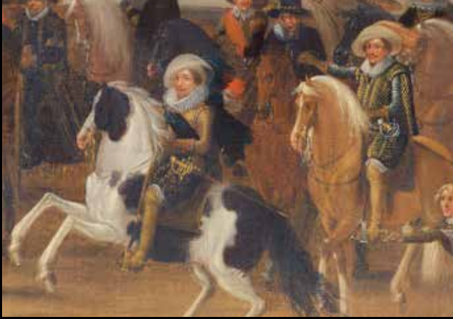
Detail van afb. 4