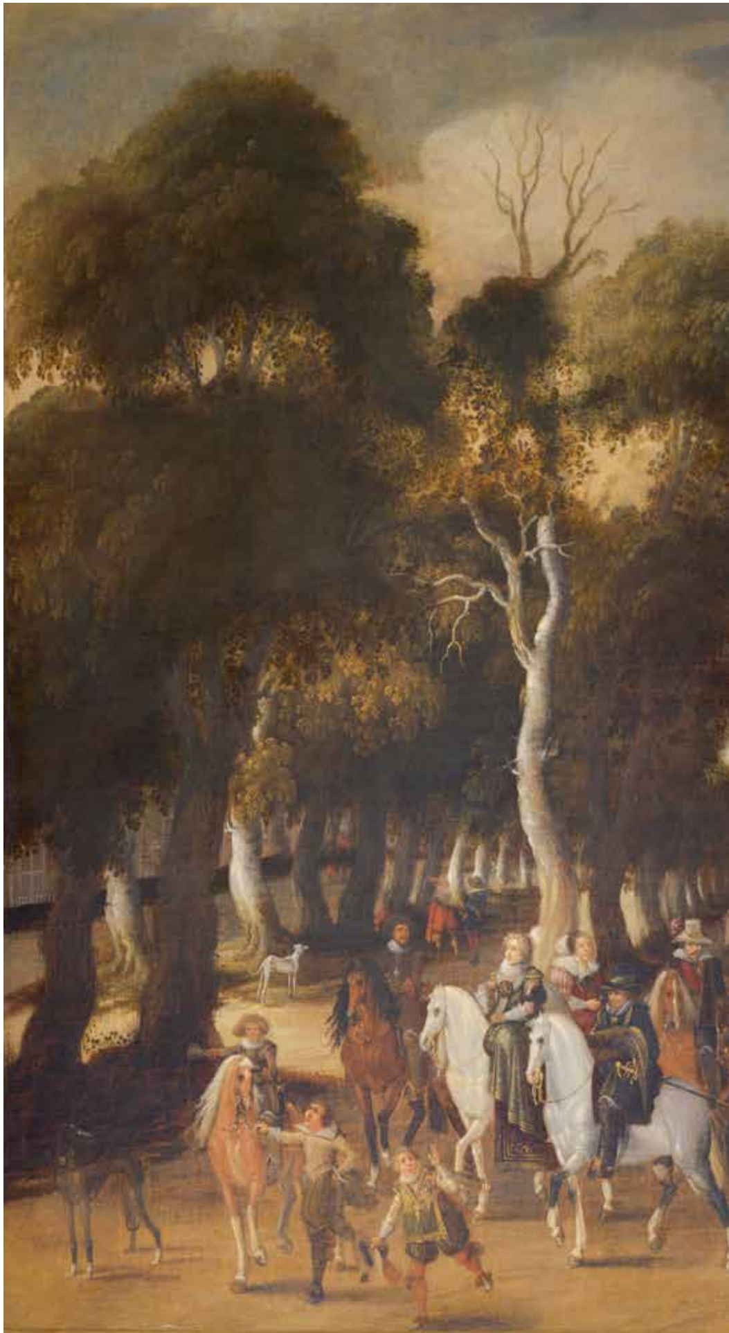
4 Koninklijke ruitersparade (cavalcade) voor het Buitenhof in Den Haag | ca. 1626 Paulus van Hillegaert | Olieverf op doek | Bruikleen particuliere collectie