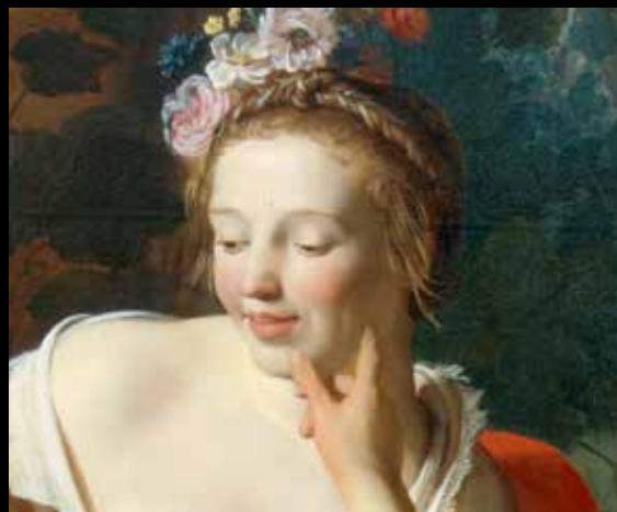
Detail van afb. 25