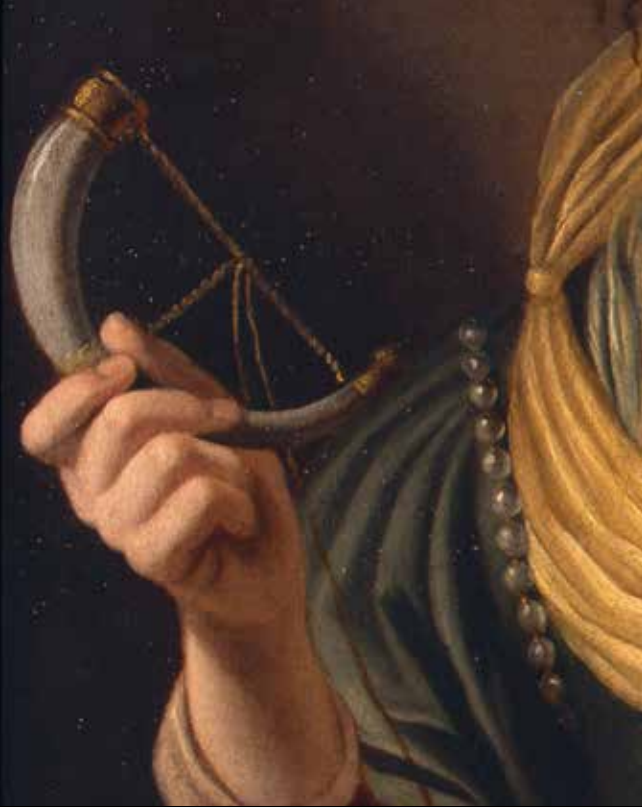
Detail van afb. 50