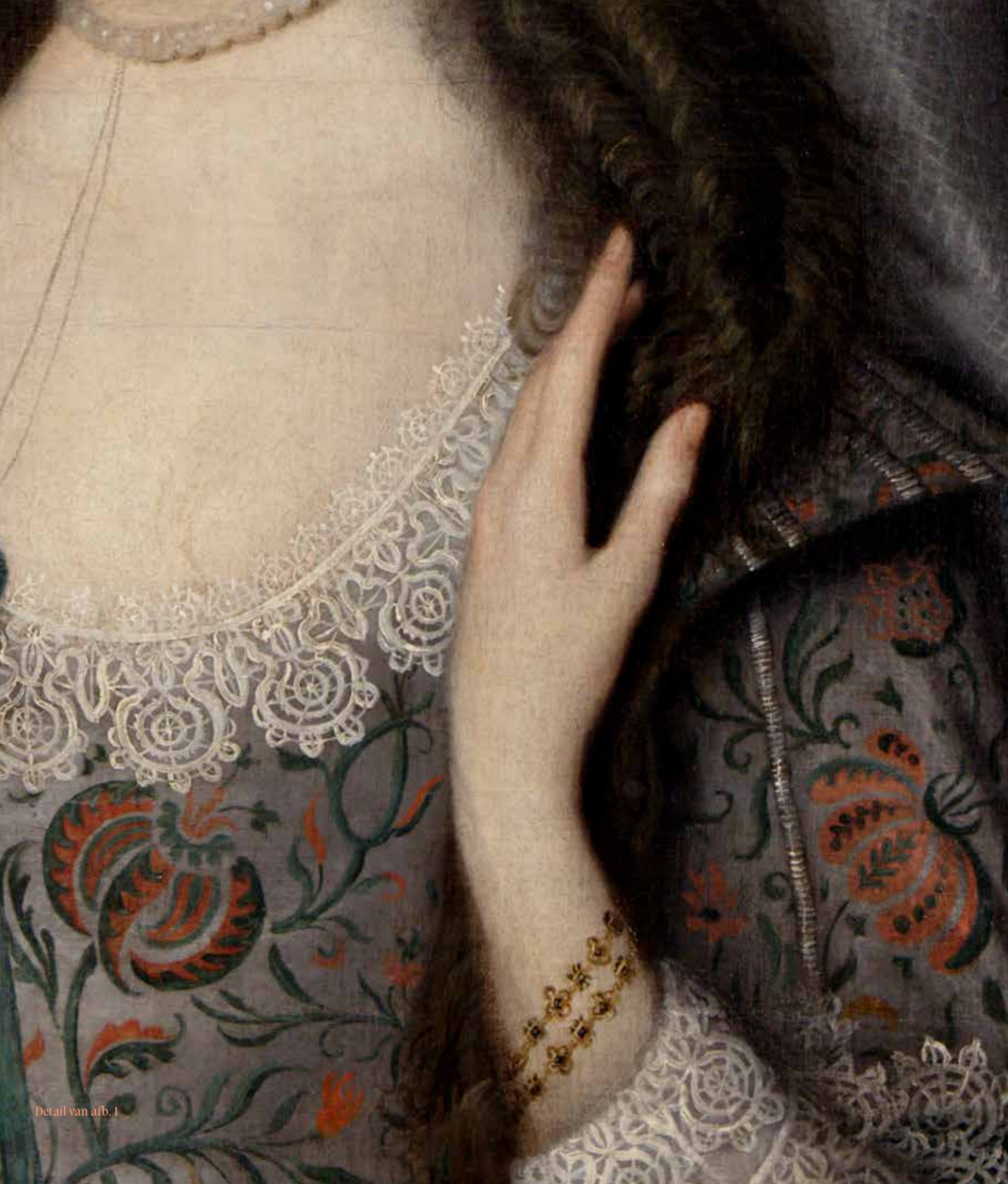
Detail van afb. 1