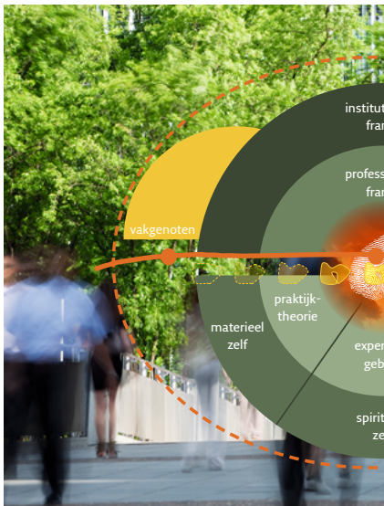
Professionele identiteit: het PI-model