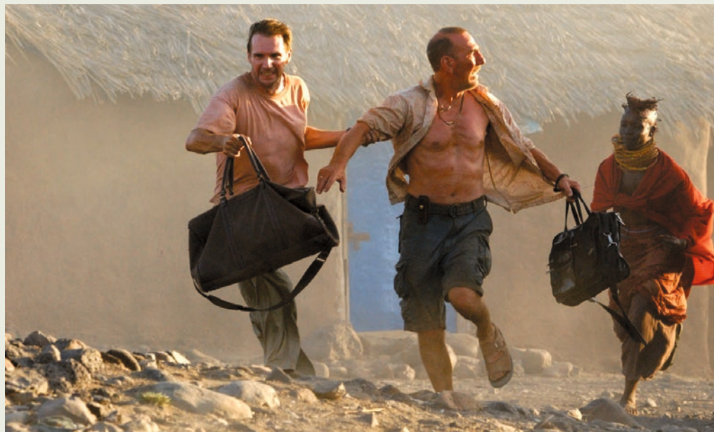
Justin redt Dr. Lorbeer (Peter Postlethwaite) van zijn aanvallers

KVH draagt als waarden uit: kwaliteit, innovatie en ondernemerszin, en dit alles 'for the better' van de gezondheidszorg. Maar hoewel KVH door het ontwikkelen van medicijnen ervoor zorgt dat mensen langer en gezonder leven, gaat het bedrijf over lijken om zijn winst veilig te stellen. Het chanteert mensen om mee te doen aan de test van het tuberculosemedicijn: niet meedoen betekent geen aidsmedicijn. Als het nieuwe medicijn ernstige bijwerkingen vertoont, zou je moeten stoppen met testen en het medicijn eerst verder ontwikkelen. Maar dat zou drie jaar kosten, en het risico is dat de concurrent eerder op de markt komt met een medicijn tegen tuberculose. Dus de test gaat door. Bovendien stopt KVH de kwestie in de doofpot. Fictie? Volgens John le Carré is het verhaal van The Constant Gardener maar een zwakke afspiegeling van hoe het in de realiteit toegaat. Feit is dat het testen van nieuwe geneesmiddelen voor een deel verplaatst is naar ontwikkelingslanden, waar de regels minder streng zijn. Proeven op mensen zijn wel aan strenge regels gebonden – tenminste in het westen.