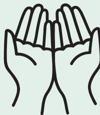
Figuur 1 Kernelementen van de groene bril