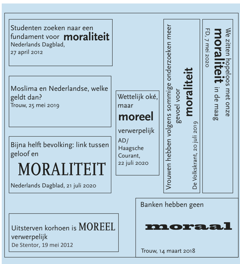
Figuur 1.1 Moraliteit

Als je erop gaat letten, tref je het woord moraliteit regelmatig aan. Zomaar een greep uit de krant: