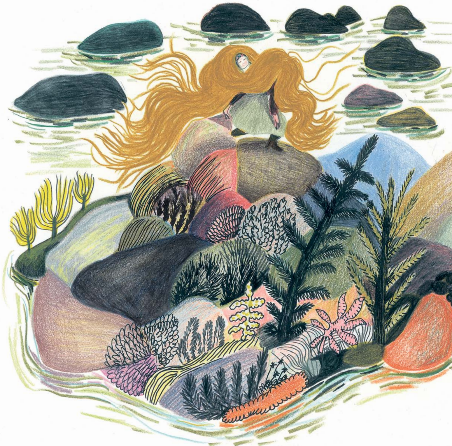
Iris. Regenboogkleurig, zoals parelmoer dat de binnenkant van schelpen bedekt en beschermt.