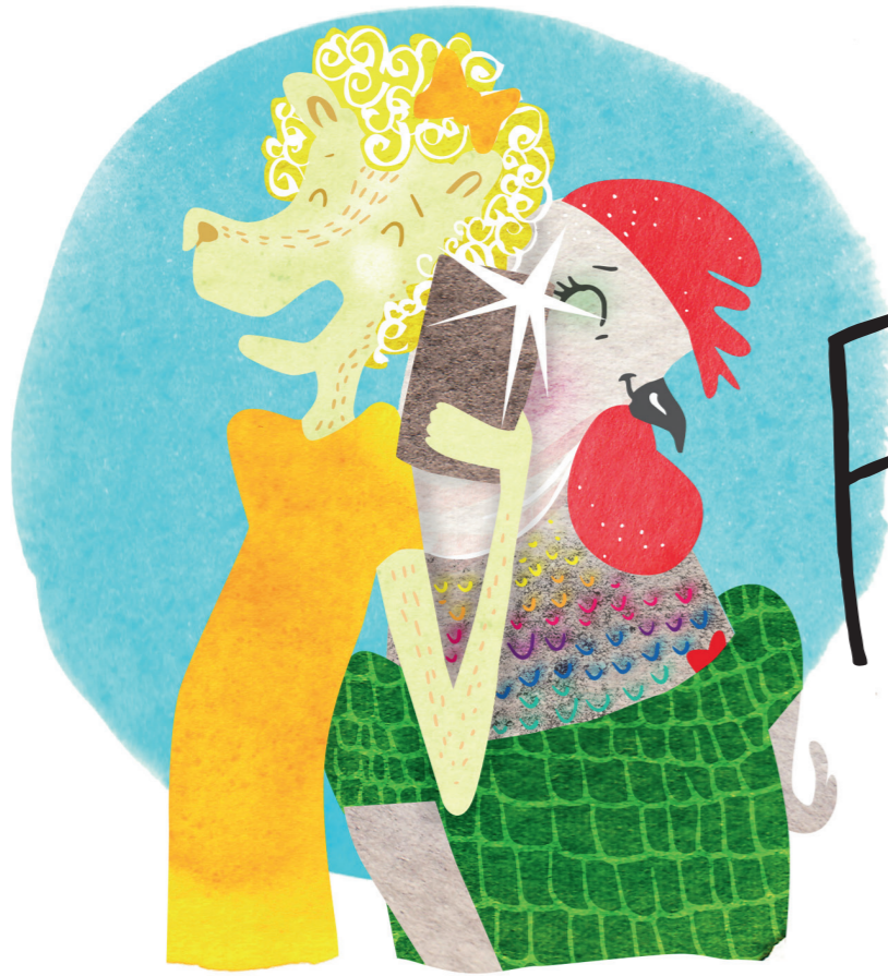
Volgende! Schouder aan schouder.