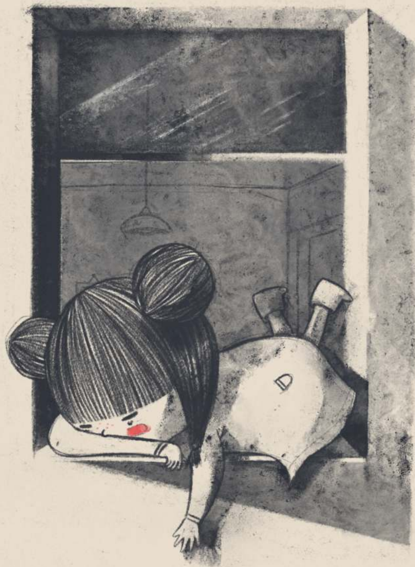
Ik vond het niet buiten.