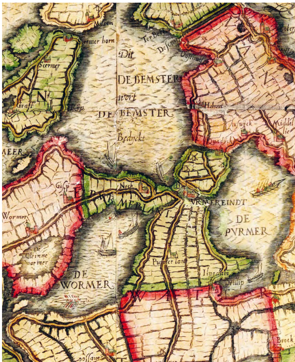
Uitsnede uit de kaart van Beeldsnyder uit 1575, met Neck en Purmerend ingeklemd tussen het Beemstermeer, het Wormermeer en het Purmermeer. Linksboven het Schermeer, rechtsboven de Zuiderzee. Noord-Hollands Archief.