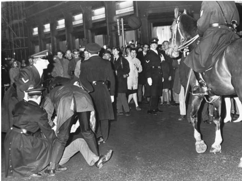
Na de bekendmaking van de geboorte van prins Willem-Alexander ging men op 27 april 1967 massaal naar de Dam; onder hen veel relschoppers en provo's, die rookbommen gooiden. De politie greep in, met de sabel.

onmiddellijk een sprint naar de wachtkamer. Daar stond een wat oudere agent rustig op de dronkenlap in te praten. Na enige tijd liet de man de sabel op de grond vallen en ging weer op het bankje zitten.