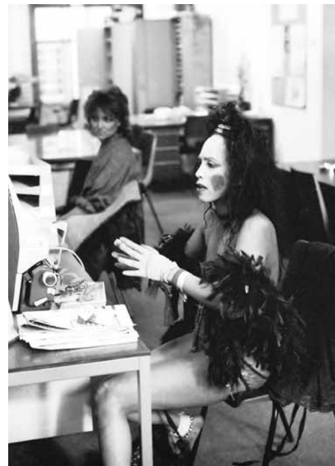
Deze prostituee kwam aangifte doen, vermoedelijk van mishandeling toen haar klant erachter kwam dat zij een hij was; jaren 80