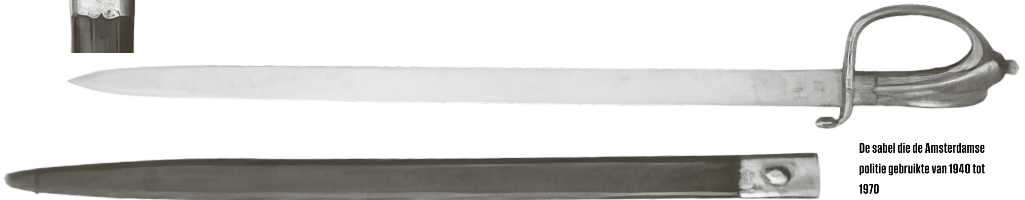
De sabel die de Amsterdamse politie gebruikte van 1940 tot 1970

Omdat de cellen vol zaten, was er een dronken kerel in de wacht- kamer neergezet op het houten bankje aan het raam. Op het hoofd- bureau een cel reserveren voor dronken vechtersbazen was not done, alleen al het transport zou problemen opleveren. Eigenlijk een treurige situatie; zelfs als de agenten terugkwamen na een sur- veillanceronde, was er aan dit bureau geen rustige plek te vinden om even bij te komen. Die avond barstte de bom: die dronken ke- rel kreeg een sabel te pakken en bedreigde de agenten daarmee. Ik hoorde geschreeuw, opende mijn luikje vanuit de balie naar de wachtkamer, zag de man zwaaien met die sabel en trok geschrokken