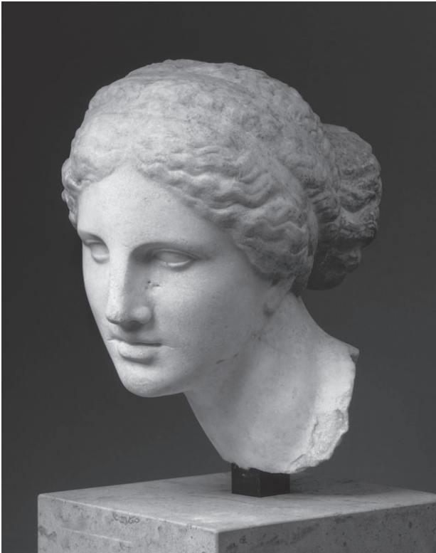
Klassiek Griekse vrouwenbuste, type 'Aphrodite van Melos'. Louvre, Parijs

Ook zeer kort geleden nog voer onder de vlag 'Grote denkers' op de Faculteit Geesteswetenschappen van de Universiteit van Amsterdam een cursus antieke filosofie. De samenstellers namen kennelijk stilzwijgend aan dat denkers filosofen waren en dat de grootste filosofen antieke filosofen waren. Niemand, voor zover ik weet, heeft er ooit tegen gepesteeerd.