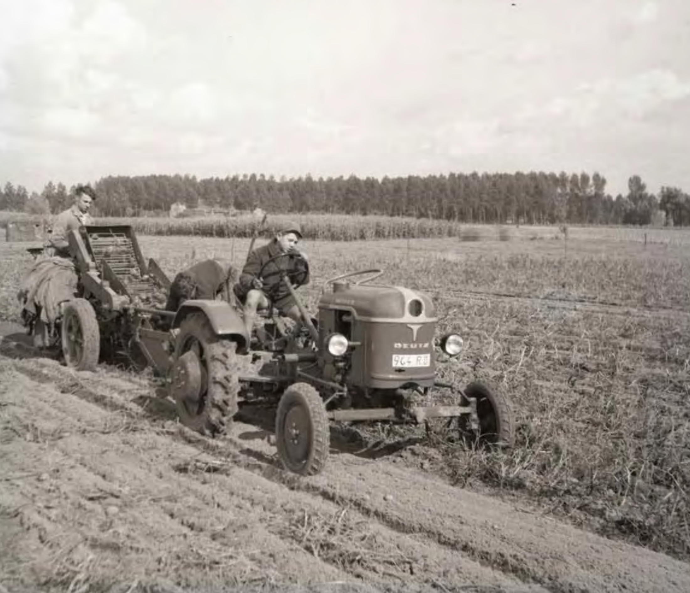
◀ Foto van een tractor met aardappelzakker, jaren 1960. De inzet van tractoren vanaf de jaren 1950-1960 vereenvoudigde het werk op het veld in grote mate.