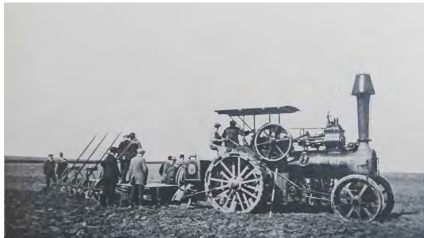
▲ Een Ruston Proctor-stoomtractor op het Concours international de tracteurs et autres appareils de labourage mécanique , 1913. Stoomtractoren kwamen in Europa nauwelijks voor omwille van de te kleine landbouwbedrijven en -percelen.

Vandaag kan iedereen zich zonder al te veel moeite voorstellen wat een tractor is en doet. De