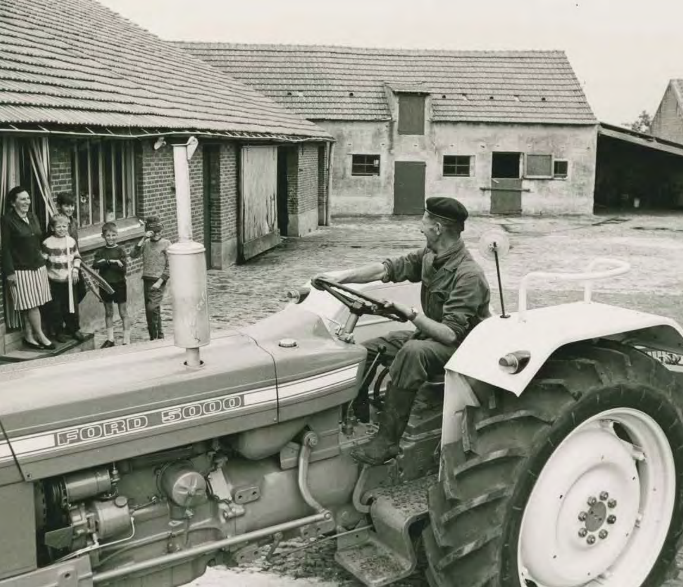
◀ Een boer toont de Ford 5000 aan zijn gezin, 1972. De grote (en in het algemeen dure) tractor staat in schril contrast met de eerder bescheiden boerderij.