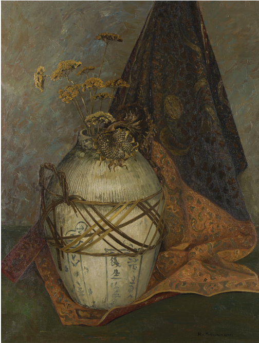
8. Stilleven met Martavaan (1932-33) Olieverf op doek, 75,6 x 58,5 cm (Cat. 012).

Hij was trots toen een afbeelding van één van zijn werken werd opgenomen in een boek over de hedendaagse schilderkunst getiteld Palet (1931), samengesteld door Paul Citroen. Het schilderij was een figuratief werk voorstellende een Hollands winterlandschap met ijs- en schaatstaferelen, echter met op de achtergrond rokende fabrieksschoorstenen (afb. 9). Het was in 1929 onder de titel Rijplandschap tentoongesteld op de voorjaarsexpositie van De Onafhankelijken in het Stedelijk Museum. Door een recensent van het Maandblad voor Beeldende Kunsten werd het een goed voorbeeld van de stijl de nieuwe zakelijkheid genoemd. 4