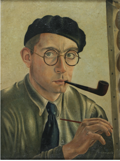
13. Zelfportret [met pijp] (1934 tot 1935) Olieverf op doek, 40 x 30 cm (Cat. 035).