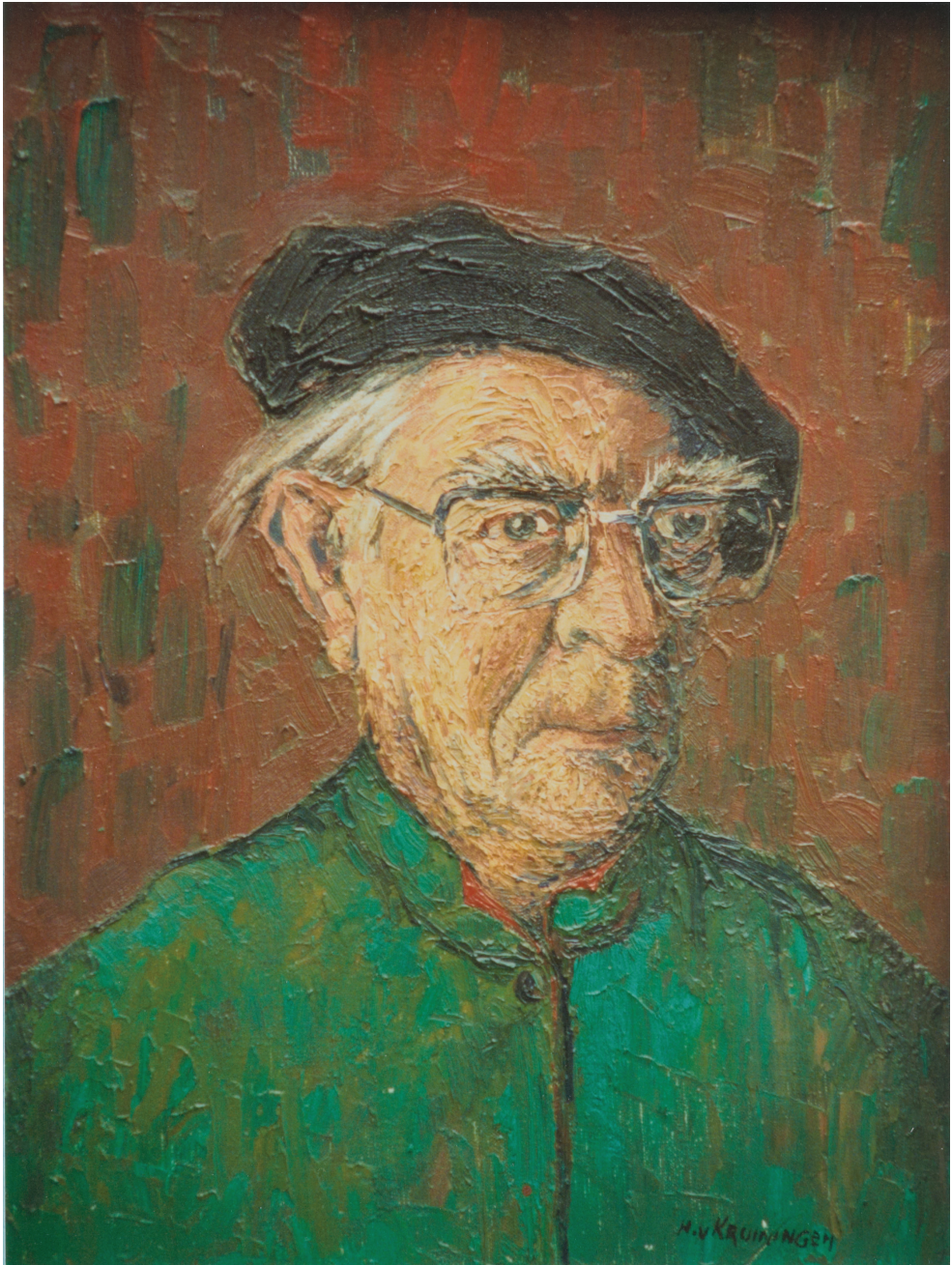
1. Zelfportret (1984) Olieverf op doek, 40 x 30,5 cm (Cat. 894).