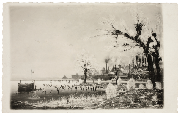
9. Winter Landschap of Rijplandschap (1929) Olieverf op doek (Cat. 011).