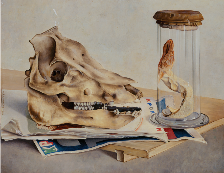
12. Stilleven met zwijnschedel (1932) Olieverf op paneel, 40 x50 cm (Cat. 027).