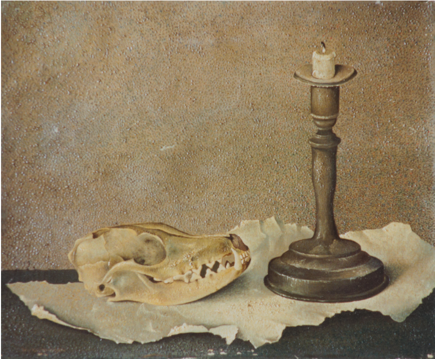
10. Stilven met schedel en kandelaar (1932-1938) Olieverf op doek, 24,5 x 30 cm (Cat. 022).