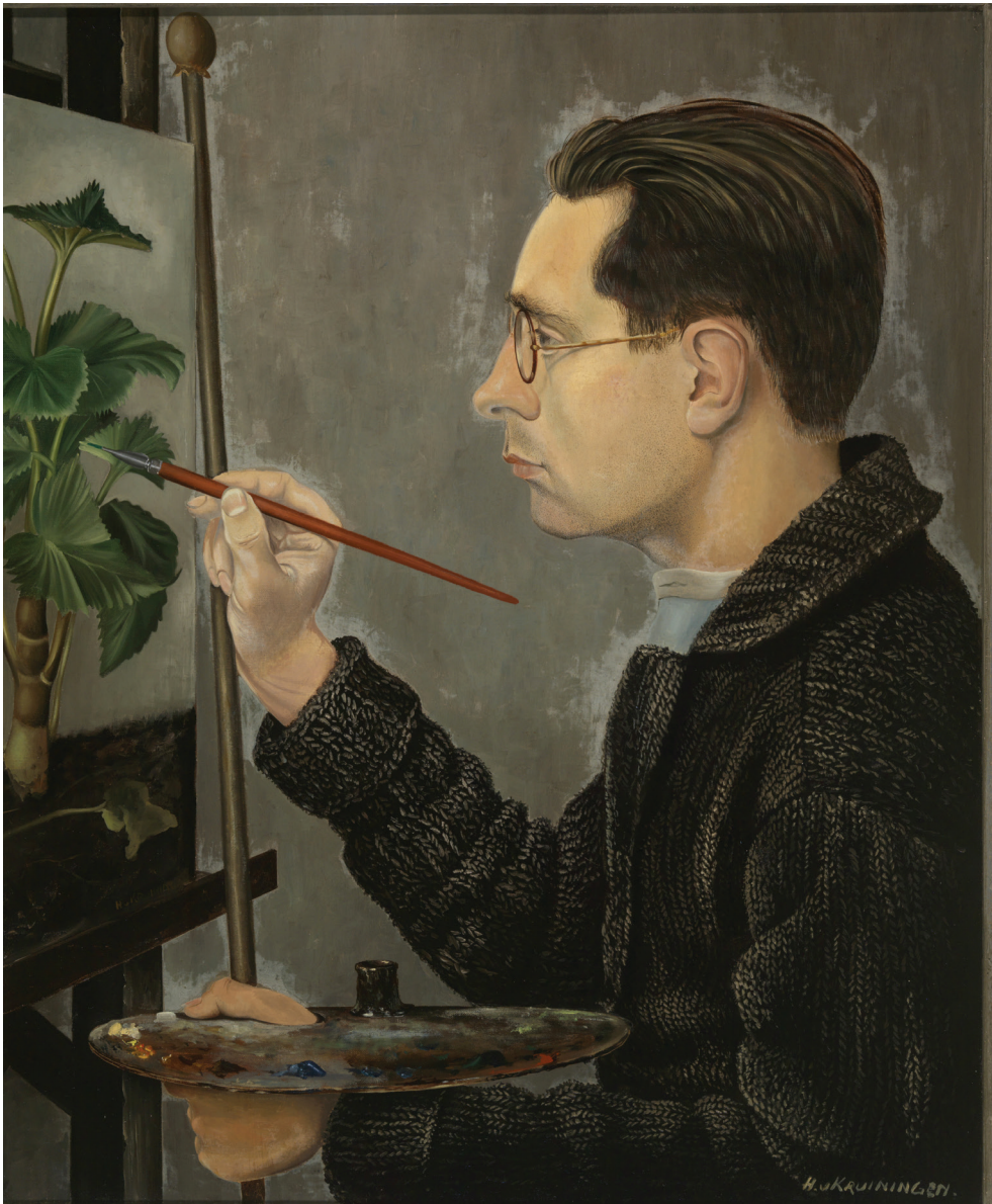
7. Zelfportret (1928) Olieverf op doek, 40 x 30,5 cm (Cat. 003).