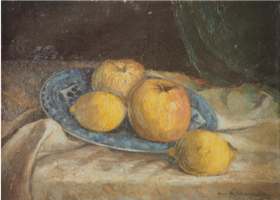
2. Stilven met fruit (1928) Olieverf op doek, 26,5 x 36,5 cm (Cat. 007).