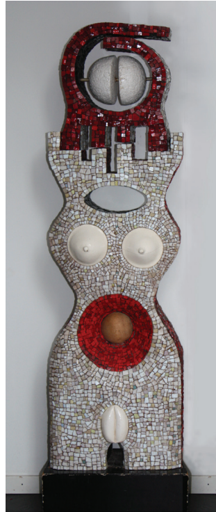
5. Mozaïekbeelden, links een man, 6. Rechts een vrouw (1960?) Hoogte 100 cm (Cat. 676 en 677).