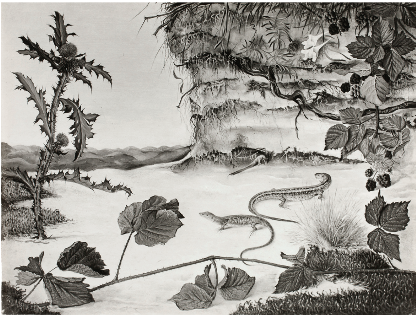
11. Duinpan met hagedissen . Maten en verblijfplaats onbekend (Cat. 013).