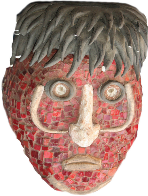
4. Rood masker (z.j.) Glasmozaïek en gips op spaanplaat frame, 25 x 19 x 15 cm (Cat. 675).