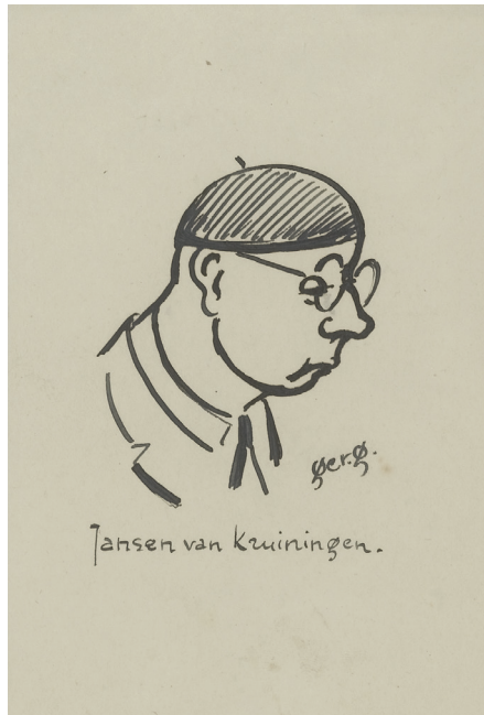
2. Ger Gerrits, Jansen van Kruiningen , z.j..