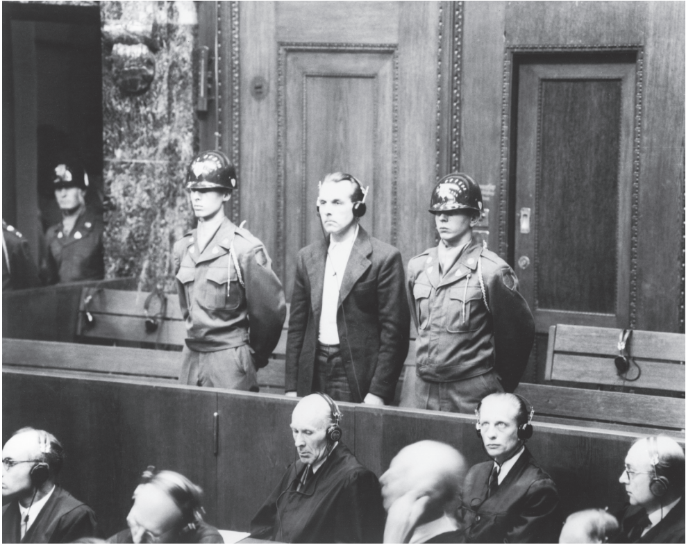
Wolfram Sievers tijdens het zogenaamde Artsenproces in 1947, de eerste van twaalf processen in Neurenberg. In tegenstelling tot het Proces van Neurenberg werden deze processen niet voor een internationaal tribunaal gehouden, maar voor Amerikaanse militaire rechtbanken. Van de 23 verdachten in het Artsenproces werden er zeven vrijgesproken. Negen kregen een gevangenisstraf en zeven de doodstraf, onder wie Sievers.

brief gelezen heb en in algemene zin gehoord heb hoe u werkt, schijnt het mij toe dat u van veel feiten geen weet hebt. 28 Later schrijft Kater dat een nadere studie naar deze groepering de moeite waard is. 29