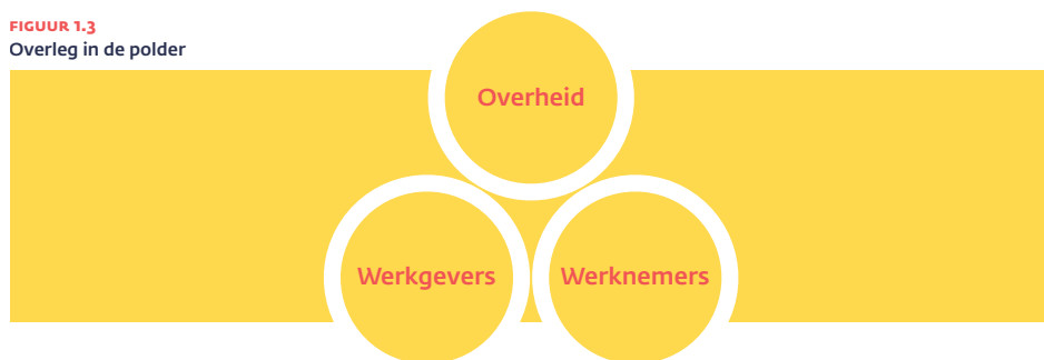
FIGUUR 1.3 Overleg in de polder

Het poldermodel is niet meer zoals het geweest is, althans op macroniveau. 22 De overheid wil zich, in de koers die ze nu vaart, immers zo veel mogelijk terugtrekken uit de driehoek. De Beer en Keune laten dat zien aan de hand van de bezuinigingen op de sociale zekerheid, de verhoging van de pensioenleeftijd, de verlaging en het omzeilen van het minimumloon, de privatisering van overheidsbedrijven en de bevordering van de marktwerking. Tegelijkertijd zien we aan de vraagzijde (de markt), die in Nederland gedomineerd wordt door een diensteneconomie, een groeiende verscheidenheid aan grote en kleine bedrijven, een door centralisatie en overnames toegenomen complexiteit aan organisatie- en HR-vraagstukken, en een voor velen onvoorspelbare toekomst van het bedrijf waarin men werkzaam is. Het bedrijfsleven reageert hierop door beheersing van de loonkosten, meer flexibiliteit en door uitbesteding van werkzaamheden.