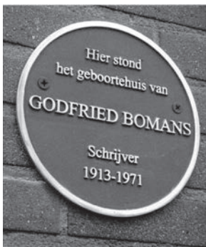
Deze plaquette aan Bierkade 2A in Den Haag werd op 2 maart 2013 onthuld door burgemeester Jozias van Aartsen in het bijzijn van leden van het Godfried Bomans Genootschap. Het was op die datum precies 100 jaar geleden dat de schrijver daar werd geboren.

Ondertussen was hij rechten gaan studeren in Leiden en hij behaalde in korte tijd (van 1911 tot 1913) zijn doctoraal, waarna hij mr. voor zijn naam mocht zetten. Mr. Bomans werkte aanvankelijk als advocaat en procureur, maar kreeg later politieke ambities. Hij was van 1916 tot 1929 lid van de Tweede Kamer. Tevens werd hij in 1916 lid van de gemeenteraad van