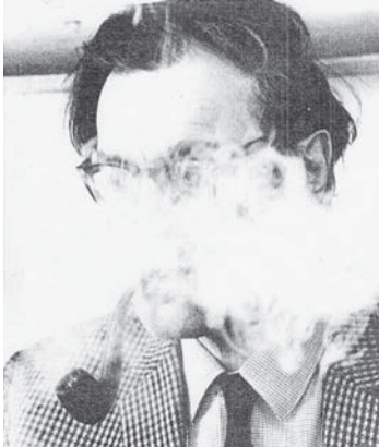
Deze foto geeft symbolisch weer dat Bomans steeds maar rookgordijnen rondom zijn persoon legde.

Het gelovig aanvaarden van de katholieke leer gold, aldus Bomans, zeker voor kinderen in zijn jeugd. ‘Het kind gelooft. Het kent geen twijfel. Voor een kind is op gezag aanvaarden hetzelfde als weten. Denk- en geloofsgrens vallen samen, daartussen bestaat geen niemandsland.’ 41 In geloofszaken waren in de jeugdijaren van Bomans gehoorzaamheid, volgzzaamheid en onderdanigheid kardinale deugden.