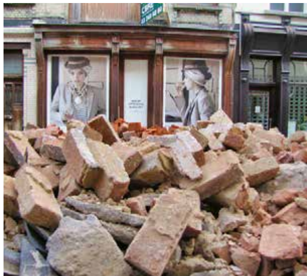
Straatbeeld Antwerpen 2018. Op de puinhopen van wat was.

In een samenleving van individualisme en zelfontplooiing wisselen mensen voortdurend van rol, plaats en betrokkenheid. Waar iemand in de vorige