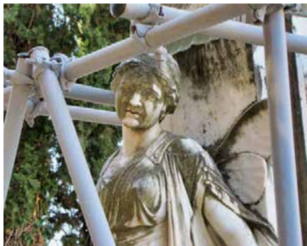
Een engel op een graf op de begraafplaats op het eiland Zakynthos (2000). Staat voorlopig in de steigers, omdat men zich afvraagt of het zinvol is deze te restaureren.

Rond 900 tot ongeveer 500 v.Chr. ziet men als een tijdperk dat een 'startpunt' was voor de westerse filosofie' en deze tijd wordt de 'spiltijd' genoemd. Tijdens de spiltijd treden er veranderingen op, die van grote invloed zijn voor de verdere ontwikkeling in de 'westerse filosofie'. Dit wordt uitgewerkt in het volgende hoofdstuk.