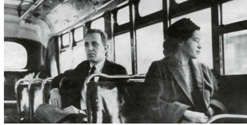
Deze foto van Rosa Parks in de bus werd genomen enkele jaren na de Montgomery-busboycot, door Look Magazine. (Foto: AP.)

radiodj's en schreeuwende koppen beïnvloeden het oordeel.