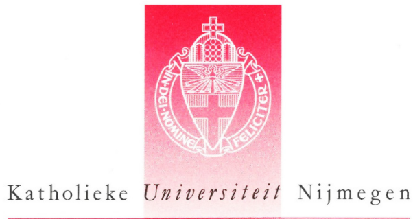
Afbeelding 2: Beeldmerk 1990-2004