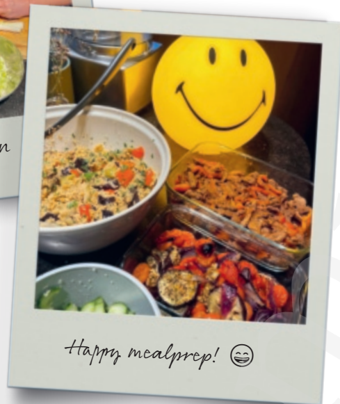
Happy mealprep! 😊