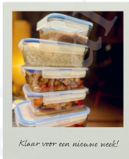
Klaar voor een nieuwe week!

Vaak gaat het nog anders. Hoewel onze maatschappij draait op het model van tweeverdieners, vallen we in ons huishouden nog te gemakkelijk terug op oude, ingeroeste gewoontes van de vorige eeuw. Ook als het gaat over het klassieke rollenpatroon van de vrouw aan de haard of achter het fornuis. Persoonlijk ben ik nogal allergisch voor die rol van 'huismeid'. Ik krijg er instant tranende ogen van, heb last van jeuk en benauwdheid en het wordt heel moeilijk om me nog aantrekkelijk te voelen als partner. Die lose-losesituatie kan ik voortaan gelukkig perfect omkeren met de win-win van het samen koken.