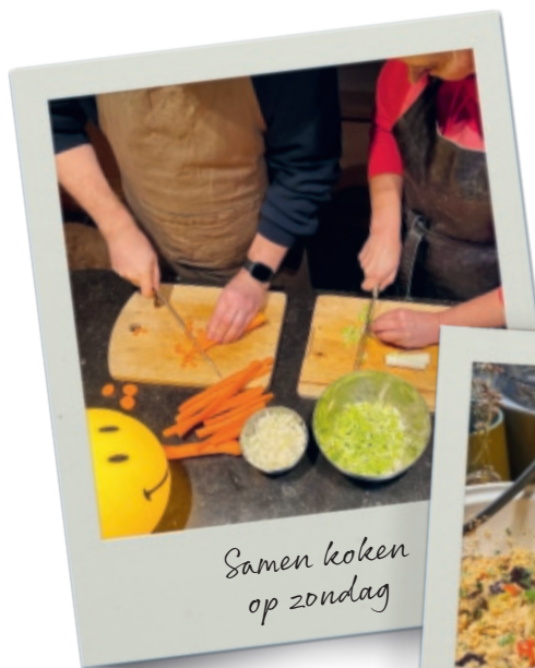
Samen koken op zondag