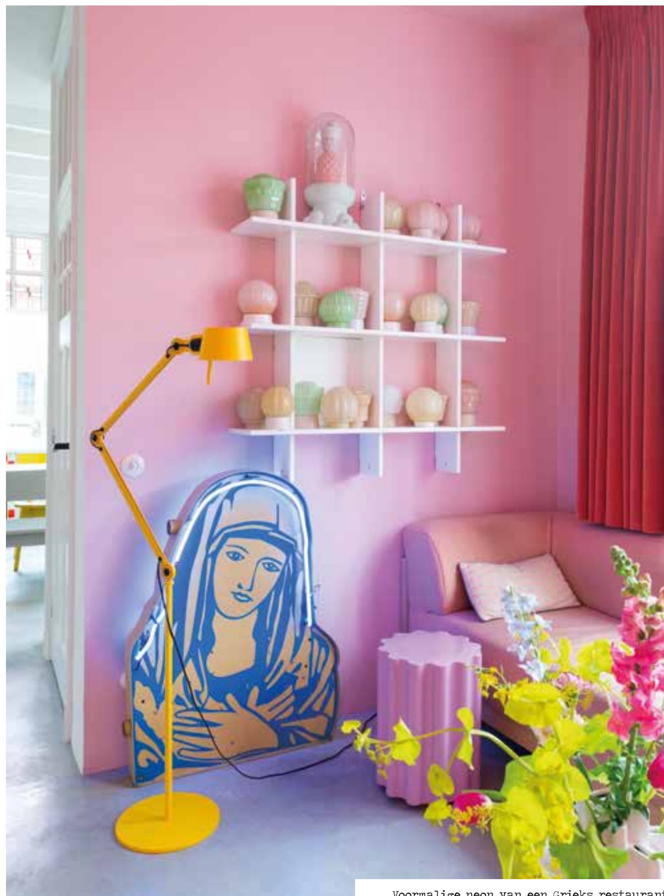
Voormalige neon van een Grieks restaurant