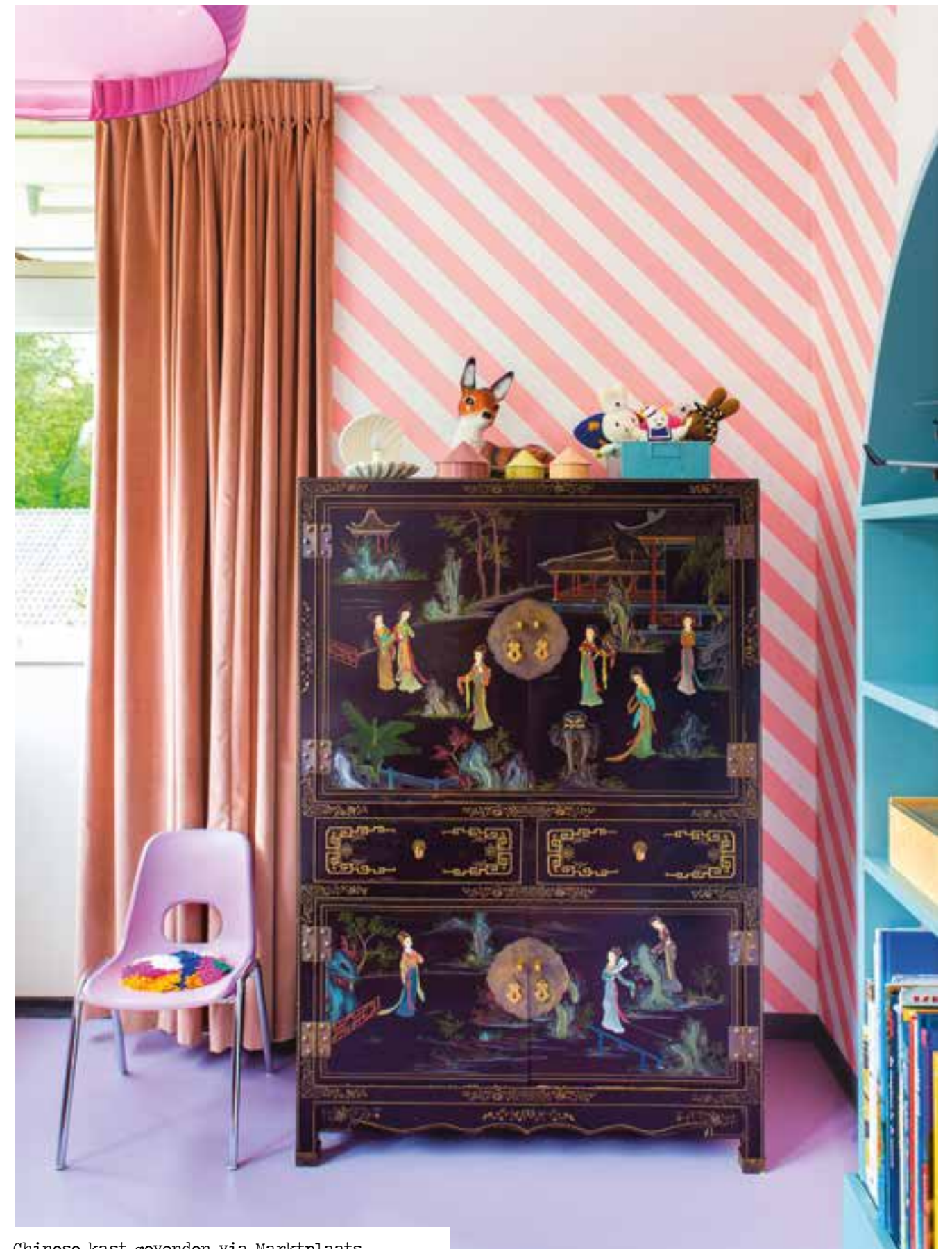
Chinese kast gevonden via Marktplaats

Ga je een verkoopaccount volgen, dan doet Instagram automatisch suggesties voor andere verkoopaccounts die je óók weer kunt gaan volgen.