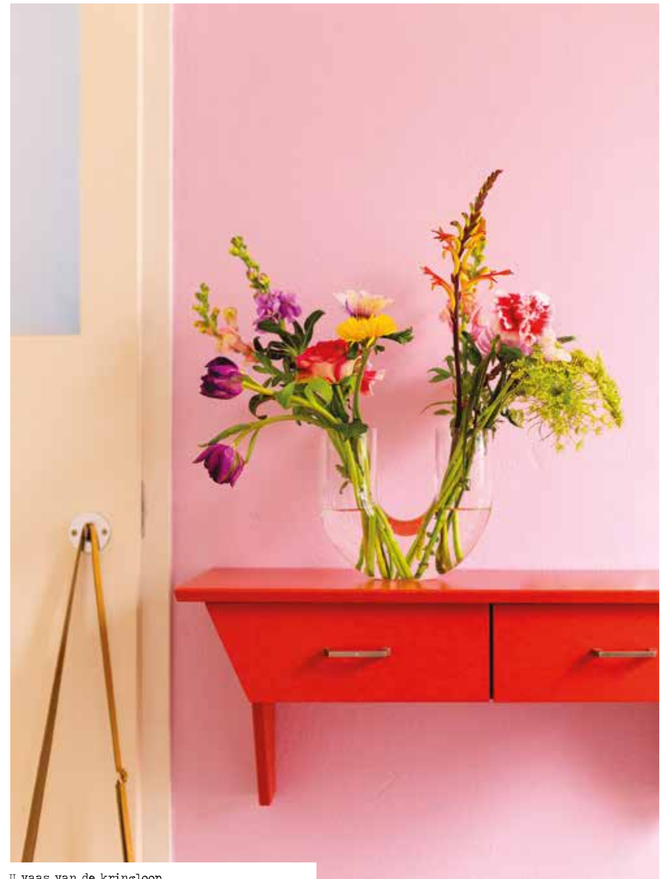
U vaas van de kringloop

Wat je stijl ook is, er ligt altijd iets van jouw gading bij de kringloop. En dat alles is nu precies wat schatgraven zo leuk maakt.